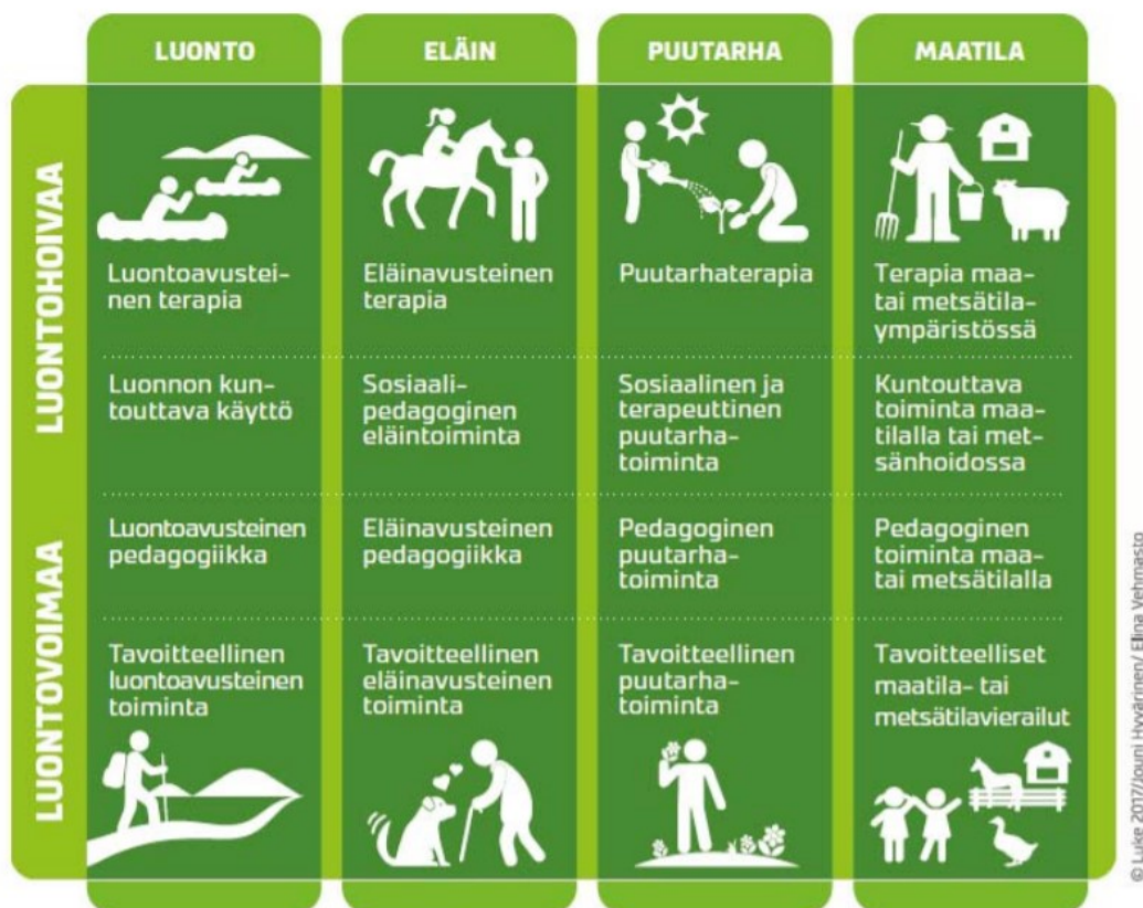
KUVIO 1. Luontohoiva ja luontovoima (Luonnonvarakeskus ym. 2018, 6).

Luontovoimapalveluissa hyödynnetään tietoisesti luonnon hyvinvointivaikutuksia. Palveluille on asetettu asiakaslähtöiset tavoitteet ja niiden toteutumista seurataan. Luontovoimapalveluiksi kuuluvat muun muassa hyvinvointi-, harrastus- ja kasvatustarvikkeet, jotka ovat tavoitteellisia ja tukevat luontoon. Kuka tahansa voi käyttää palveluita ja käyttäjä maksaa palvelun yleensä itse. Luontovoimapalveluiden tavoitteena on asiakkaan terveyden ja yleisen hyvinvoinnin edistäminen. Palveluntarjoajalta ei edellytetä sosiaali- ja terveysalan koulutusta ja toiminnassa noudatetaan palveluntuottaja-alan suosituksia ja säädöksiä. (Kahilaniemi & Löf 2018, 6.) Jako luontohoivaan ja luontovoimaan ei kuitenkaan ole yksiselitteinen, vaan niiden rajapinnoilla on palveluja, joissa molempien piirteet sekoittuvat (Vehmasto 2014, 32).