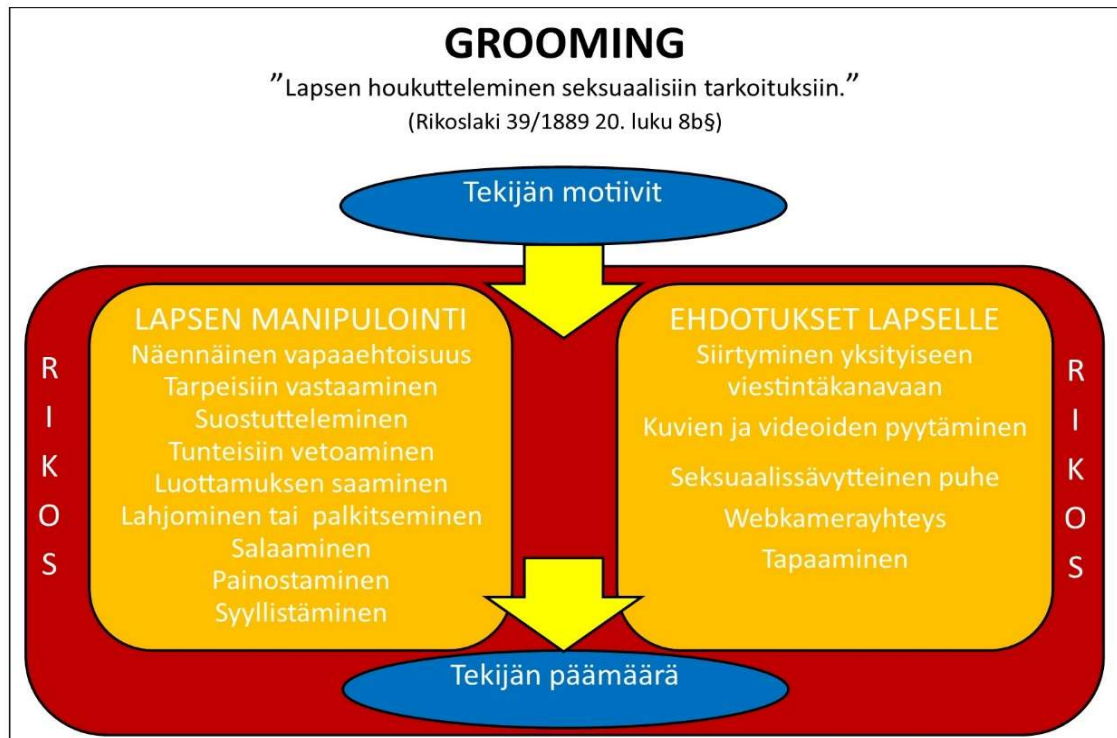
Kuvio 2: Mistä groomingissa on kyse

Tekijän seksuaalissävyytteiset ehdotukset, jotka voivat olla hyvinkin suoria, moni lapsi kokee osaavansa tunnistaa ja torjua (Pelastakaa Lapset 2021a, 20-21). Manipulointia taas voi olla hyvin vaikea havaita. Craven, Brown ja Gilchrist (2006, 295) kuvaavat psyykkisen groomingin pitävän sisällään tunnesuhteen luomisen lapseen esimerkiksi kehujen ja ystävyysuhteen rakentamisen avulla. Manipulointi voi toteutua palkitseminen ja eri tavoin huomioimisen kautta. Keskustelu tekijän kanssa saattaa muuttua seksuaalissävyytteiseksi pikkuhiljaa niin, että se tuntuu lapsesta normaalilta. Osa tekijöistä oikeuttaa seksuaaliset tekonsa lasta kohtaan kertomalla antavansa lapselle seksuaalikasvatusta ja opettavansa lasta tulevaa elämää varten. Tekijä saattaa myös uhkailla ja syyllistää lasta vaatimalla häntä salaamaan yhteydenpidon esimerkiksi sanomalla, että lapsen vanhemmat olisivat hyvin pettyneitä saadessaan tietää asiasta. Kloess, Hamilton-Giachritsis ja Beech (2019, 84) mukaan tekijä pyrkii kääntämään lapsen luontaisen myötätunnon syyllisyyden kokemukseksi esimerkiksi ilmaisemalla pettymystä, surua tai vetoamalla lapsen viestittelyssä tekemiin lupauksiin. (Sillfors 2020, 24-25.)