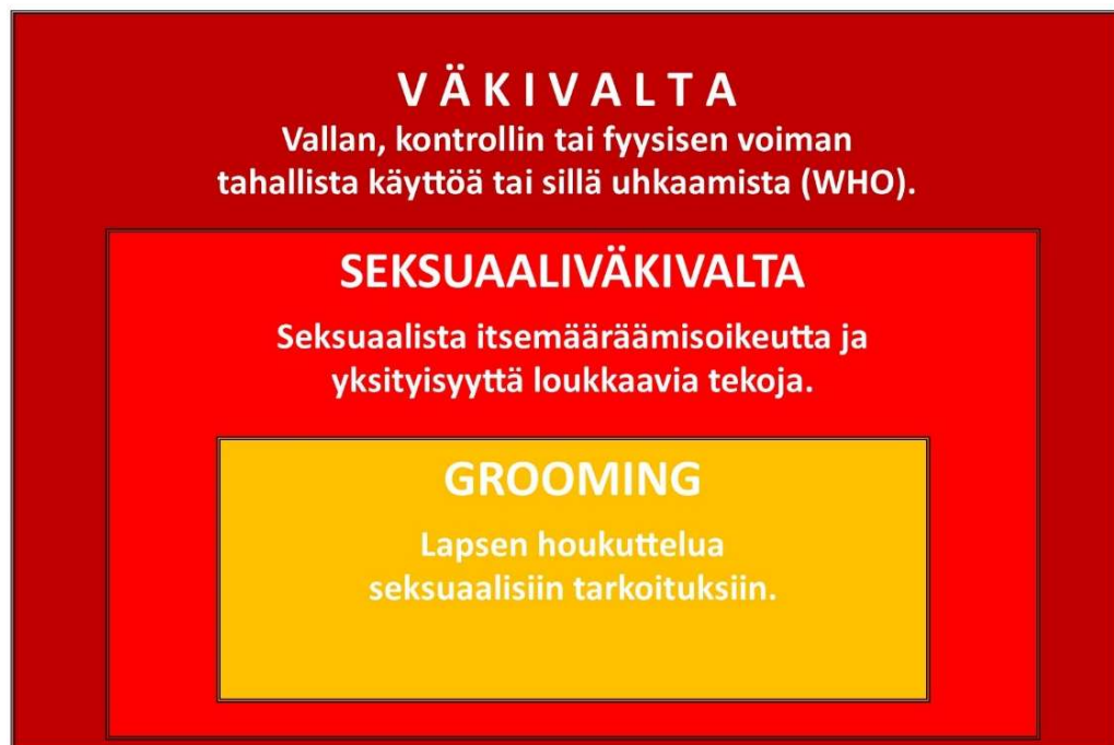
Kuvio 1: Grooming on yksi väkivallan ilmenemismuoto