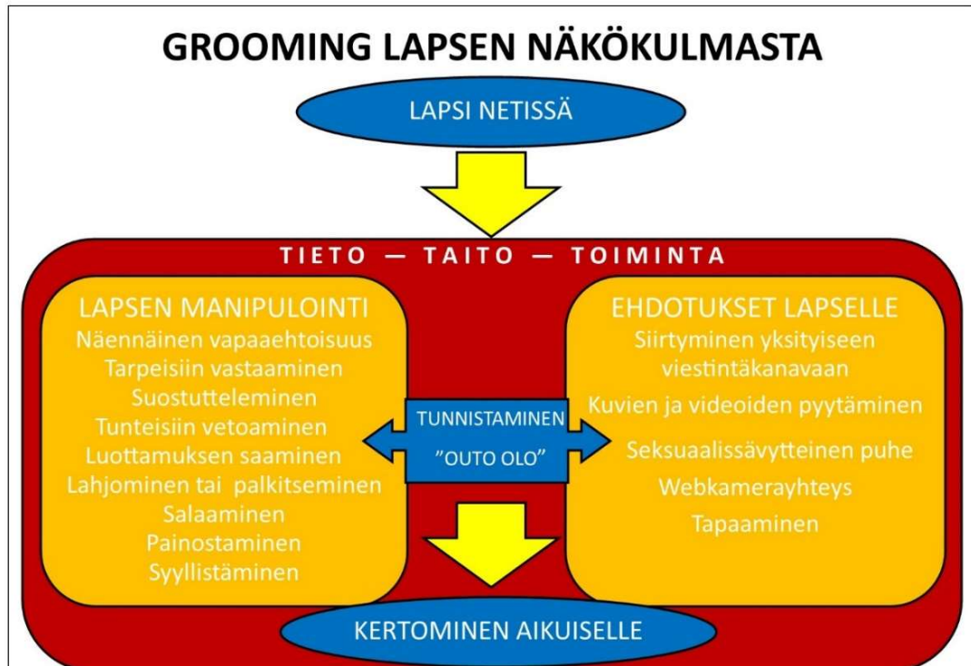
Kuvio 3: Grooming lapsen näkökulmasta

on myös auttaa lasta puhumaan ja luottamaan tunteeseensa, jota osa groomingia kohdanneista lapsista kuvaa ”oudoksi oloksi.” Tunne suojaa lasta, sillä se voi auttaa lasta irtautumaan kontaktista ja kertomaan kohtaamastaan eteenpäin.