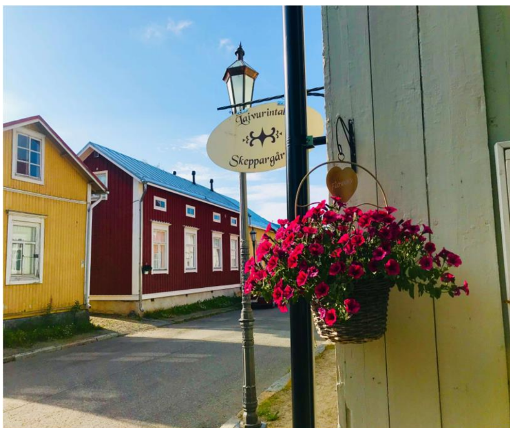
Kuva 2 Kokkolan kansallinen kaupunkipuisto (KKP Esitys).

Suomen uusin kansallinen kaupunkipuisto sijaitsee Kokkolassa. Kansalliset kaupunkipuistot eivät ole yksinkertaisia projekteja, vaan erittäin vaativia toteuttaa. Kokkolan kaupunki valmisteli omaa hakemustaan peräti yli 10 vuoden ajan. Kokkolan kaupunki juhli projektin hyväksymisen aikaan 400-vuotisjuhliiaan. Kansallisten kaupunkipuisto verkostoon Kokkola tuo omanlaisensa erikoisuu- den, maankohoamisilmiön. (Ympäristöministeriö 2020.)