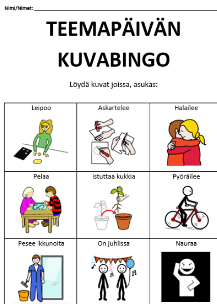
Kuva 1. Teemapäivän kuvabingo

luvassa myös palkinto, joka motivoi kiertämään polun tarkkaan ja löytämään kaikki kuvat.