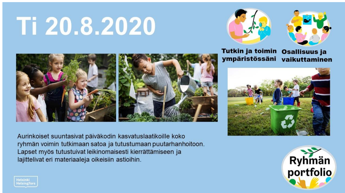
Kuva 5: Esimerkkidia - Puutarha ja kierrätys

Kuvassa 6 on Aurinkoisten ryhmän kolmannen viikon dia. Sen teksti kertoo viikon toiminnasta seuraavasti: ”Jumppasimme pienryhmissä, loruttelimme ja tutustuimme tabletilla kuvaamiseen.” Kuvissa lapset jumppaavat ohjatusti piirissä, osallistuvat piirissä istuen loruhetkeen ja tutkivat pienryhmässä tablettia. Vasutarroina ovat ”Kasvan, liikun ja kehityn”, ”Kielten rikas maailma” ja ”Monilukutaito ja tvt-osaaminen”.