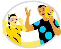
Ilmaisun monet muodot