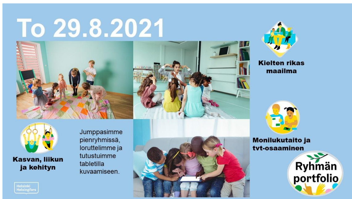
Kuva 6: Esimerkkidia - Jumppa, loruhetki ja tabletti

Kuvassa 6 on Aurinkoisten ryhmän kolmannen viikon dia. Sen teksti kertoo viikon toiminnasta seuraavasti: ”Jumppasimme pienryhmissä, loruttelimme ja tutustuimme tabletilla kuvaamiseen.” Kuvissa lapset jumppaavat ohjatusti piirissä, osallistuvat piirissä istuen loruhetkeen ja tutkivat pienryhmässä tablettia. Vasutarroina ovat ”Kasvan, liikun ja kehityn”, ”Kielten rikas maailma” ja ”Monilukutaito ja tvt-osaaminen”.