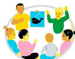
Osallisuus ja vaikuttaminen