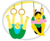
Kasvan, liikun ja kehityn