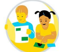
Monilukutaito ja tvt-osaaminen