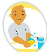
Itsestä huolehtiminen ja arjen taidot