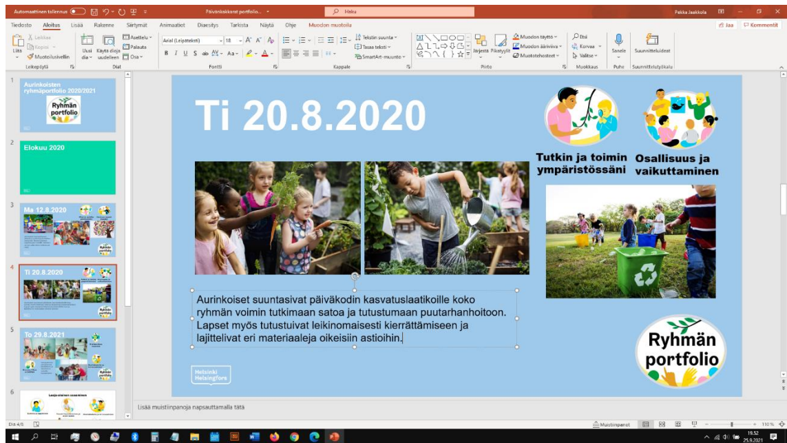
Kuva 1: Portfolio työn alla PowerPointissa

Seuraavaksi on esimerkki siitä (kuvat 2-6), miltä voisi näyttää kuvitteellisen Aurinkoisten ryhmän portfolio. Näissä esimerkeissä käytetään julkaisuvapaita kuvituskuvia. Esimerkkidiat on toteutettu täsmälleen samalla tavalla, kuin tämän opinnäytetyön toiminnallisen tuotoksen portfolioissa on tehty. Kuvassa 2 on kuvitteellisen Aurinkoisten ryhmän ryhmäportfolion etusivu eli ensimmäinen dia ja kuvassa 3 on ryhmäportfolion kuukausi-välisivu.