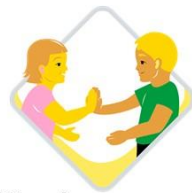
Kulttuurinen osaaminen, vuorovaikutus ja ilmaisu