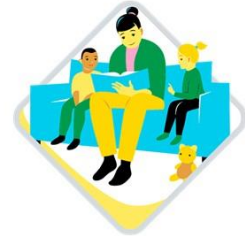
Kielten rikas maailma