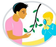
Tutkin ja toimin ympäristössäni