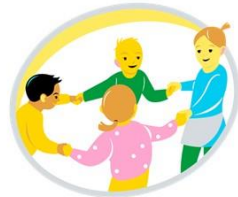
Minä ja meidän yhteisömme