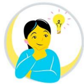
Ajattelu ja oppiminen