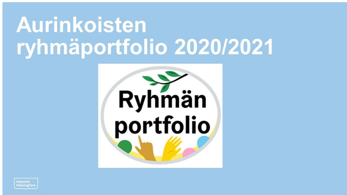
Kuva 2: Esimerkkidia - Portfolion etusivu