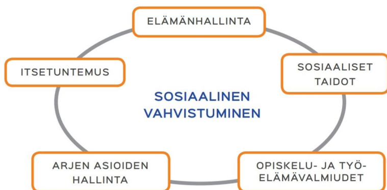
Kuva 3. Sosiaalisen vahvistumisen osa-alueet työpajatoiminnassa ja etsivässä nuorisotyössä (Kinnunen 2016).

Sovari-vaikutusmittari tuottaa tietoa siitä, millaisia vaikutuksia työpajatoiminnalla ja etsivällä nuorisotyöllä on asiakkaisiin. Sovari vastaa etsivää nuorisotyötä ja työpajatoimintaa toteuttavien tahojen tarpeisiin saada tietoa palveluidensa laadusta ja vaikutuksista. Organisaatiot voivat pelata tuloksiaan valtakunnallisiin tuloksiin ja hyödyntää Sovaria oman toimintansa asiakaslähtöisessä kehittämisessä. Sovari-tulosten avulla organisaatiot voivat todentaa toimintansa vaikutuksia rahoittajille ja sidosryhmille. Opetus- ja kulttuuriministeriölle Sovari tuottaa valtakunnallisesti yhdenmukaista tietoa etsivästä nuorisotyöstä ja työpajapalveluista. Sovarilla tähdätään valtakunnallisesti yhdenmukaisen vaikuttavuustiedon saantiin. (Kinnunen 2016.)