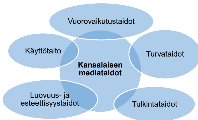
Kuva 3. Kansalaisen tarvitsemia mediataitoja (Eläkeliitto, 2020)

Alla olevaan kuvaan 3 on koottu näkyville kansalaisen tarvitsemia mediataitoja nyky-yhteiskunnassa toimimiseksi sekä avattu niitä kohta kohdalta kuvan jälkeen. Jotta kansalaisen mediataidot olisivat mahdollisimman kattavat ja monipuoliset tulisi tämän hallita vuorovaikutustaitoja, turvataitoja, tulkintataitoja, luovia ja esteettisiä taitoja sekä tietotekniikkaan liittyviä käyttötaitoja.