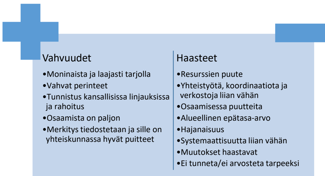
Kuva 2. Suomalaisen mediakasvatuksen vahvuudet ja haasteet (Opetus- ja kulttuuriministeriö, 2019)

Kuvassa 2 haasteet ja vahvuudet ovat listattuna ja siitä näkee, miten osa niistä risteää. Esimerkiksi vahvuutena näkyy osaamisen paljous, mutta haasteena osaamisessa olevat puutteet, eli osaaminen painottuu vain tiettyihin alueisiin ja aiheisiin eikä jakaudu tasaisesti koko mediakasvatuksen kentälle.