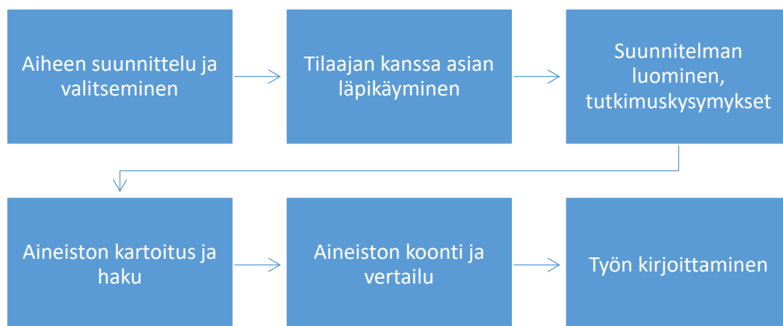
Kuva 5. Opinnäytetyöprosessi 2021

Opinnäytetyön teossa haasteita tuotti kirjallisuuden löytäminen, joka oli odotet- tuakin hankalampaa ja aikaa vievää. Olimme kuitenkin varanneet aikaa run- saasti koko kesälle tehdä aineistohakua, jotta meille ei tulisi kiirettä koota tie- toa yhdeksi kokonaisuudeksi.