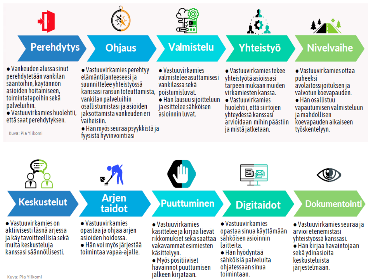
Kaavio 3: Rikoksettomiaan elämäntapaan valmentaminen, Ylikomi 2020

Vastuuvirkamiesmalli on otettu käytäntöön ja vangit on jaettu vartijoille ja rikosseuraamustyöntekijöille ja he toimivat heille omavartija - omavanki systeemillä. Vastuuvirkamiehen tehtävänä on ohjata ja neuvoa vankia häneen liittyvissä asioissa. Vastuuvirkamies käy vangin kanssa rangaistusajan suunnitelmaa läpi ja seuraa rangaistusajan suunnitelman etenemistä. Vangin vapautumisen lähestyessä vanki ja vastuuvirkamies yhdessä päivittävät vapauttamissuunnitelmaa ja pohtivat järjestelyjä, joita mahdollisesti pitäisi tehdä ennen vapautumista. Tarvittaessa tehdään vangin kanssa asumistuki- ja toimeentulotukihakemuksia tai muuhun asumiseen ja toimeentuloon liittyviä asioita. Yhteistyötä tehdään erityisohjaajien kanssa ja tarvittaessa ulkopuolisen yhteistyötahon kanssa. Vastuuvirkamiehen tehtävänä on myös mahdollisen valvotun koevapauden suunnittelu yhteistyössä rikosseuraamustyöntekijän, rikosseuraamusesimiehen ja / tai erityisohjaajan kanssa. (Sav Koos esite 2021.)