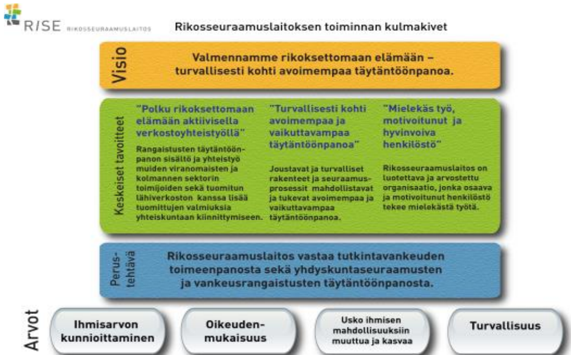
Kaavio 1: Rikosseuraamuslaitoksen toiminnan kulmakivet, Rikosseuraamuslaitos

Rikosseuraamuslaitoksen yhteiskunnallisena lähtökohtana on toiminnassa toteutuva oikeusturva ja yhdenvertainen kohtelu. Tehtävänä on huolehtia turvallisuudesta rangaistuksen täytäntöönpanossa ja edistää yhteiskunnan turvallisuutta. Vuorovaikutteista kuntoutukseen tähtäävää lähtötyötä tehdään jokapäiväisissä kohtaamisissa ja arkipäivän asioissa vankien kanssa. Vuorovaikutuksella luodaan turvallista, rauhallista ja kuntouttavaa ilmapiiriä. (Rikosseuraamuslaitos 2020.)