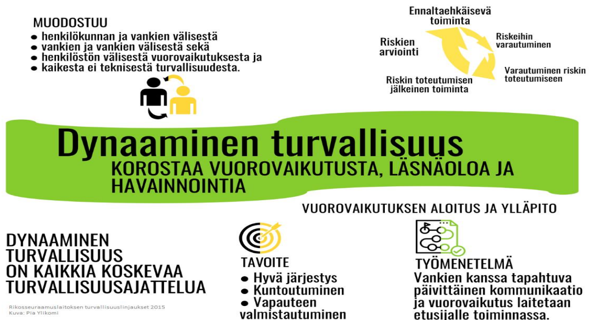
Kaavio 2: Dynaaminen turvallisuus, Ylikomi 2020

Vankilaturvallisuus pitää sisällään kaiken toiminnan mitä vankilassa tehdään. Vankeuslaki määrittelee työskentelytavat ja vangin rajoittamiseen liittyvät asiat. Vankeustuomio ei saa vaikuttaa vangin oikeuksiin ja olosuhteisiin sen enempää kuin on pakollista. Vankeustuomion tarkoituksena on, että aika vankilassa olisi mahdollisimman normaali siviiliin verrattuna. Turvallisuus ja turvallisuusajattelu on siis pohjana hyvään lähityö- ja vastuuvirkamiesmallin mukaiseen työskentelyyn. (Rikosseuraamuslaitos 2020.)