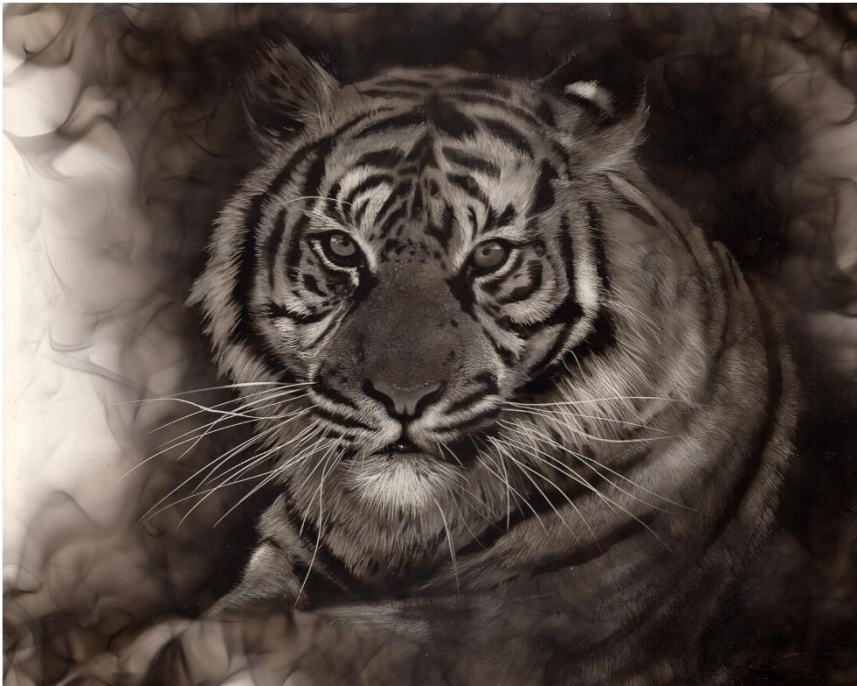
Kuva 4. Spazukin tyylinä on tehdä mahdollisimman realistisia kuvia.