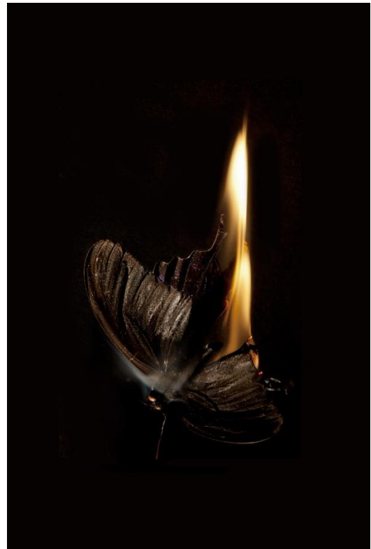
Kuva 8. Teoskokonaisuus "Burning butterflies" Valokuvateos "Burning butterfly 13" / 2013 Kuva: Mat Collishaw