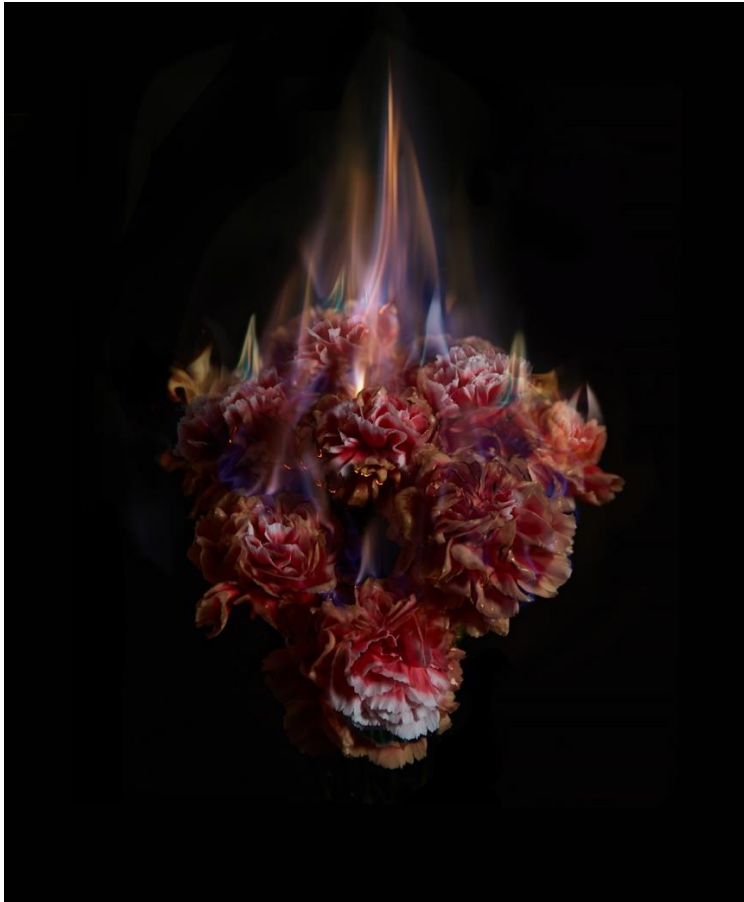
Kuva 6. Mat Collishaw'nin teoskokonaisuudesta "Burning flowers" Valokuvateos "Fading Memories of the Sun" / 2014 Kuva: Mat Collishaw

Mat Collishaw kuvasi projekteja, joissa sytytti asioita tuleen ja tallensi hetken, jolloin liekki leimahti. Kuvat on otettu ennen kuin materiaali on alkanut hiiltyä tai mustua.