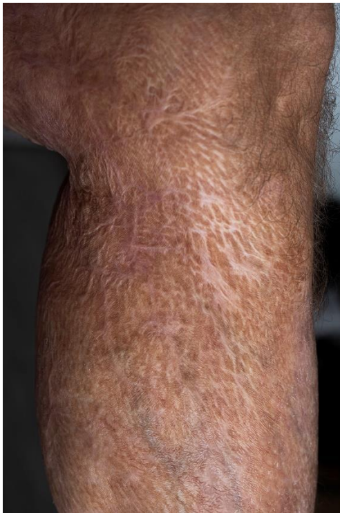
Kuva 11. Parantunut palovamma 2021.