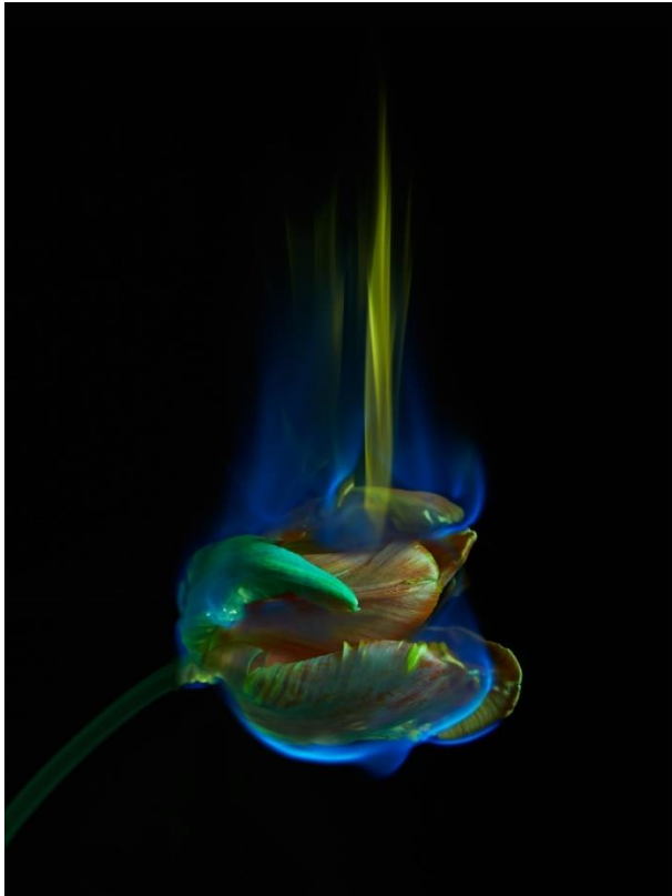
Kuva 7. The Poisoned Page / 2014 Kuva. Mat Collishaw