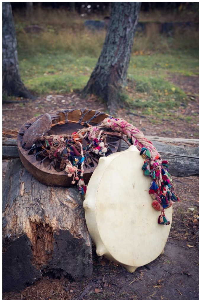
Kuva 15. Noitarumpu ja CV.