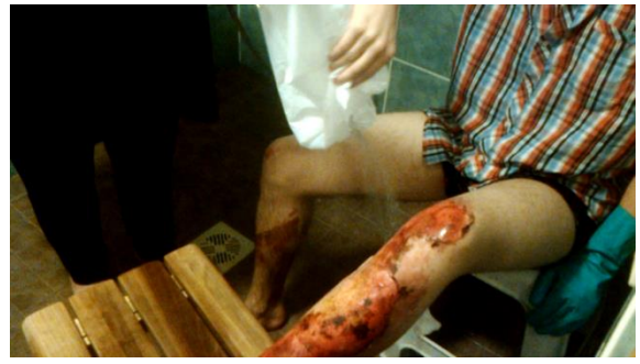
Kuva 10 Kuvakaappaus videosta. Äiti pesee palovammoja 2. 2012