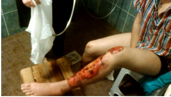
Kuva 9 Kuvakaappaus videosta. Äiti pesee palovammoja. 2012