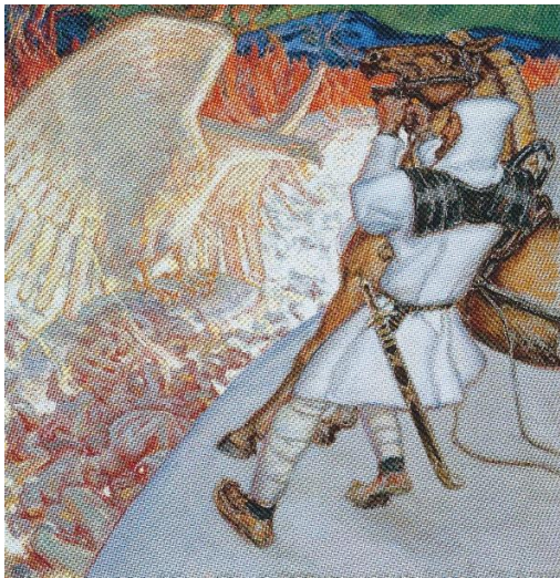
Kuva 2. Akseli Gallen-Kallela, 1920, Lemmikäinen tulijoella

Erään tarinan mukaan Kokkolintu iskee tulta auttaakseen Väinämöistä polttamaan kaskea. Jossain tulen syntykertomuksissa tuli on isketty kokon sulilla. Tästä syntytarinasta otin myös vaikutteita teokseeni. Juhannuskokko on joidenkin uskomusten mukaan saanut nimensä nimenomaan Kokkolinnusta. Palaan Juhannuskokkoon myöhemmin.