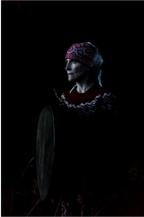
Kuva 16. Potretti kuun valossa.

Koska noituudessa ollaan suurimmaksi osaksi luonnon kanssa yhteydessä, halusin kuvata projektini luonnonvaloa käyttäen. Potretit on kuvattu kuun valossa, ilman lisävaloja. Näin sain myös hieman mystistä tunnelmaa sekä tietynlaista mielenmaisemaa, mikä kuvasti omasta mielestäni aihetta. Projektissa otin myös näkökulmaksi henkimatkan.