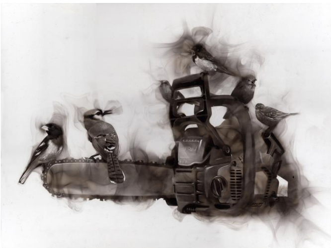
Kuva 3. Steven Spazuk maalaa elävällä liekillä paneelille. Activities , 2020, Steven Spazuk.