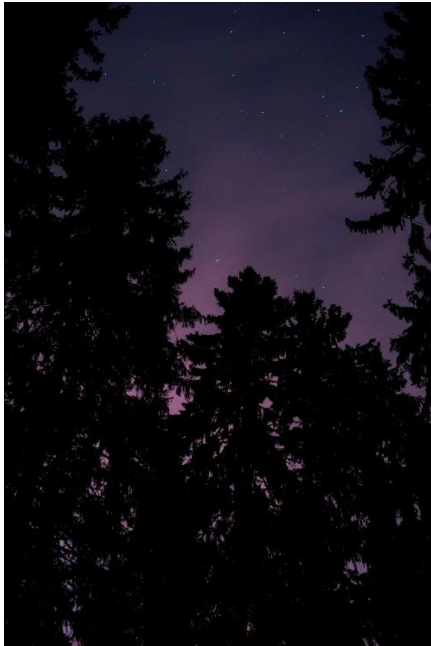
Kuva 17. "Henkimatka"2019