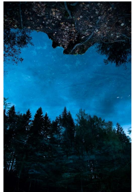
Kuva 19. "Toinen maailma" 2019