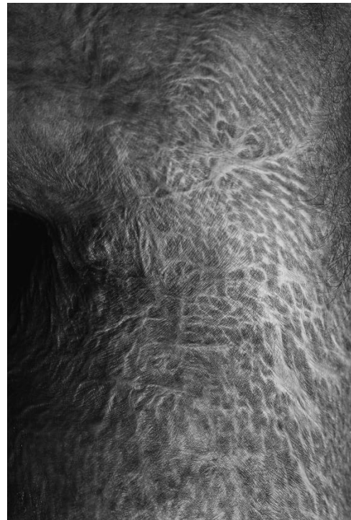
Kuva 12. Arven tekstuuri 2021

Ensimmäiset kaksi vuotta pelkäsin olla tulen lähellä ja häpesin tapahtunutta. Sitten aloin taas tottua tulen läsnäoloon. Tuli ei ollut enää se sama elementti, jota halusin käyttää hyödyksi polttaen asioita. Minun ja tulen välille syntyi syvä yhteys, mitä on vaikea selittää.