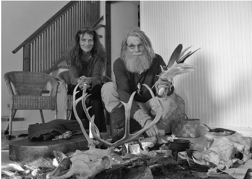
Kuva 14. Susanna ja Johannes.