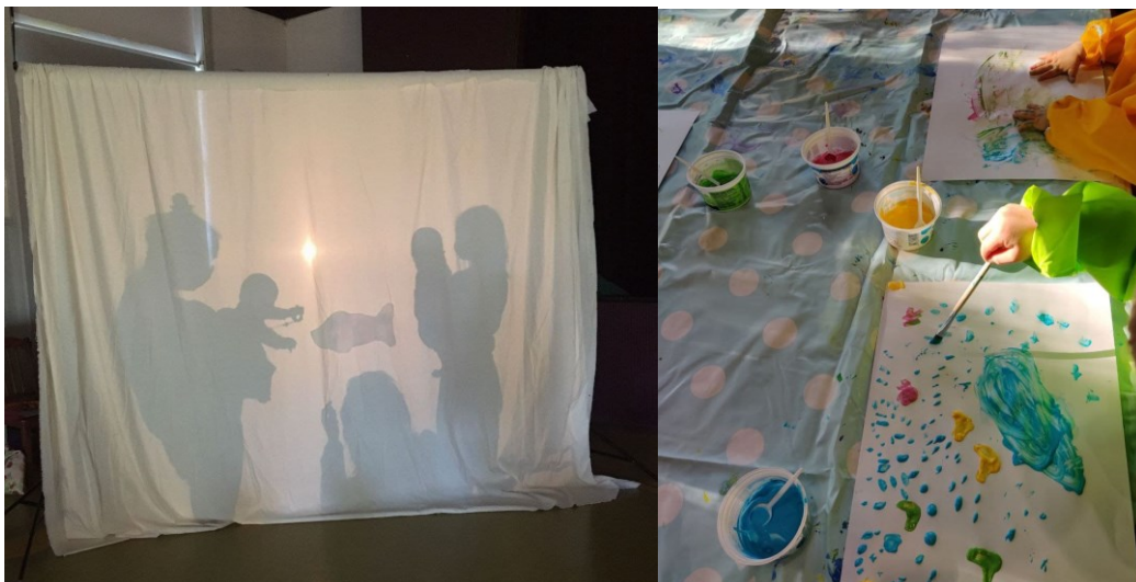
Kuva 3. Varjoteatteria ja syötäviä sormivärejä

Toiminnan jatkuessa elokuussa perheiltä tuli hirveästi positiivista palautetta. He olivat kovasti odottaneet toiminnan jatkumista. Palautteista nousi positiiviseksi asiaksi ohjattu taidetoiminta, ja perheet olivat yleisesti toiminnan monipuolisuudesta mielissään. Lilla Villanin sijainti oli monille perheille oivallinen. Palautteissa toivottiin vielä enemmän toimintaa nimenomaan vauvoille. Tämä toive toteutettiin ja vauvoille järjestettiin omat syötävät sormivärit (kuva 3) joka kerralle. Syksyn edetessä toimintaan osallistui uusia perheitä ja rajoitustoimenpiteen helpottivat. Tiloissa ei syyskuussa ollut rajattua henkilömäärää, mutta turvavälit säilytettiin edelleen ja toimintaan osallistuneilla aikuisilla oli maskit käytössä.