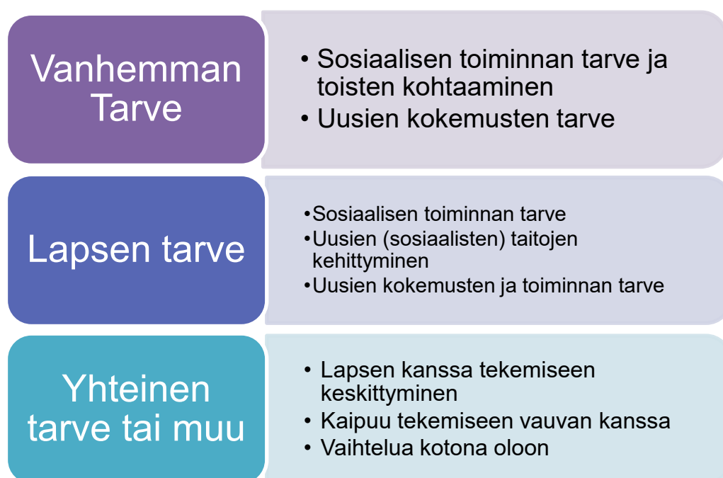
Kuvio 2. Teemat toimintaan osallistumiselle

Keväällä 2021 kerätystä alkukartoituskyselystä nousi esille tarve toiminnalle kodin ulkopuolella ja nämä tarpeet saivat perheet osallistumaan touhuaamujen toimintaan mukaan. Alla olevassa kuviossa (kuvio 2) ovat teemat ja alateemat sille, miksi perheet osallistuivat touhuaamujen toimintaan: