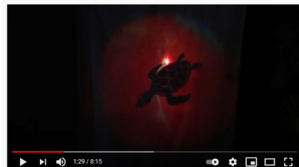
Lilla Villans Pysselmorgnar: Sagan om den pratsamma sköldpaddan – del 6