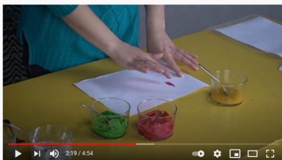
Touhuaamut osa 3: Maalataan

Osa 4: Pöytäteatteri https://www.youtube.com/watch?v=dbQNINKWwTs