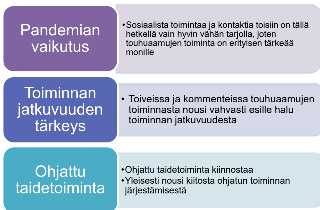
Kuvio 3. Yleiset teemat alkukartoituskyselyssä

Kuviossa 3 näkyvät yleiset teemat ja tulokset, jotka nousivat alkukartoituskyselyiden vastauksissa esille: