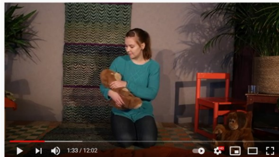
Lilla Villanin Touhuaamut Lorutellaan osa 2

Osa 3: Maalataan https://www.youtube.com/watch?v=q3nXzVI-2Pg