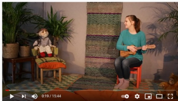
Lilla Villanin Touhuaamut Lauluuokio osa 1 mov

Osa 2: Loruja https://www.youtube.com/watch?v=1BI5MapTb5c