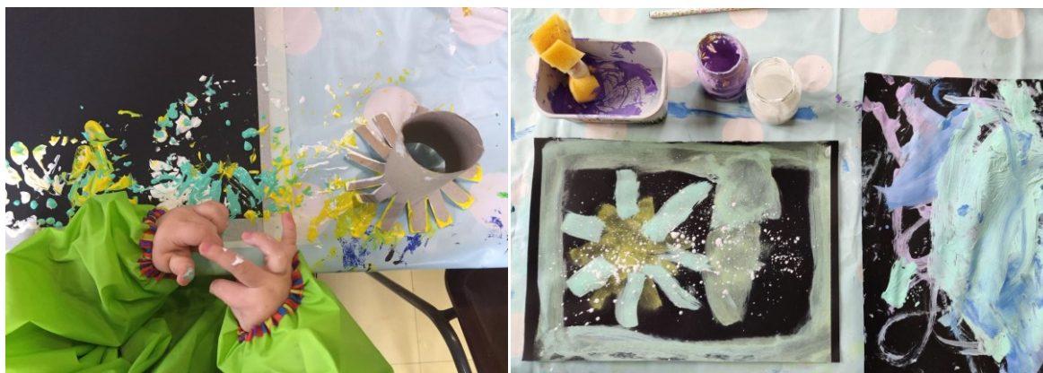
Kuva 2. Rakettimaalausta sekä lumisade "töpöttelyä"

Ensimmäisillä kerroilla tiloihin tutustuttiin rauhassa, mutta hyvin nopeasti tilat ja touhuaamuissa työskentelevät aikuiset tulivat tutuiksi. Maalaushetkille osallistuttiin muutama perhe kerrallaan ja se sujui hienosti ja välineet olivat toimivia. Valikoidut taidepuuhat olivat perheille mieluisia. Maalausvälineissä oli huomioitu hyvin niin vauvat kuin isommatkin lapset sekä aikuiset. Esimerkiksi käytimme useamman kerran välineenä vessapaperirullaa ja töpötyssiveltimiä (kuva 2). Teimme syksyllä myös omat sormivärit vauvoille kookoskermasta ja elintarvikeväreistä.