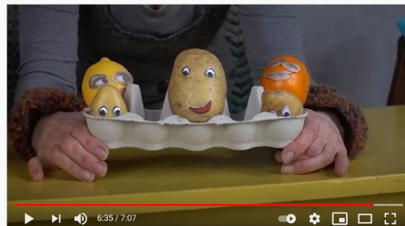
Lilla Villanin Touhuaamut – osa 4: Perunakaverit