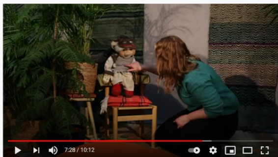
Lilla Villans Pysselmorgnar: Rim & ramsor – del 5

Osa 6: https://www.youtube.com/watch?v=9D2bZhdO60M