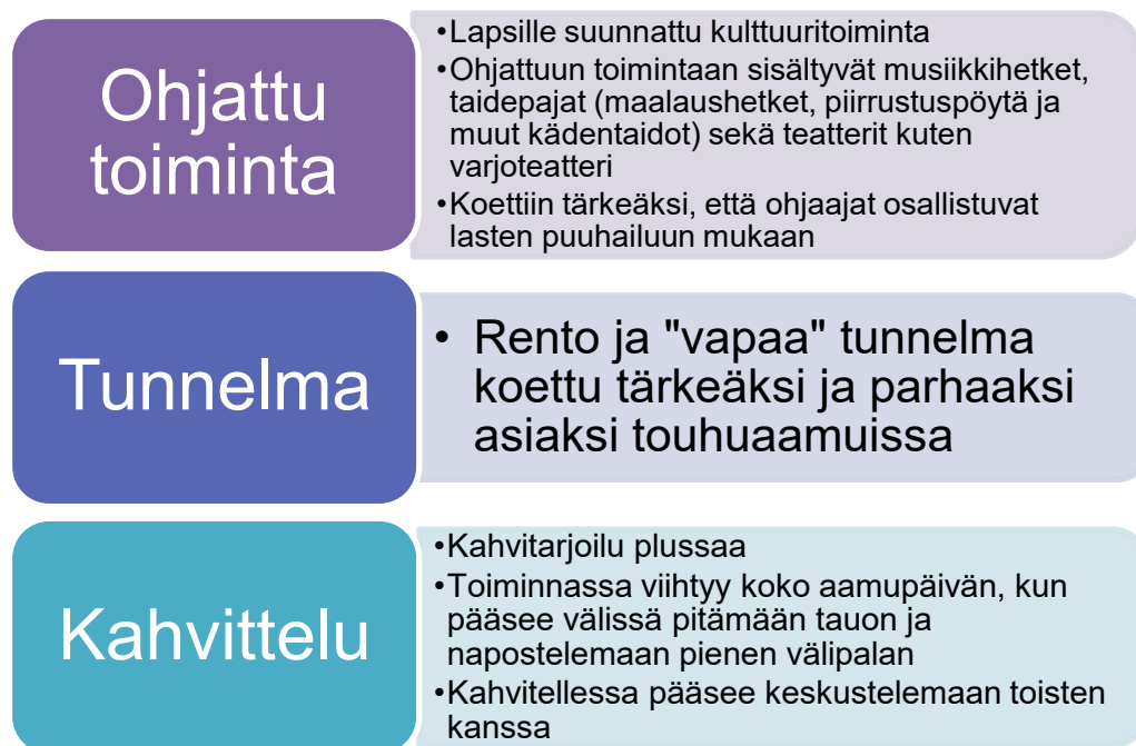
Kuvio 4. Teemat toiminnan parhaista ja tärkeimmistä puolista

Touhuaamujen toiminnan parhaiksi ja tärkeimmiksi asioiksi nousivat ohjattu toiminta, rento ja vapaa tunnelma sekä kahvihetki aamupäivän aikana. Ohjattu toiminta nousi jo alkukartoituskyselyssä, mutta kahvittelua ei alkukartoituskyselyn mukaan pidetty vielä niin tärkeänä osana toimintaa. Alkukartoituskyselyssä sisältöä koskevassa Likertin asteikossa vähiten tärkeäksi koettiin ruokailumahdollisuus sekä yhteiset luku/leikkihetket lapsen kanssa. Havainnoinnin sekä loppukyselyn perusteella vanhemmat olivat kuitenkin olleet mielissään ruokailumahdollisuudesta. Lähes jokainen perhe kävi syömässä joko omia eväitä tai tarjolla olleita ruokia ja juomia touhuaamun aikana.