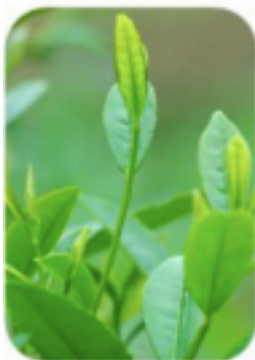
Kuvio 6 Camellia sinensis (Armstrong ym. 2019.)

Teepuita on neljää eri lajia, sinensis , assamica , pubilimba ja dehungensis . Kahta ensimmäistä käytetään eniten teen tuotannosta ihmisten käyttöön. Teepuita kasvaa eteläisessä ja itäisessä Aasiassa. Suurin teen tuottajamaa on Kiina, mutta sitä valmistetaan myös Intiassa, Keniassa ja Sri Lankassa. Kiinassa kasvatetaan ja valmistetaan noin 40 % teestä. Mustan teen osuus maailman tuotannosta on 75 % ja vihreän 15 %. Tee on eritavoin prosessoitua uutetta Camellia sinensis lehdistä. Tee on yksi maailman suosituimpia juomia veden lisäksi. Se voidaan jakaa useaan eri kategoriaan, valmistuksesta riippuen. Valkoinen ja vihreä tee eivät ole käyneet ollenkaan, musta taas on käymisteitse valmistettu. Teetyyppejä on kuusi erilaista, valkoinen tee, oolong tee, musta tee, vihreä tee, keltainen tee ja tumma tee. Kiinalainen ja japanilainen vihreä tee ovat valmistettu Camellia sinensis var sinensis lehdistä, ja musta tee taas Camellia sinensis var assamica lehdistä (Ahmed, Kavalier, Kennelly, Lyles & Unachukwu 2010). Teellä on myös ravitsemuksellisia hyötyjä, kuten virkistäminen, lievä stimulointi ja hyvänolon tunne. Stimulointi johtuu sen sisältämästä kofeiinista. Teen myyntihinta on alhainen, mikä selittää myös sen suosiota. Alla kuva Camellia sinensis lehdestä. (Armstrong, Granato, Ho, Santos, Zhang & Zhou 2019, Hamilton-Miller 1995.)