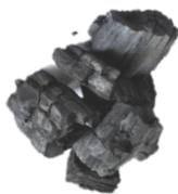
Kuvio 7 Bambuhiili (Helavirta 2021.)

Bambu on yksi hyödyllisimmistä kasveista maailmalla. Vaikka bambu näyttää puulta, se luokitellaan kuitenkin kasviksi. Ilmaston lämmittäessä, resurssien vähentyessä ja metsien vähentyessä, on bambu hyvin tärkeä osa ekosysteemiä. Bambusta saatava hiili tunnetaan myös nimellä musta timantti. Aiemmin on käytetty enemmän puuhiiltä, mutta ympäristöystävällisistä syistä sen käyttö on kielletty ja bambuhiiltä on alettu käyttämään sen tilalla. Bambu on nopeakasvuinen ja saavuttaa täysikasvuisuuden neljän ja kahdeksan vuoden välillä. Bambulajeja on maailmassa yli 1200. Bambuja kasvaa eniten Aasiassa, Amerikassa ja Afrikassa. Monet maatalousyhteiskunnat käyttävät bambuhiiltä kaasun, öljyn tai sähkön tilalla. Alla kuva hiilestä. (Dwivedi, Jain, Patel & Sharma 2014.)