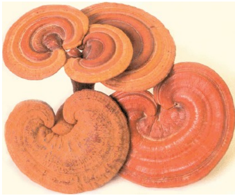
Kuvio 5 Ganoderma lucidum (Benzie ym. 2011.)

Reishiä kasvaa kuolleiden tai kuivuvien puiden, kuten tammen, vaahteran, jalavan, pajun ja magnolian kuoreissa. Sientä ei voi käyttää ravinnoksi, sen sitkeyden vuoksi. Maailman laajuisesti reishilajeja on löydetty yli 250. Reishilajeja kasvaa kaikkialla maailmassa vähän eri muotoisina ja värisinä (Benzie ym. 2011). G. lucidum on kuitenkin yleisesti käytetyin laji. Reishi on ollut aikaisemmin suosittu raaka-aine ja vaikeasti löydettävissä, mikä on aiheuttanut sen kalleuden. Vielä 1950-luvulla G. lucidum on kasvanut vain pieniä määriä luonnossa ja sitä on ollut vaikea löytää. Reishin keinotekoinen kasvattaminen on onnistunut 1970 alkaen ja siitä lähtien sen käyttö on lisääntynyt ja ollut edullisempaa. Alla kuva reishistä. (Wasser 2005.)