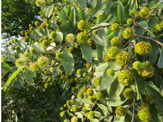
Kuvio 4 Anogeissus leiocarpus (Assede 2013.)

aknen hoidossa yhdistettynä saveen. Originsin tuotteissa käytetty Anogeissus on incissä nimellä Anogeissus leiocarpus bark extract. Alla kuva Anogeissus leiocarpus (Amupitan ym. 2009, Gbadegesin, Odunola & Olugbami 2015.)