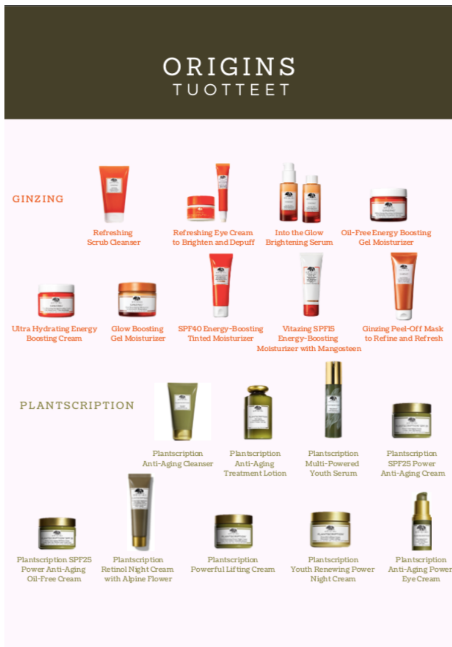
Kuvio 1 Originsin tuotesarjat

Originsille kuuluu tällä hetkellä kuusi päätuotesarjaa, jotka ovat GinZing, Plantscription, Maga-mushroom, A Perfect World, Clear Improvement ja Original Skin. Seuraavissa kappaleissa on esitelty tarkemmin tässä opinnäytetyössä oleelliset sarjat valittujen raaka-aineiden perusteella ja lyhyesti myös muut Originsin tuotteet. Tuotteiden perusteella valitut raaka-aineet esitellään teoriassa tarkemmin. Kaikki tuotesarjat esitellään oppaassa mahdollisimman yksinkertaisesti KICKSin kosmetiikkamyyjän myynnin tueksi. Opas löytyy liitteenä työn lopusta. Ohessa vielä opinnäytetyössä käsiteltyjen tuotteiden kuvat ja nimet.