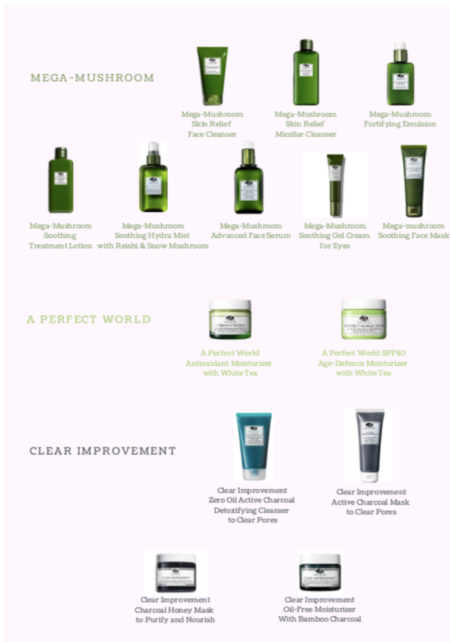
Kuvio 2 Originsin tuotesarjat