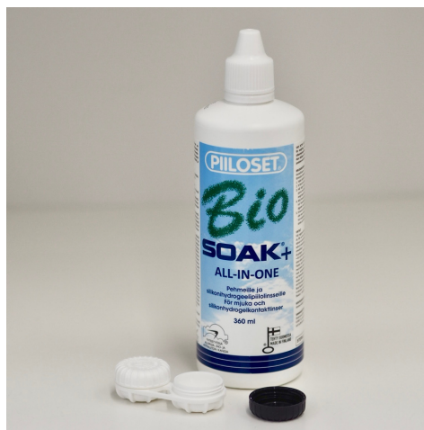
Kuva 11. Esimerkki piilolinssinesteestä

Aina kun avaat uuden piilolinssinesteen, ota käyttöön uusi kotelo.