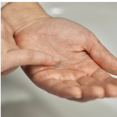
Kuva 10. Linssin puhdistaminen