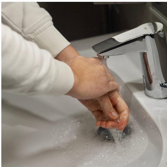
Kuva 1. Käsien peseminen