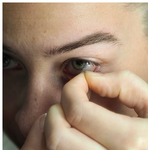
Kuvat 8. ja 9. Linssin pois ottaminen silmästä