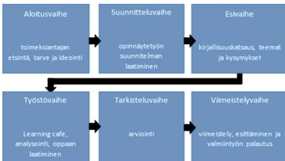
Kuvio 2. Opinnäytetyöprosessimme kuvattuna Salosen konstruktivistista mallia mukaillen. (Salonen 2013, 20.)

Aloitusvaiheessa etsitään kehittämistarvetta sekä toimeksiantajaa (Salonen 2013, 17), joten keskustelimme alkuvuodesta 2021 toimeksiantajan kanssa, joka ehdotti omaa henkilöstöltä noussutta tarvetta opinnäytetyömme ideaksi. Sovittuamme toimeksiantajan kanssa idean eteenpäin viemisestä, rajasimme aihetta, sillä realistinen rajaaminen on opinnäytetyön selkeyttämisen kannalta merkityksellistä (Salonen 2013,17).