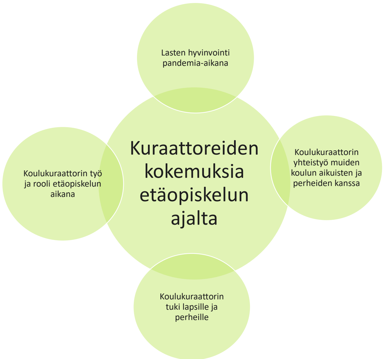
Kuvio 3. Pääteemat

Tässä luvussa esitellämme tutkimuksemme tulokset. Järjestelimme aineiston teemoihin, jotka esitetään kuviossa 3. Aineistosta nousi esiin neljä pääteemaa, jotka ovat lasten hyvinvointi pandemia-aikana, koulukuraattorin yhteistyö muiden koulun aikuisten ja perheiden kanssa, koulukuraattorin tuki lapsille ja perheille sekä koulukuraattorin työ ja rooli etäopiskelun aikana.