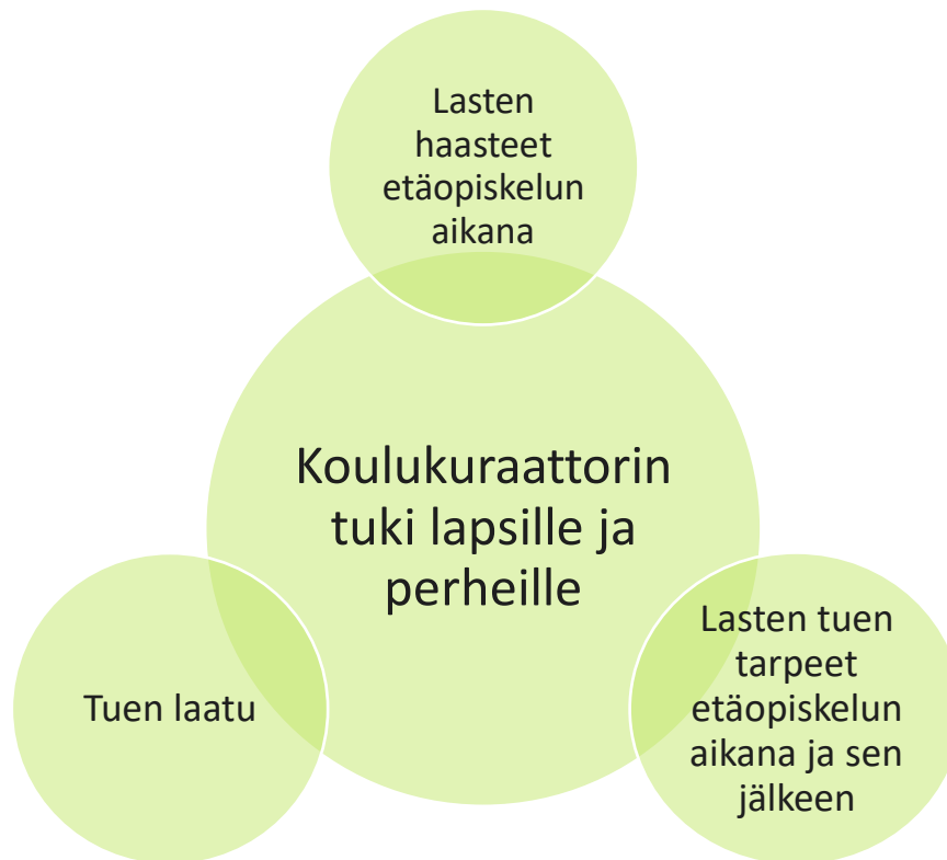
Kuvio 6. Koulukuraattorin tuki lapsille ja perheille

Lasten haasteet etäopiskelun aikana. Kaikki haastateltavat toivat esille yhteneviä ajatuksia lasten kokemista haasteista etäopiskelun aikana. Jo hyvin pientenkin lasten on täytynyt ottaa aiempaa enemmän vastuuta omasta koulunkäynnistään. Lapsilla on ollut vaikeuksia pysyä mukana opetuksessa, koska kaikilla oppilailla ei ole samanlaisia mahdollisuuksia saada opiskeluun aikuisen tukea. Niin kotona kuin kouluissakin on erilaiset resurssit ja mahdollisuudet tukea ja auttaa lasta koulupäivän aikana. Monet vanhemmat ovat töissä lapsen koulupäivän aikana ja joissain tapauksissa huoltajat ovat muuten kykenemättömiä auttamaan lasta koulutehtävissä. Lisäksi se vaihtelee, miten paljon ja kuinka usein opettajat ovat yhteydessä lapsiin koulupäivän aikana.