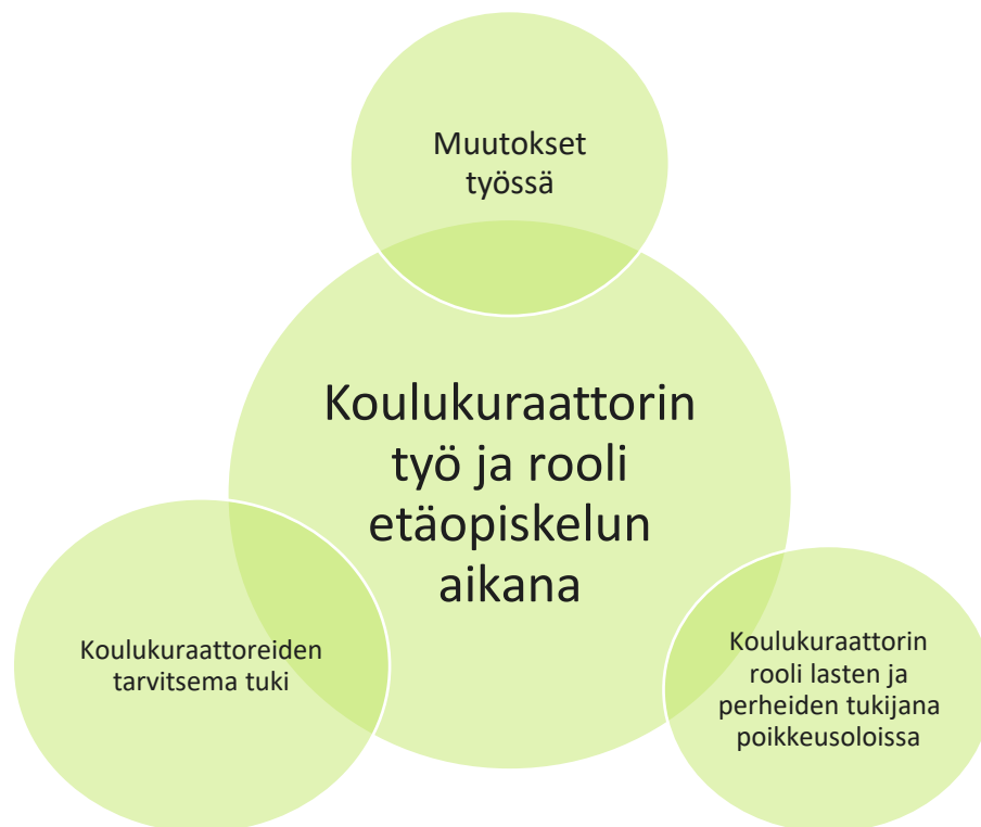
Kuvio 7. Koulukuraattorin työ ja rooli etäopiskelun aikana

Muutokset työssä. Ennen poikkeusaikaa etäpalavereita oli harvoin, mutta etäopiskeluun siirryttäessä myös palaverit siirtyivät verkkoalustoille. Lisäksi oppilaiden tapaamisia alettiin hoitaa etäyhteyden välityksellä, mikäli oppilas ei halunnut tulla lähitapaamiseen. Etäpalaverit ovat jääneet käytänteeksi, vaikka rajoituksia on höllennetty. Lähes kaikki haastateltavat