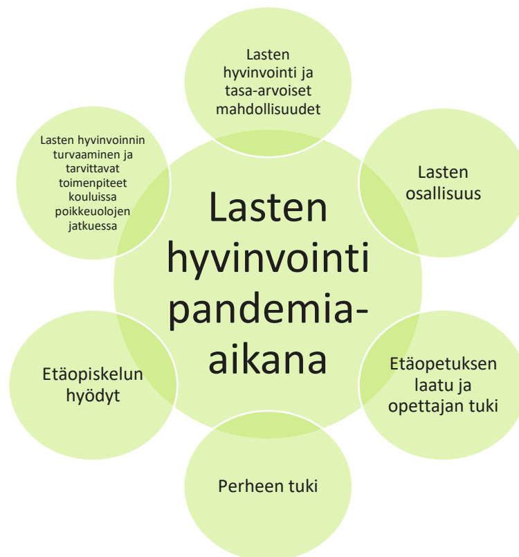
Kuvio 4. Lasten hyvinvointi pandemia-aikana

Lasten hyvinvointi ja tasa-arvoiset mahdollisuudet. Kaikki haastateltavat sanoivat etäopiskelun vaikuttavan merkittävästi lasten tasa-arvoisiin mahdollisuuksiin. Tämän nähtiin johtuvan hyvin pitkälti siitä, että perheiden tilanteet vaihtelevat ja lapset ovat jo lähtökohtaisesti hyvin eriarvoisessa asemassa toisiinsa nähden. Perheillä on erilaiset mahdollisuudet seurata ja tukea lapsen koulunkäyntiä. Perheen taloudellinen tilanne voi vaikuttaa siihen, miten hyvin lapsilla on käytettävissä opiskeluun tarvittavat välineet. Lisäksi monissa perheissä on huolenpitoon ja kasvatukseen liittyviä haasteita sekä mielenterveys- ja päihdeongelmia, joiden haitat korostuvat poikkeusaikana ja etäopiskelun aikaan entisestään. Osa haastateltavista arveli, että koronatilanne tulee vaikuttamaan ja näkymään lasten ja perheiden tilanteissa vielä pitkään.