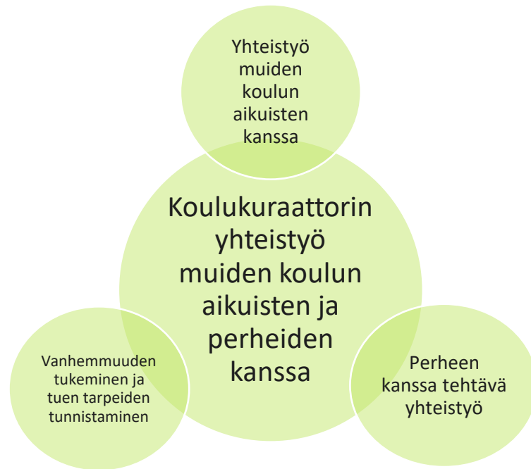
Kuvio 5. Koulukuraattorin yhteistyö muiden koulun aikuisten ja perheiden kanssa

Yhteistyö muiden koulun aikuisten kanssa. Etäopetus muutti myös koulukuraattorin ja muiden koulun ammattilaisten välistä yhteistyötä. Jokainen haastateltava koki isoimpana muutoksena sen, että tapaamiset ja palaverit järjestettiin pääosin etäyhteyksin. Tässä haastateltavat näkivät niin hyvää kuin huonoakin. Lähes kaikki mainitsivat, että tapaamiset muuttuivat tiiviimmiksi ja tehokkaammiksi. Hyvänä asiana haastateltavat näkivät sen, että tapaamiset eivät ole paikkaan sidottuja eikä aikaa mene siirtymiin, ja näin ollen kalenterissa on aiempaa enemmän tilaa. Nopeita ja tehokkaita tapaamisia ei kuitenkaan pidetty pelkästään hyvänä asiana, koska tapaamisiin tuli myös kiireen makua, ja tärkeitä asioita ei välttämättä käyty enää kunnolla läpi.