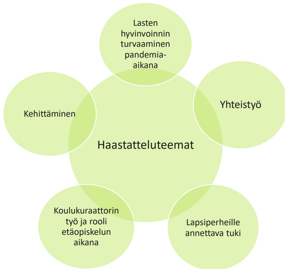
Kuvio 1. Haastatteluteemat

Lähetimme haastattelurungon jokaiselle haastateltavalle etukäteen nähtäväksi tarkoituksenamme helpottaa haastatteluun valmistautumista. Olimme laatineet teemat ja kysymykset niin, että ne antaisivat mahdollisimman laajoja vastauksia ja vastaisivat tutkimuskysymyksiimme. Koronatilanteen vuoksi haastattelut toteutettiin Teamsin välityksellä ja jokaiseen haastatteluun varattiin tunti aikaa.