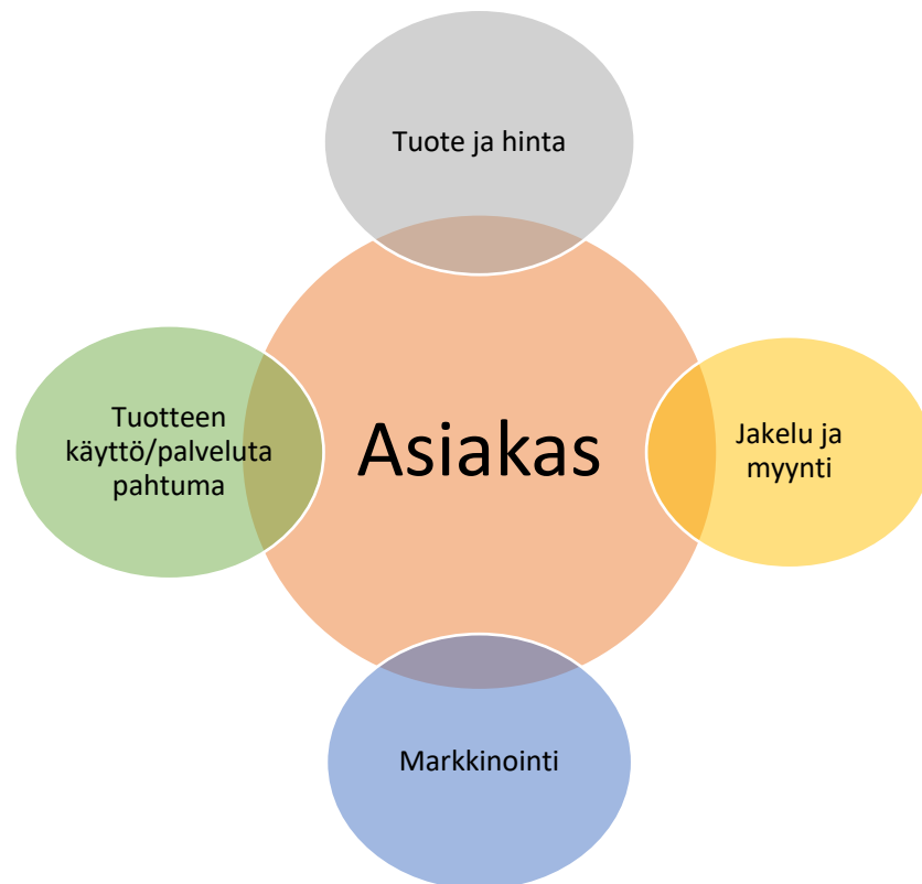
Kuvio 2: Matkailun kokonaisvaltainen tuotteistaminen (Kortesluoma 2015).

Tuotteistaminen on siis toimenpide, jonka avulla liikeideasta saadaan markkinoitava sekä hyvä myytävä matkailupalvelu. Palvelu on tuotteistettu hyvin, kun sillä on selkeä kohderyhmä sekä markkinat, kun se on monistettavissa ja kun se menee kaupaksi sekä tuottaa voittoa palvelun tarjoajalle. (Tonder 2013, 15.) Tuotteistamisen avulla voidaan kehittää uusia palveluidetoita toistettaviksi palvelukonsepteiksi ja lisätä jo olemassa olevien palvelujen tuotantoa ja kehittää niiden laatua (Jaakkola, Orava & Varjonen 2009, 5).