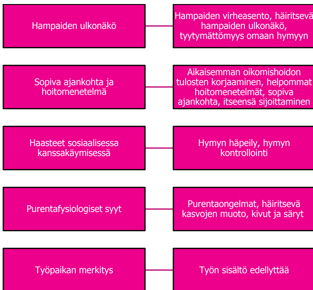
KUVA 1. Esteettiseen hammashoittoon hakeutumisen syyt

Esteettiseen hammashoittoon hakeutumisen syiksi muodostuivat hampaiden ulkonäkö, sopiva ajankohta ja hoitomenetelmä, haasteet sosiaalisessa kanssakäymisessä, purentafysiologiset syyt ja työpaikan merkitys. Kuvassa 1 yläluokat ja niiden alaluokat.