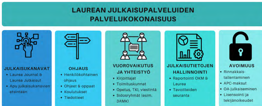
Kuvio 2. Julkaisupalveluiden palvelukokonaisuus (Montonen 2021).

Laurean julkaisupalveluissa tehdään yhteistyötä julkaisemisen kulttuurin tukemiseksi ja tehtyjen julkaisujen jakamiseksi. Toiminnan kulmakivet ovat Laurean julkaisukanavat sekä avoimen julkaisemisen edistäminen. Näistä ensimmäinen mahdollistaa ammatillista asiantuntijajulkaisemista tarjoamalla käsikirjoituksille alustan ja jälkimmäinen puolestaan on julkaisujen helpon jakamisen edellytys. Tämän lisäksi julkaisupalvelut järjestää julkaisemisen koulutuksia, neuvoo ja ohjaa sekä rakentaa julkaisemiseen kannustavaa kulttuuria Laureassa. Kuviossa 2 on avattu julkaisupalveluiden palvelukokonaisuus.