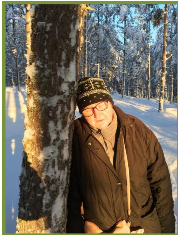
Kuva 2. Luonnossa elpyminen.

Luonnossa oleilu vaikuttaa positiivisesti psyykkiseen vointiin. Luonnossa mieliala kohe- nee ja positiiviset tunteet lisääntyvät. Luonnossa on mahdollisuus rauhoittua ja rentou- tua. Myönteisten psyykkisten vaikutusten saamista luonnossa kutsutaan elpymiseksi. (Arvonen 2014, 17-19.)