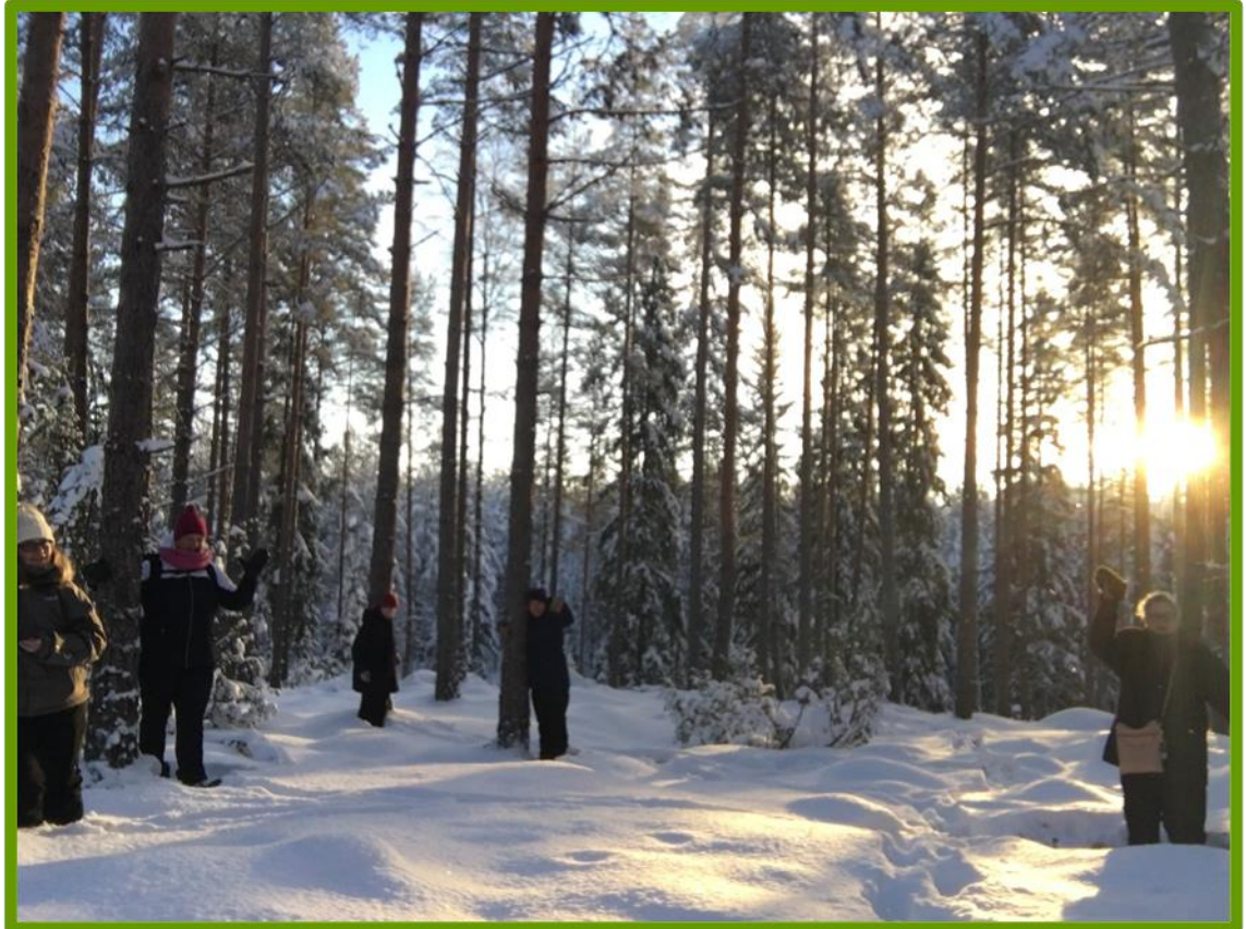
Kuva 8. Hangessa kävely saattaa olla haastavaa.

Havaintojen mukaan hangessa kävely saattoi olla joillekin haastavaa, varsinkin epätaisessa metsämaastossa. Tämä kannattaa ottaa huomioon retkiä suunniteltaessa ja retkelle osallistujia mietittäessä.