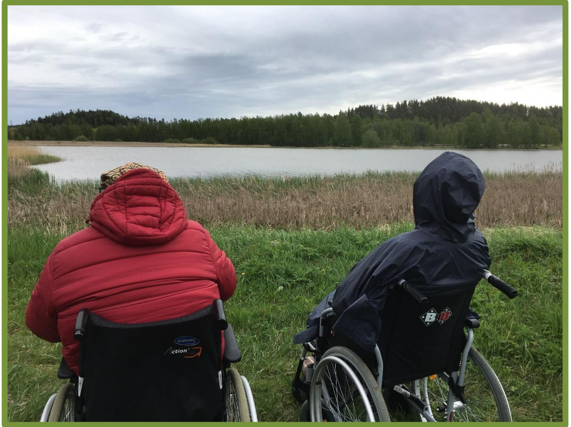
Kuva 1. Metsämieli -retki esteettömällä luontopolulla.