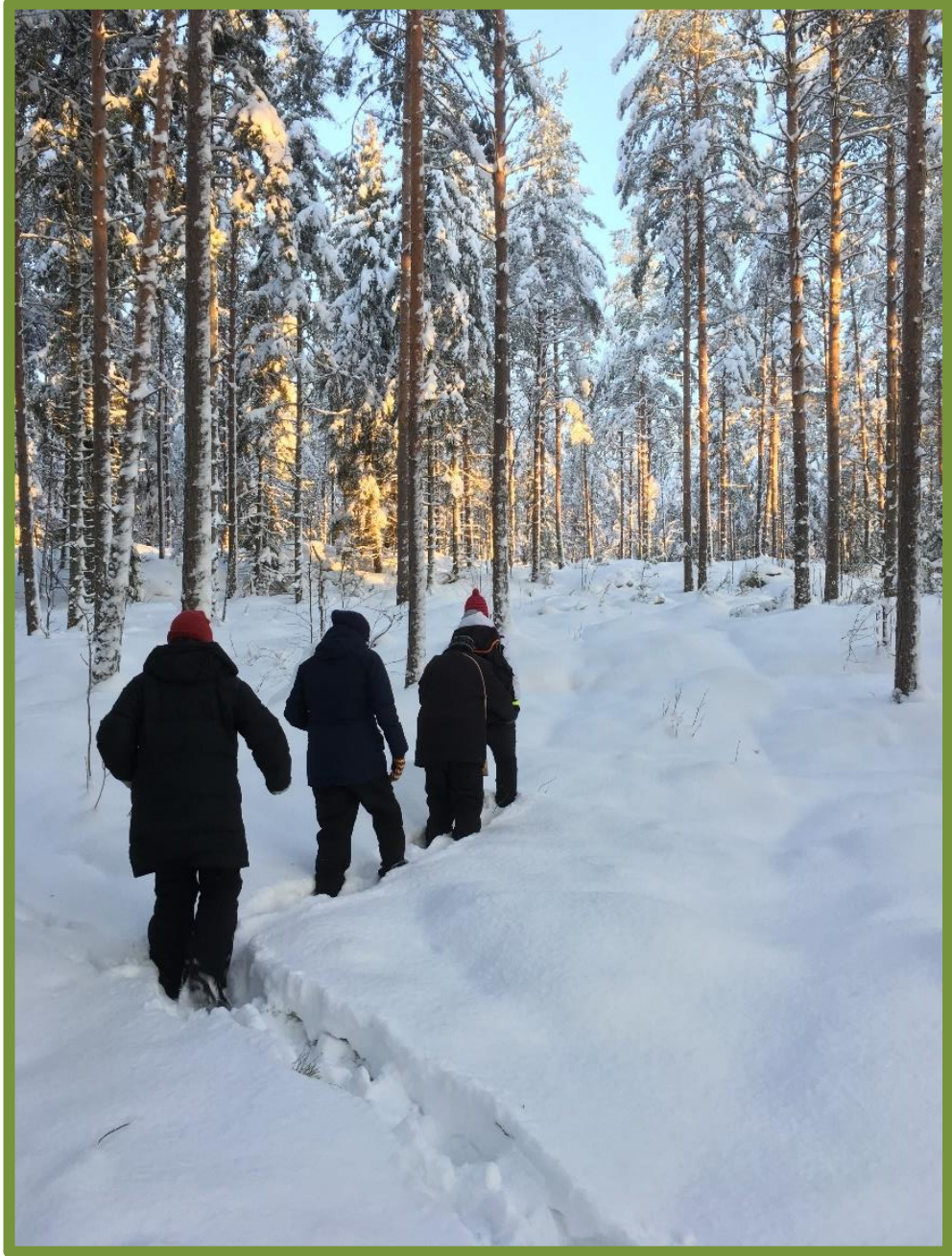
Kuva 4. Lumisessa metsässä kävely harjoittaa tasapainoa.

Asiakkaan osallisuutta tukee myös valinnanvapaus siinä, haluaako hän nauttia luontoympäristöstä yksin, tai haluaako hän ennemmin tehdä asioita ja oleilla yhdessä muiden kanssa (Kahilaniemi & Löf 2020, 9).