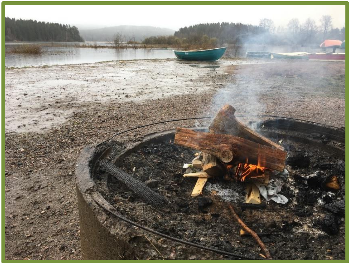
Kuva 11. Sateen ropinaa ja savun hajua Vanjärven lintutornin laavulla.

Parhaimmat muistot liittyivät kaikki tavallaan aisteihin ja hyviä muistoja mainittiinkin paljon: sateen ropina, tuulen humina puiden latvoissa, tulen räiskyntä nuotiossa, nuotiotulen tuijottelu, savun tuoksu, eläinten jäljet lumessa, lumiset puut, pehmeä ja kylmä lumi, lumen sulaminen kädessä ja nuotion päällä olevassa piipussa, luupilla tutkiminen, lintujen viserrys, kostean metsän tuoksu ja eväiden syönti. Muistoissa mainittiin useamman kerran myös puuhun nojaaminen tai puun halaaminen.