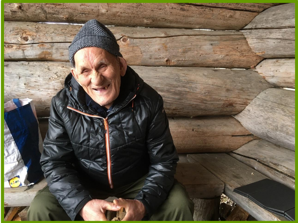
Kuva 6. Asiakkaiden ilmeitä havainnoitiin.

Retkien aikana ohjaajat vetivät ennalta sovitut harjoitteet vuorotellen. Ohjaajat havainnoivat koko ajan, mitkä harjoitteet tuntuivat asiakkaille mielekkäiltä ja millaiset ohjeet tuntuivat toimivan. Retkien aikana kävi selväksi, millaiset harjoitteet asiakkaat kokivat mielekkäiksi ja helposti ymmärrettäviksi.