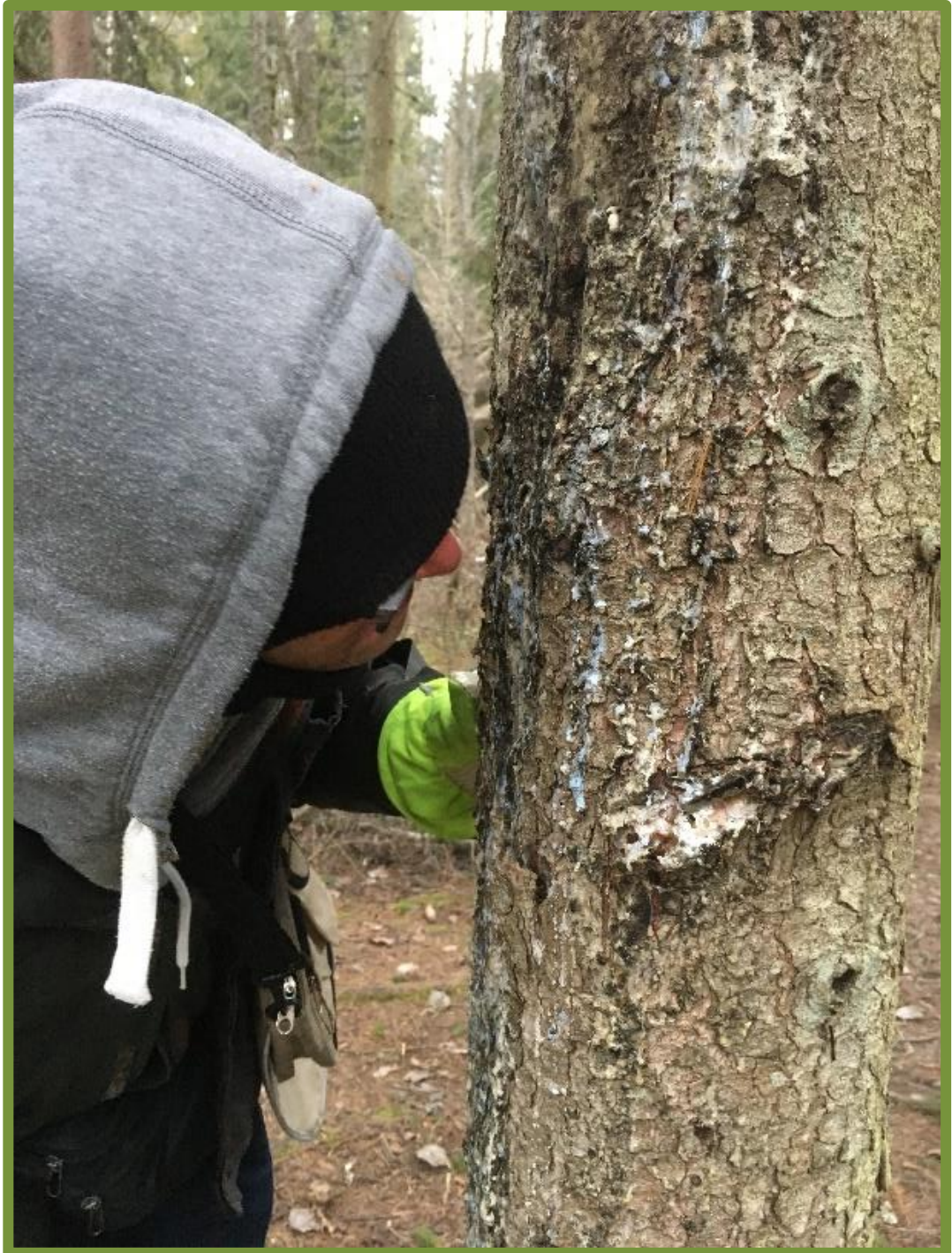
Kuva 3. Asiakas ja pihkan tuoksu.

Luonnossa on mahdollisuus erilaisiin toiminnallisiin hetkiin, joihin asiakas voi osallistua omien halujensa ja kykyjensä mukaan. Luonnossa on mahdollista ihan vain oleskella tai sitten saada fyysistä rasitusta ja harjoitusta mm. tasapainon kehittämiseen. Luontoympäristö tarjoaa mahdollisuuden liikuntaan, ulkoiluun, tekemiseen ja luovuuteen. (Kahilaniemi & Löf 2020, 9.)