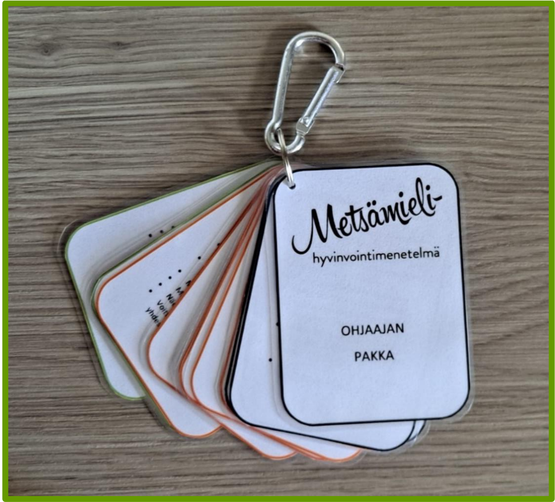
Kuva 12. Ohjaajan pakka.