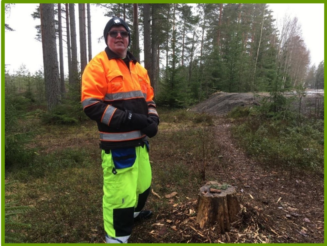
Kuva 9. Hyvien asioiden kekoa rakentamassa.

Hyvien asioiden keko oli havaintojen mukaan mielekäs harjoite, johon selvästi osallistujat panostivat. Oli hienoa huomata, miten he pysähtyivät miettimään ja sanoittamaan ääneen, mitä hyviä asioita he löysivät joko elämästään tai kyseisestä retkipäivästä. Hyvien asioiden ääneen sanominen toisille näytti voimaannuttavan osallistujia, sillä toisten hyvien asioiden kuuleminen antoi positiivista virtaa koko ryhmään.