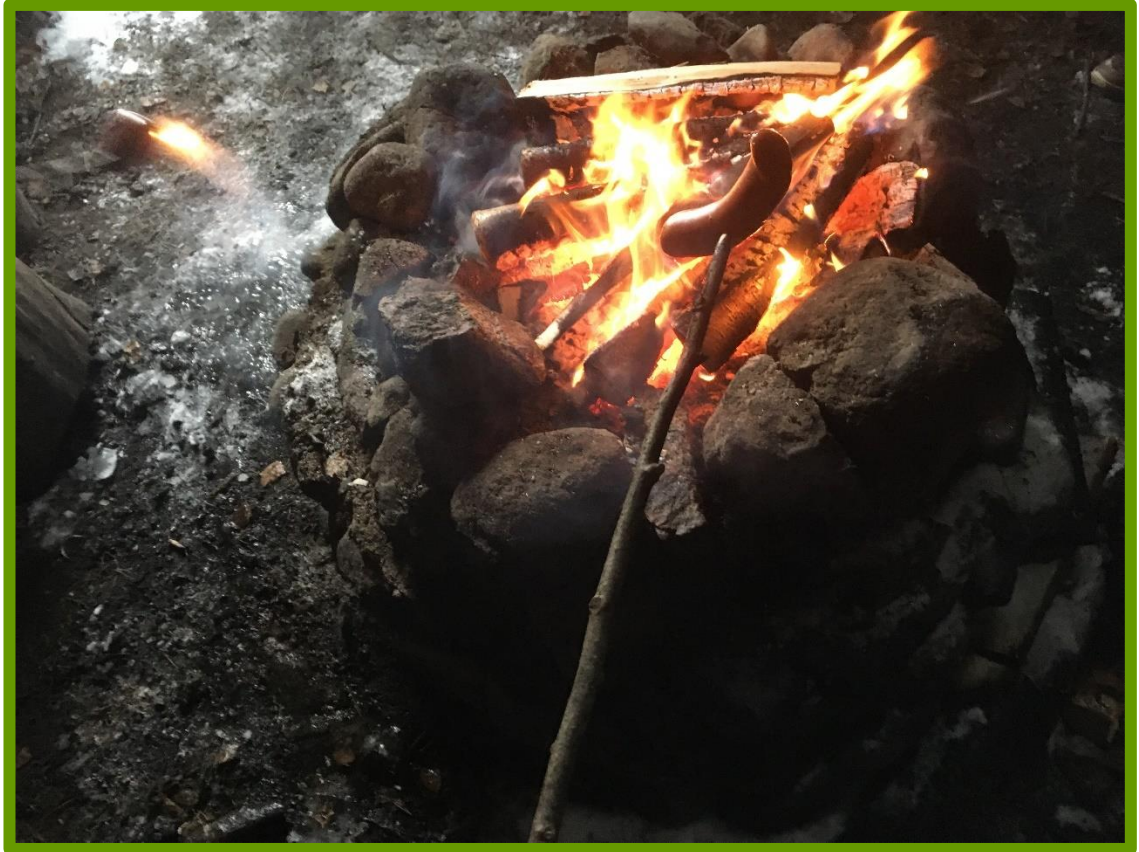
Kuva 10. Makkaran grillaus makkarakepillä oli joillekin uusi kokemus.