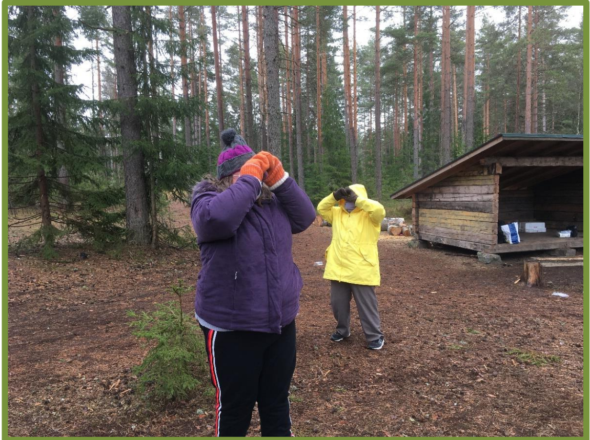
Kuva 5. Kiikarointi -harjoite Sammatin laavulla.