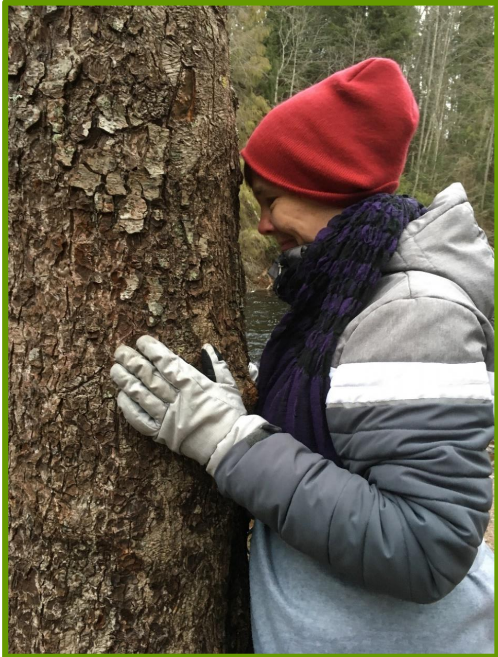
Kuva 7. Puiden halaaminen osoittautui tutkittaville mieluisaksi.