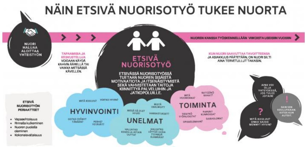
Kuva 1. Kaavio siitä, miten etsivä nuorisotyö tukee nuorta. (Hyria Säätö).

Vuonna 2018 etsivässä nuorisotyössä työskenteli 660 henkilöä. Etsiville tuli yhteensä 27466 yhteydenottoa, joista he tavoittivat 19 762 nuorta. Miehiä näistä oli 57 % ja naisia 43 %. Suurin osa nuorista tuli etsivän nuorisotyön pariin ohjaavien tahojen kautta. 29 % tuli oppilaitosten kautta, 14,1 % sosiaali- ja terveystoimesta, 9,6 % nuorisotyön kautta, 12,2 % muiden viranomaisten kautta ja 26,1 % nuoren oman yhteydenoton kautta. (Bamming, R. & Walldén, J. 2018, 10, 13–14.)