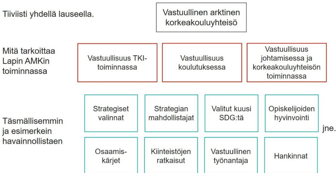
Kuva 7. Lapin AMKin vastuullisuusviestintäkonseptin viestihierarkia

Kestävyys ja vastuullisuus huomioidaan kaikessa Lapin AMKin hanketoiminnassa. Lapin ammattikorkeakoulussa on käynnissä tällä hetkellä noin 170 kehittämishanketta. Jokaiselle TKI-hankkeelle määritellään ja kirjataan Repotronic-hankehallintajärjestelmässä vähintään yksi SDG-tavoite, joita se toteuttaa. Hankehallintajärjestelmä mahdollistaa myös hankkeiden lajittelun