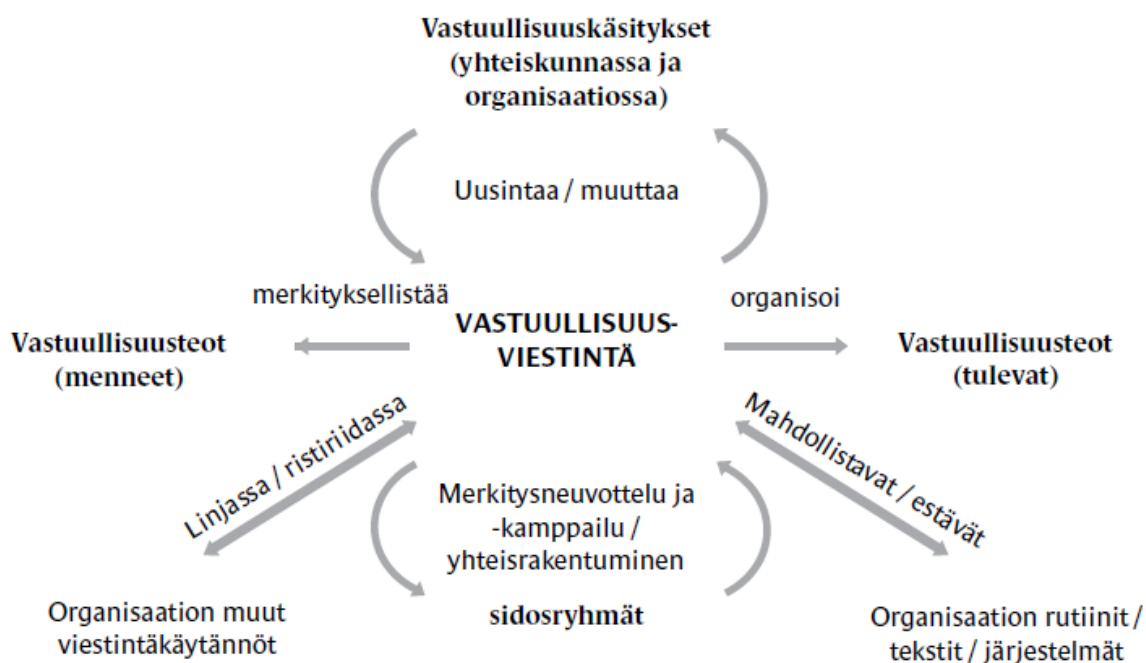
Kuva 4: Vastuullisuusviestinnän keskeiset ulottuvuudet (Penttilä & Eräranta, 2021, s. 24)

Vastuullisuusviestintä ei voi olla vain lupauksia ja suunnitelmia. Organisaation vastuullisten tekojen täytyy todentaa ja tukea viestintää (Frig & Uusitalo, 2021, s. 36). Vastuullisuusviestintä on siis organisaation vastuullisesta toiminnasta viestimistä, sen ymmärrettäväksi tekemistä sekä merkityksellisyyden ja mielikuvien luomista.