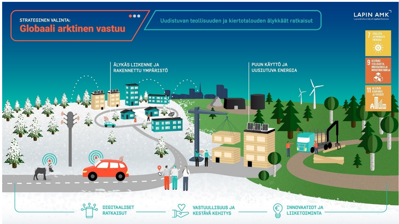
Kuva 6: Strateginen valinta Globaali arktinen vastuu (Lapin AMK, n.d.)

Kaikkien kolmen strategisen valinnan yhtenä peruskivenä on vastuullisuus ja kestävä kehitys. Kuvassa 6 nämä on esitetty infograafin muodossa, esimerkkinä Globaali arktinen vastuu.