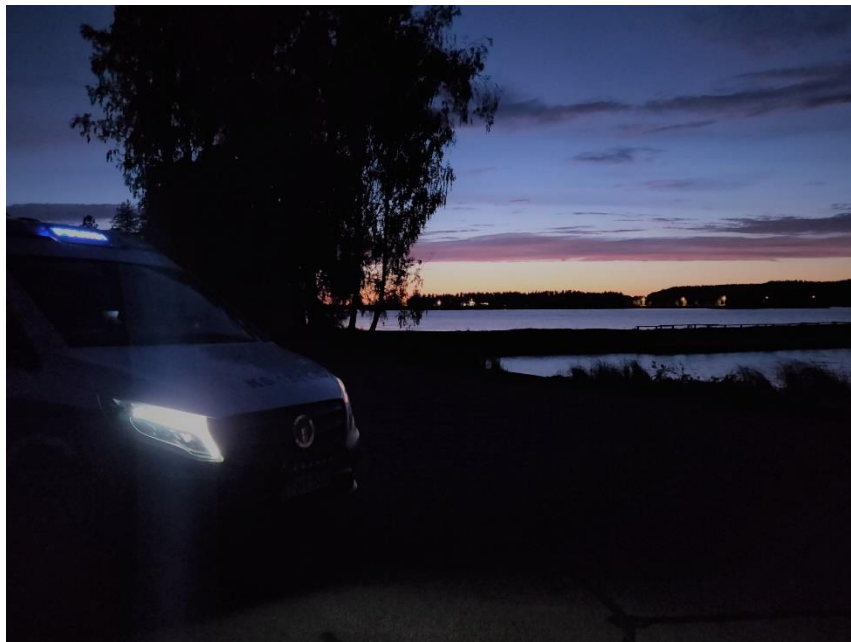
Kuva 1. Harvaturva -projektiin liittyvää valvontaa Keiteleellä.

Poliisilaitokset tekevät harvaturvakuntien osalta vuotuisen valvontasuunnitelman, määrittelevät vastuuvuorilleen valvontakohteet ja poliisitoiminnalliset valvonnan painopisteet. Vapaaksi jäävä työaika käytetään harvakuntien alueella aktiiviseen valvontaan ja läsnäoloon, tavoitteena on poliisin näkyvyyden ja turvallisuuden lisääminen alueilla, missä poliisia on aiemmin totuttu harvoin näkemään. Hälytystehtävän hoitamisen jälkeen alueella suoritetaan muun muassa liikenteenvalvontaa mahdollisuuksien mukaan. HARVATURVA-toiminnan myötä liikennevalvonnan suunnitelmallisuus ja poliisilaitosrajat ylittävä yhteistyö lisääntyy ja liikenneturvallisuustyön alueellinen tasapuolisuus lisääntyy. ( https://poliisi.fi/-/poliisi-tehostaa-valvonta-ja-halytystoimintaa-harvaan-asutuilla-alueilla )