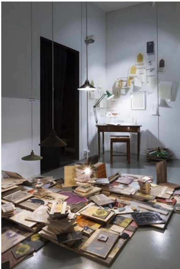
Kuva 8. Jussi Juurinen, Kaivertamisen himo, 2012. (Kuvataiteilijamatrikkeli).

muistiin ja henkilökohtaisiin muistoihin liittyvät aiheet resonoivat minussa. Juurisen tapa rakentaa teoksensa tilaan tuntuu kiinnostavalta.