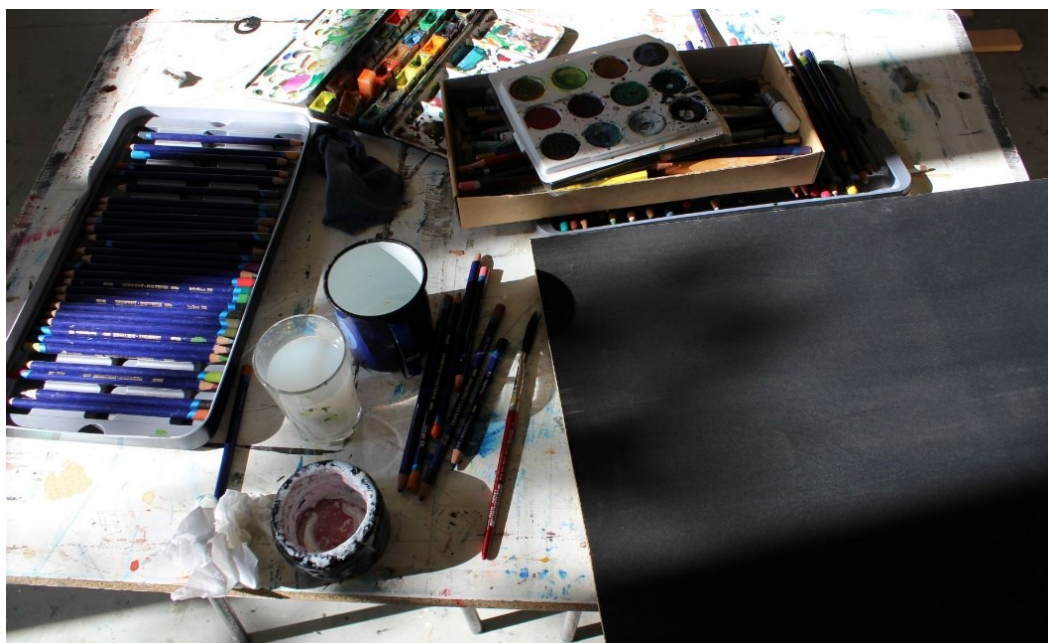
Kuva 7. Työpöytä 1.9.2021.

Päinvastoin kuin kuvitelmat luovuudesta, inspiraatiosta, intuitiosta, alitajunnasta ja sattumasta kokonaisuus, taiteellinen toiminta, kertoo ulkopuoliselle taidosta, kyvystä pakottaa ja sopeutua, materiaalinhallinnasta ja näkemyksestä. Näiden vuoksi eteneminen on reflektoivaa, oppivaa ja arvioivaa aina niin pitkälle, että taiteilija näkee kokonaisuuden silloinkin, kun väittää, että kaikki on aivan sumussa. (Varto 2017, 46–47.) Tiedän, vaikka en tiedä ja vaikka eksyn ja hapuilen.