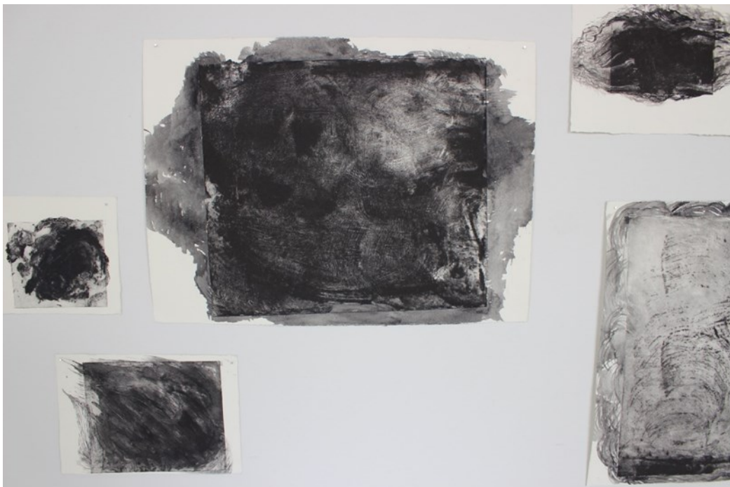
Kuva 3. yksityiskohta Surut ja murheet, carborundum, peiteväri paperille, 2021.