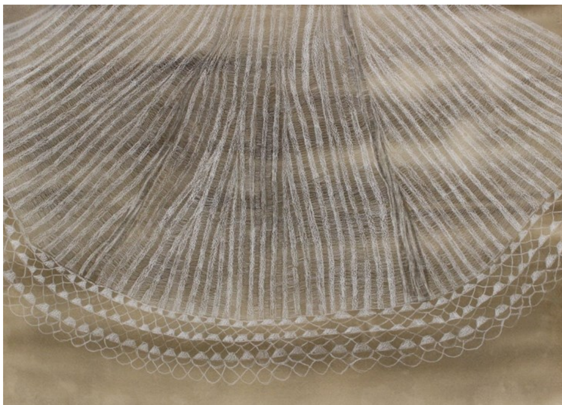
Kuva 5. Huivi (2021), 57 x 77 cm, sekatekniikka paperille.

Ajattelen, että sekä teokseni että niiden tekeminen ovat minulle muistipaikkoja, muistin tekoja. Uskon, että teokseni ja taideteokset yleensäkin voivat olla muistipaikka paitsi tekijälleen myös katsojalleen. Taideteokset voivat palauttaa katsojan oman historian eläväksi kokemukseksi. Taiteen kautta yksityisestä kokemuksesta voi tulla yhteistä.