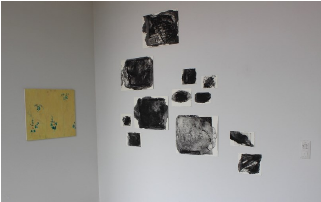
Kuva 2. vasemmalla Tapetti, 2021 ja Surut ja murheet, 2021.

menetys, josta ei puhuta koskaan. Tuon kaihon ja kipeyden, elämän melankolisen pohjavireen, tunnistan omasta historiastani.