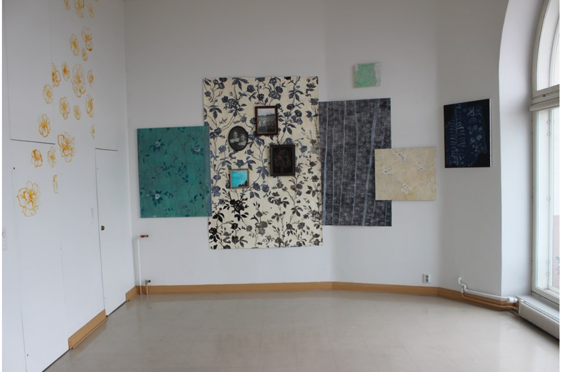
Kuva 4. Ripustuskuva Galleria Uusikuva vasemmalta Hamekangas, 2021 ja Seinät, 2020–2021.