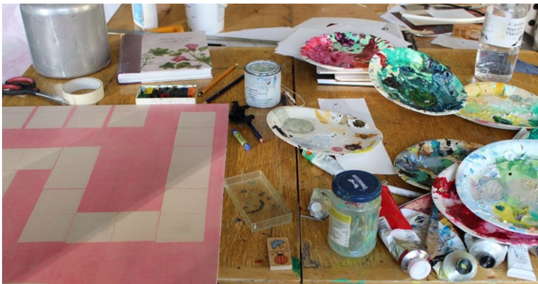
Kuva 6. Työpöytä 1.9.2021.

rakennettuja kokonaisuuksia näistä. Tekijänä rönstyilen, raappaan ja hapuilen.