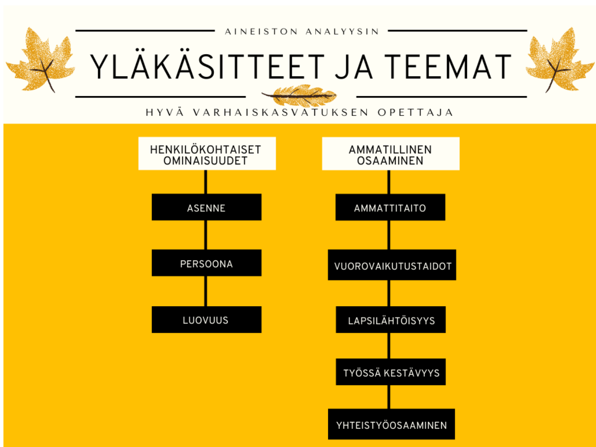
Kuva 2. Aineiston analyysin yläkäsitteet ja teemat.

Tämän jälkeen tarkasteltiin kyselyn kaikkien neljän kysymyksen vastauksia, jotka yhdistettiin samojen aiemmin määriteltyjen kahdeksan teeman alle. Tässä vaiheessa teemojen nimet vielä tarkentuivat. Vastaukset muutettiin helpommin luettavaan muotoon, esimerkiksi vastaus ”iloisuutta” muutettiin muotoon iloisuus. Saman asiasisällön alle sopivat vastaukset yhdistettiin yhdeksi käsitteeksi. Esimerkiksi vastaukset ”pitkäjänteisyys”, ”pitkämielisyys” ja ”pitkä pinna” yhdistettiin käsitteeksi kärsivällisyys. Myös asiasisältöjä tiivistettiin tarvittaessa käsitteiksi. Esimerkiksi kyselyvastaus ”Ei kannata työssä heti luovuttaa ja vaihtaa alaa, jos juuri nyt tuntuu vaikealta” tiivistettiin tuloksissa käsitteeksi sitoutuminen. Jos sama asia mainittiin vastauksissa useamman kerran, niin se merkittiin analyysissä vain kerran. Lopuksi tarkasteltiin kaikkia kahdeksaa teemaa ja ne luokiteltiin kahden yläkäsitteen alle (Kuva 2).