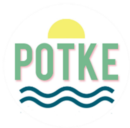
KUVA 1. Hankkeen someviestinnässä käytetty logo suunniteltiin opinnäytetyönä tehdyssä markkinointisuunnitelmassa

Hankkeen alkumetreillä vuonna 2020 tarjosimme opinnäytetyöaiheen hankkeen markkinointiin liittyen. Opinnäytetyössä [1] hankkeelle luotiin markkinointisuunnitelma, joka tuki hankkeen tavoitteita. Työssä luotu digitaalinen brändi ja markkinointimateriaali sopivat hankkeen kohderyhmälle, joita ovat nuoret peruskouluikäiset. Opinnäytetyön osana aloitettiin Instagram-tilin käyttö eli luotiin tili, logo (kuva 1), visuaaliset materiaalit ja aloitettiin julkaisut. Lisäksi opinnäytetyöntekijä hankki seuraajia profiilille.