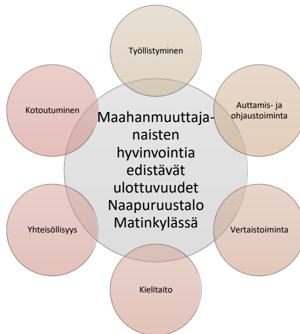
Kuvio 2: Tuloksista nousseet maahanmuuttajanaisten hyvinvointia edistävät ulottuvuudet Naapuruustalo Matinkylässä

Hyvinvointia edistivät Naapuruustalo Matinkylän toiminnan monet eri ulottuvuudet, jotka tiivistyivät analyysin tuloksena kuuteen eri pääluokkaan. Näitä ovat työllistyminen, auttamis- ja ohjaustoiminta, vertaistoiminta, kielitaito, yhteisöllisyys, ja kotoutuminen. Lisäksi käsittelen omassa alaluvussa haastatteluissa esiin nousseita kehittämisen kohteita. Alla olevassa kuviossa yhteenvedona Naapuruustalon maahan muuttaneiden naisten hyvinvointia edistävän toiminnan eri muodot.