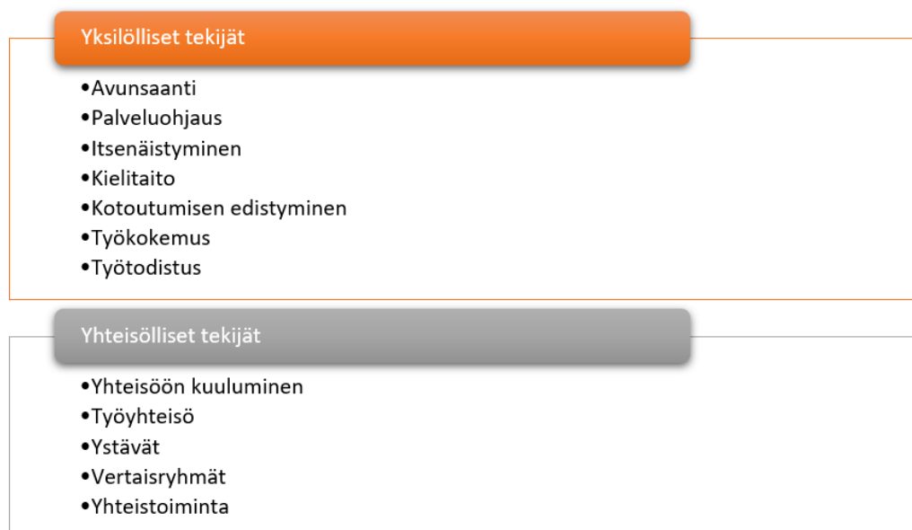
Kuvio 3: Tuloksista nousseet maahanmuuttajanaisten hyvinvointiin liittyvät yksilölliset ja yhteisölliset tekijät

Tutkimuskysymyksen avulla pyrin selvittämään, kuinka matalan kynnyksen palvelut edistävät maahanmuuttajanaisten hyvinvointia. Saatujen tulosten perusteella voidaan todeta, että kaikki tässä opinnäytetyössä käsittelyssä olleet Naapuruustalo Matinkylän matalan kynnyksen toiminnan muodot olivat edistäneet maahan muuttaneiden naisten hyvinvointia monipuolisesti sitä lisäten. Palveluilla voidaan nähdä olevan karkeasti jaoteltuna kahdenlaista merkitystä maahanmuuttajanaisten hyvinvoinnille; tutkimusaineistosta nousi esiin niin yhteisö- kuin yksilötasoisia hyvinvointiin vaikuttavia tekijöitä.