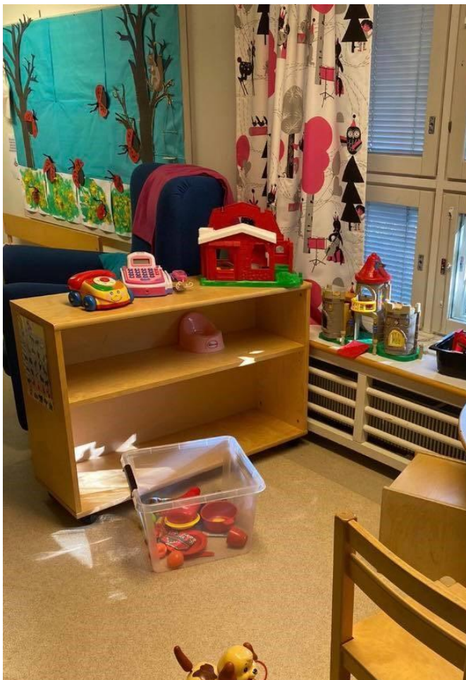
Kuva 6 Eläinleikin hylly ennen muutoksia.

Autoradan tavoitteena oli lisätä lasten pitkäkestoista leikkiä sekä saada leikkiin lisää vaihtelevuutta. Autoradalle valittiin muutamat autot, jotka voidaan kuljettaa leikin päätyttyä omaan parkkiruutuun, näin autoja ei aina tarvitse kerätä pois vaan leikkiä voi jatkaa aina omasta ruudusta. Autojen ollessa parkkiruudussa leikki on aina helppo aloittaa ja autorata on aina valmiina. Keskeisenä tavoitteena olikin lisätä leikin innostavuutta sen esillä olon avulla. Autorata tarrojen avulla lapset voivat helposti harjoitella myös leikin yhteydessä liikenne sääntöjä ja leikkiin saadaan vaihtelevuutta lisäämällä esimerkiksi jalankulkijoita tai eläimiä. Näin autorata leikkiin on helppo tuoda mukaan myös enemmän pedagogista näkökulmaa.