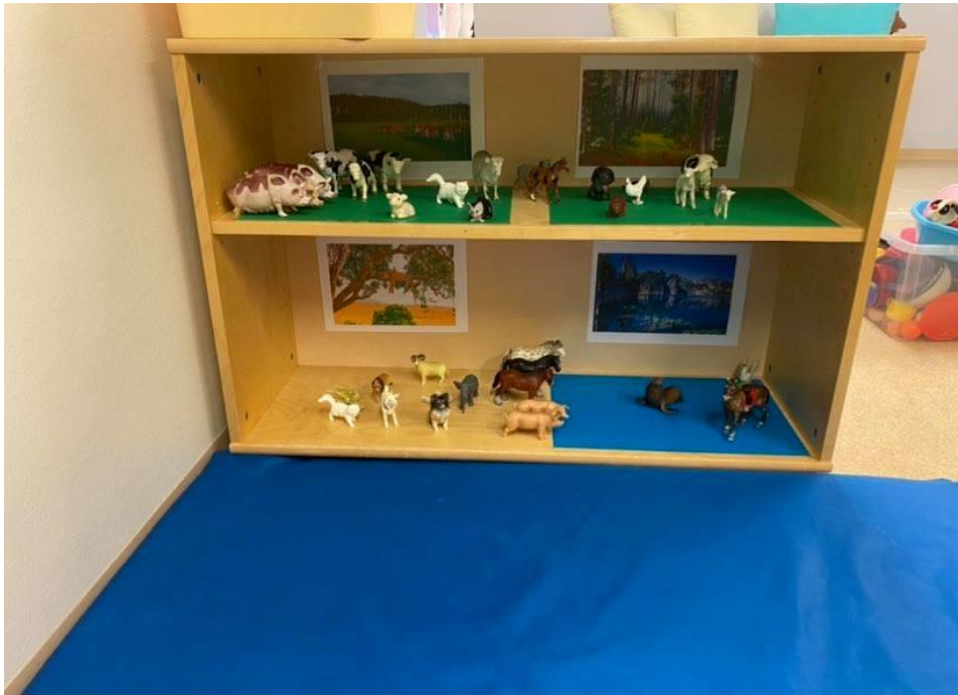
Kuva 7 Eläinleikki kehittämisen jälkeen.

Yksi suuri lasten mielenkiinnon kohde oli eläimet. Kasvattajan haastattelusta kävi ilmi, että lapset olivat tutkineet eläimiä kirjoista ja ryhmässä oli laatikossa eläinleluja, mutta niille ei ollut oikein paikkaa. Yhdellä kuvatulla videolla lapsi vei eläinleluja autoleikkiin, mutta kun niille ei ollut selkeästi omaa leikkipaikkaa ei niiden käyttö ollut pitkäkestoista.