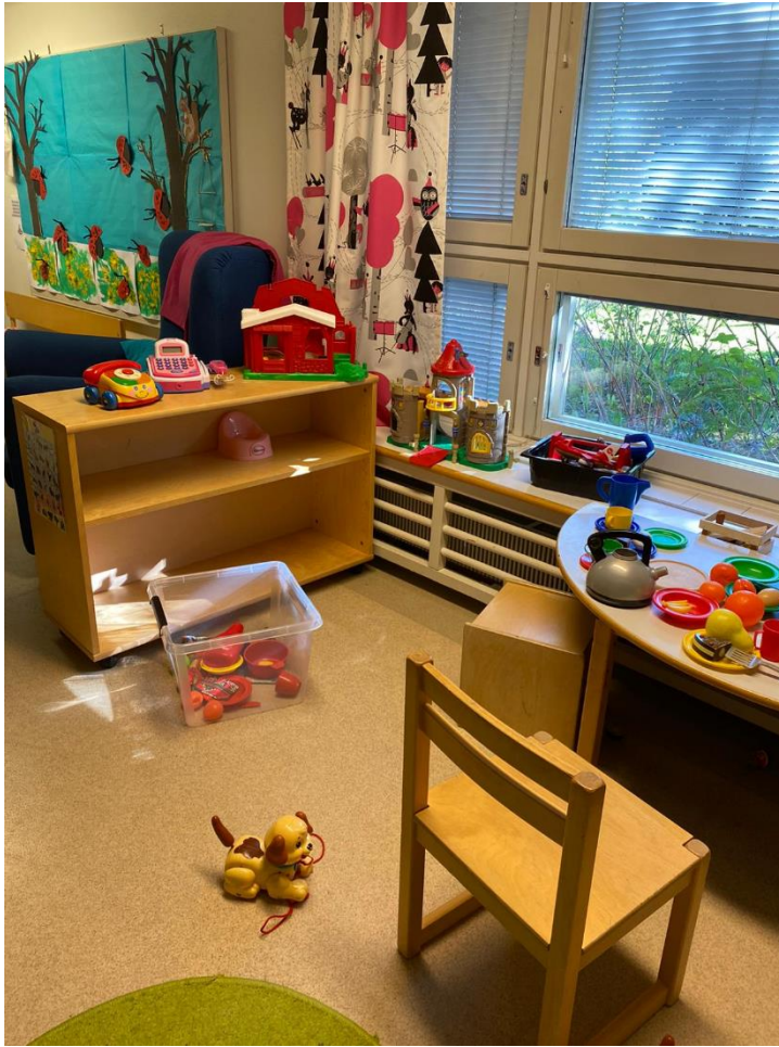
Kuva 8 Kotileikki ennen muutoksia.