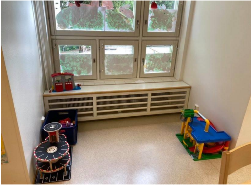
Kuva 3 Autoleikki ennen muutoksia.

lapsia lukemaan ja selailemaan kirjoja enemmän. Kirjat asetettiin nurkkaukseen helposti lasten saataville.