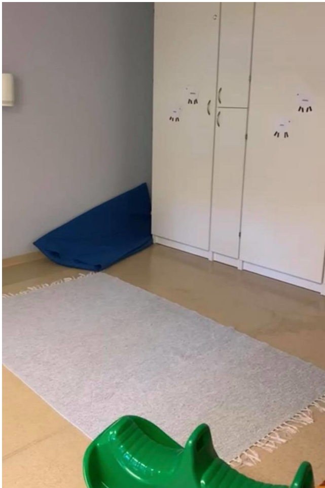
Kuva 12 Liikuntarata ennen muutoksia.

Kotileikkiä lähdettiin kehittämään kutsuvammaksi lapsille. Kotileikin tavoitteena oli innostaa lapsia leikkiin ja mahdollistaa heille pitkäkestoinen leikki ilman keskeytyksiä. Kotileikki nurkuksesta pyrimme tekemään mahdollisimman kodin tuntuisen. Kotileikkiä selkeytettiin vähentämällä tavaroiden määrää ja asettamalla lelut helposti lasten saataville. Kotileikkiin yhdistettiin astioita, ruokia, keittiö, sekä nukkeja, rattaita ja sänkyjä.