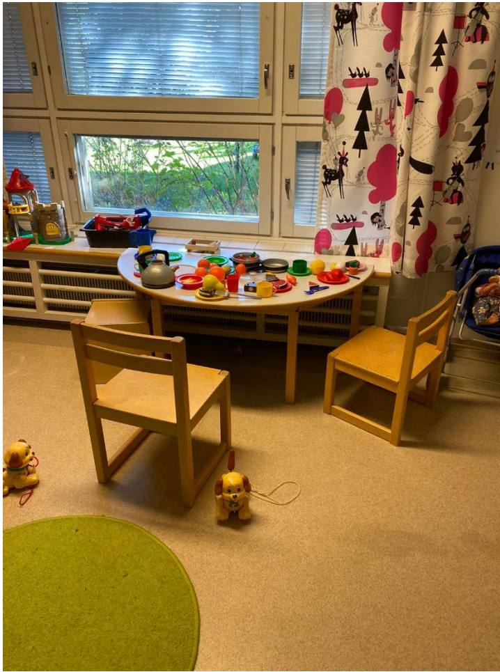
Kuva 9 Kotileikki ennen muutoksia.