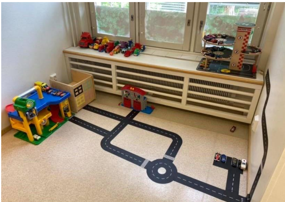
Kuva 5 Autoleikki kehittämisen jälkeen 2

Yksi lasten mielenkiinnon kohteista esiin noussut leikki oli autoleikki, joka oli ollut kasvattajien haastatteluiden perusteella jo pidempään ryhmän lasten suosioissa. Myös videoilta havaittiin usean lapsen kiinnostus autoleikkejä kohtaan. Yhdessä videossa lapsi toteaa toiselle 2 autoa kädessään "Tuun mun kaa leikkii" ja ojentaa toista autoaan. Tähän toinen lapsi nyökkää ja he