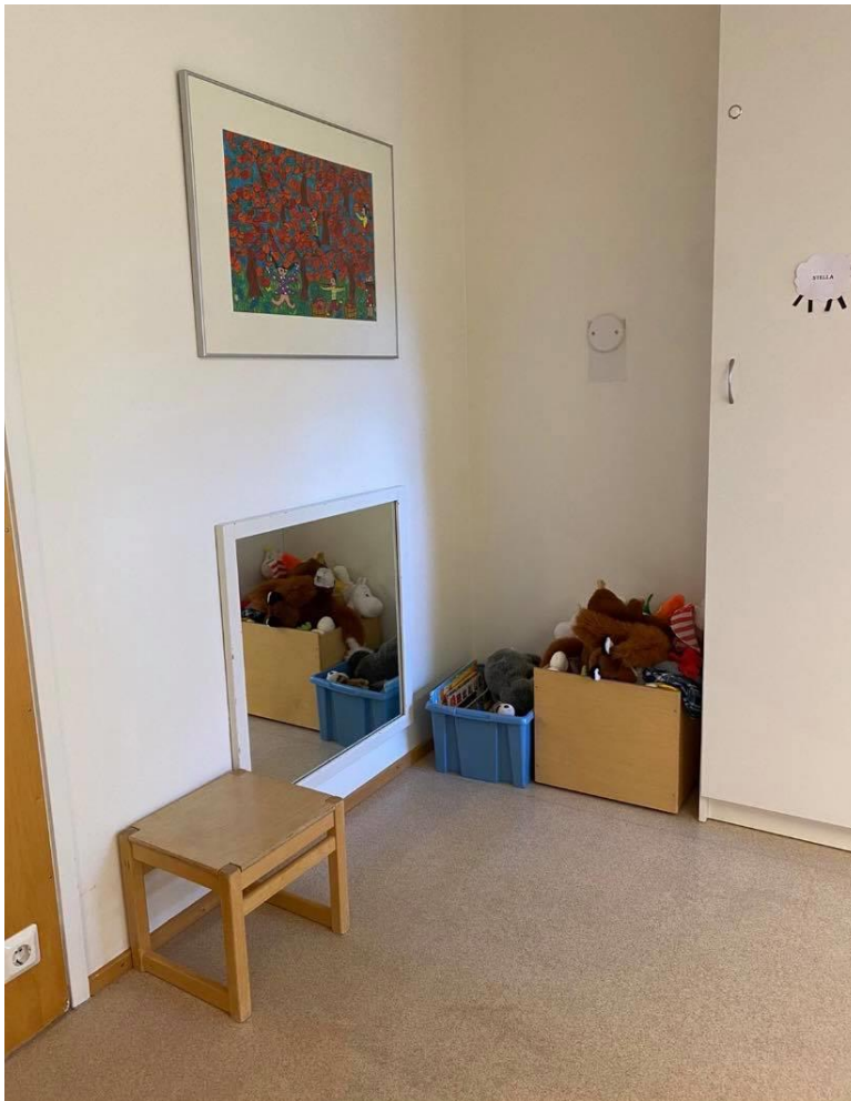
Kuva 1 Lukunurkkaus ennen muokkausta.