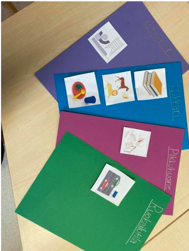
Kuva 14 Leikinvalintataulu

Ryhmässä tehdystä havainnoinnista kävi ilmi, että lasten leikit olivat usein hyvin lyhytkestoisia ja leikkien valitseminen oli lapsille haastavaa. Videoilta näkyy lasten jatkuva vaeltelu leikistä sekä huoneesta toiseen. Leikit jäivät aina melko lyhyiksi, poikkeuksena kotileikki, jossa lapset viihtyivät pitkiä aikoja.