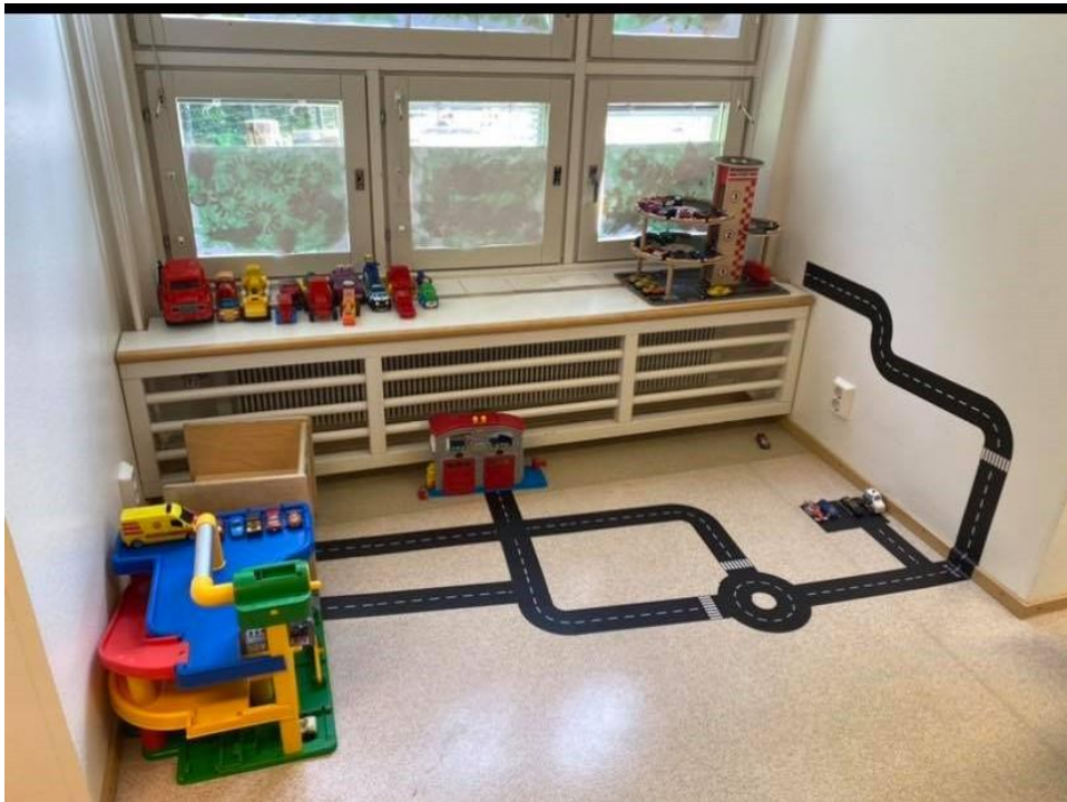
Kuva 4 Autoleikki kehittämisen jälkeen.