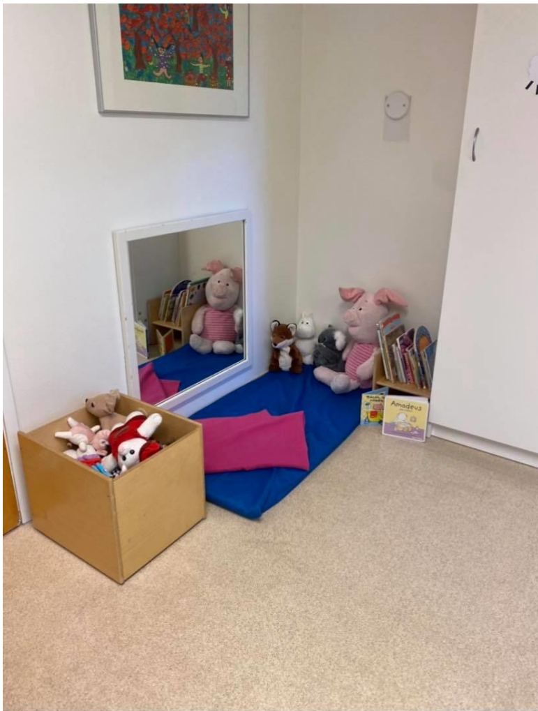
Kuva 2 Lukunurkkaus kehittämisen jälkeen.

Lukunurkkaus idea sai alkunsa, sillä lapset pitivät paljon kirjojen lukemisesta ja selaamisesta. Kasvattajan havainnoista kävi ilmi kirjojen suuri suosio ja ryhmään kaivattiin parempaa ratkaisua kirjojen esille panolle. Myös kuvatuista video materiaaleista kävi ilmi kirjojen suuri suosio. Lapset selailivat kirjoja kuitenkin pitkin ryhmätiloja ja selaushetket olivat hyvin lyhytkestoisia, kun selaaminen tapahtui keskellä muita leikkejä. Kirjojen lukemiselle toivottiinkin tämän vuoksi erillistä tilaa, jossa niiden tutkimiseen voitaisiin rauhoittua.