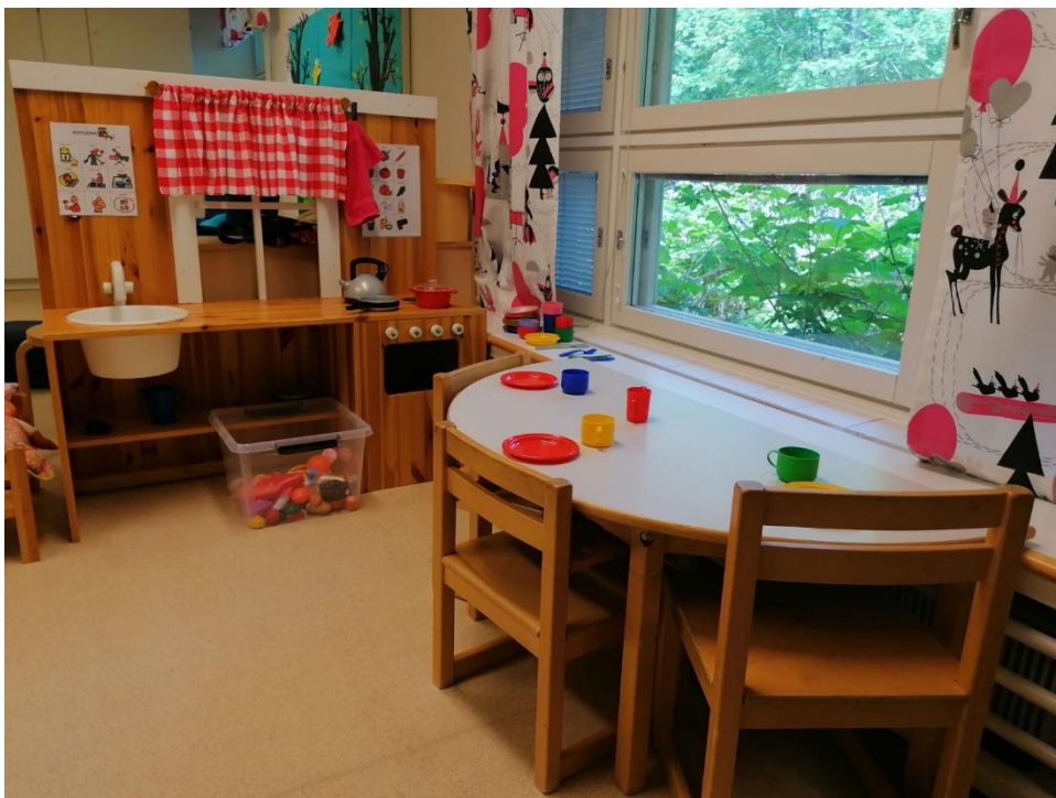
Kuva 11 Kotileikki kehittämisen jälkeen.

Kotileikeistä taltioitiin monta videota, joissa jokaisessa oli mukana 2-4 lasta kerrallaan. Nukkeja hoidettiin, nukutettiin ja työnnettiin rattaissa, ruokaa kokattiin ja pöytä katettiin. Lasten välillä oli vuorovaikutusta ja leikissä oli jopa selkeä juoni. Kotileikitavarat olivat eripuolilla