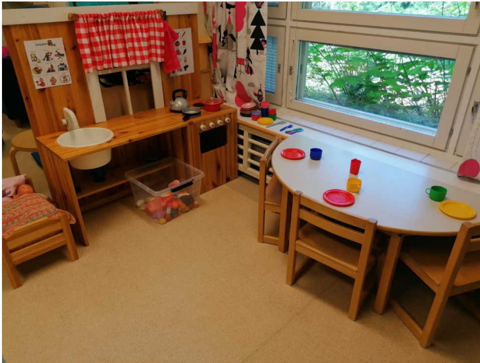
Kuva 10 Kotileikki kehittämisen jälkeen.