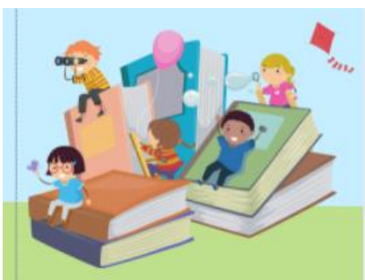
Kuva 1. Näin sitä opitaan -kuva (grafiikat: Canva 2021)

Esitteen toteutukseen käytimme Canva-sivustoa, josta löysimme kuvitukseltaan sopivan pohjan. Pohjan ulkonäköä aloimme muokkaamaan haastattelukysymysten pohjalta tulleiden vastausten perusteella. Esitteestä toivottiin visuaalista, lyhyttä ja ytimekästä. Tämän toiveen mukaan päädyimme tekemään Z-taitteisen lehtisen, jonka koko on noin A4. Esitteen sisältöön toivottiin lyhyitä ja helppolukuisia lauseita sekä kuvia. Esitteen kuvissa pyrimme ilmentämään esiopetuksen sisältöjä ja oppiskäsityksiä esitavoin, kuten tässä kuvassa (Kuva 1) ilmensimme oppimiskäsityksen mukaisia lapsille ominaisia tapoja oppia.