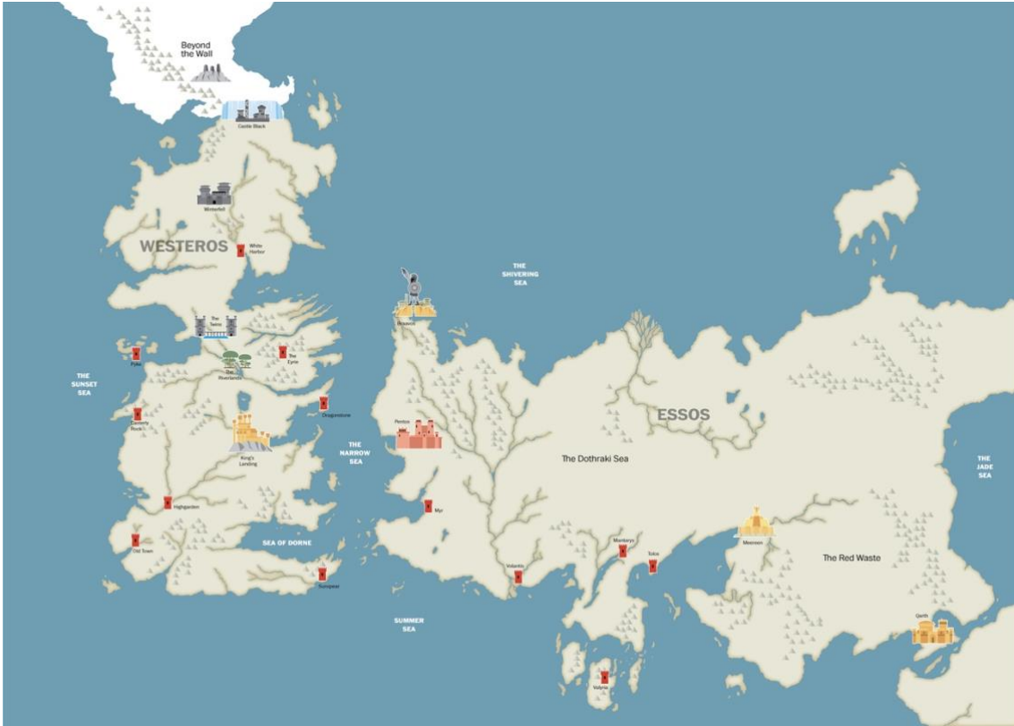
Figur 2 Världskarta över Westeros och Essos