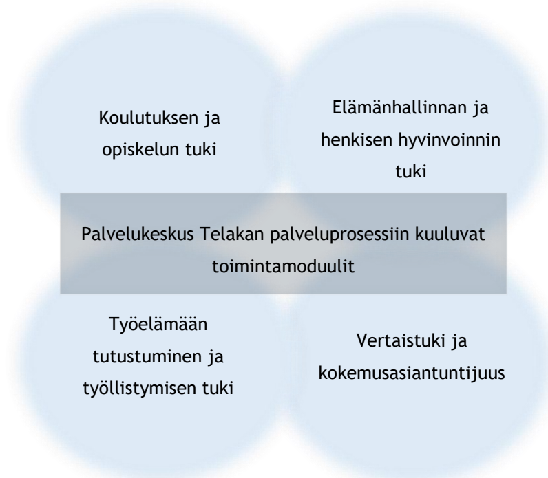
Kuvio 1: Palvelukeskus Telakan toimintamoduulit

Palvelukeskus Telakan toiminnan neljänteen moduuliin kuuluu vertaistuki ja kokemusasiantuntijuus. Vertaisryhmät ja kokemusasiantuntijat ovat tärkeässä roolissa kuntoutuksessa, sillä näin nuori saa itselleen selviytyjäyhteisön, johon kuuluu. Yhteisöllisyyden lisääntyessä myös osallisuus ja yhteiskuntaan vaikuttamisen tunne lisääntyvät, ja näin nuori pystyy vaikuttamaan esimerkiksi palveluiden kehittämiseen tuoden omaa ääntään kuuluviin. (Hankesuunnitelma 2020.)