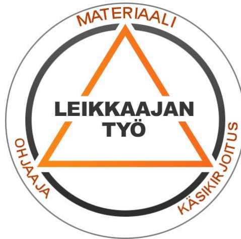
Kuvio 1. Leikkaajan työtä rajaavat materiaali, käsikirjoitus ja ohjaajan mielipiteet.