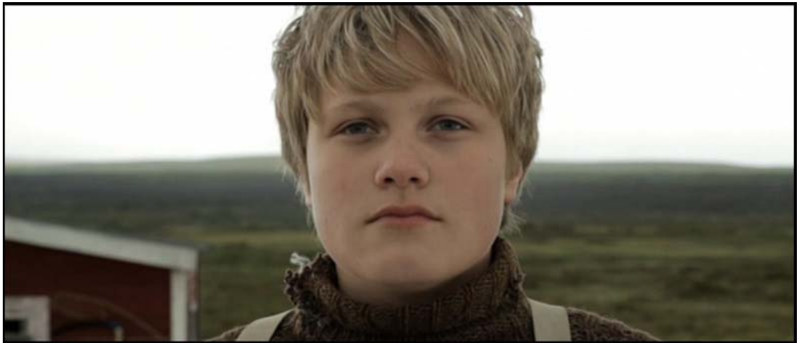
Kuvio 2. Poika on katsovinaan merta.

Varjeluksessa on kohtaus, jossa poika katsoo kotitaltaan horisontissa siintävää merta. Kuvauspaikkamme ei kuitenkaan todellisuudessa mahdollistanut suoraa näkymää merelle. Manipuloimme tilatodellisuutta leikkaamalla kohtaukseen useiden kilometrien päässä kuvattua näkökulmakuvaa merestä (kuvio 2 ja kuvio 3). Illuusio toimii ja saa katsojan kuvittelemaan meren näkyvän kotitalle.