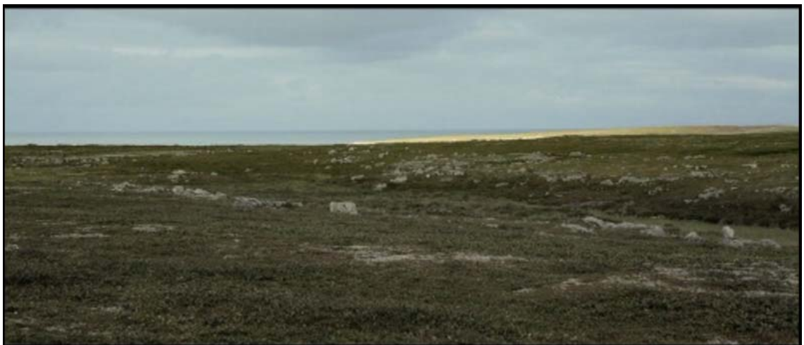
Kuvio 3. Pojan näkökulmakuva horisontissa siintävästä merestä.

Tilaulottuvuuden yhteydessä leikkaajan on tiedostettava ns. suojavaivasääntö. Sen tarkoitus on pitää kuvatilassa tapahtuvan liikkeen- tai katseensuunta ja kohteiden asemat selkeänä katsojalle leikkausten välillä (Reisz & Millar 1968, 224). Suojaviiva voidaan kuvitella kahden tärkeän kuvatilassa sijaitsevan pisteen välille. Liikkeen- tai katseen-