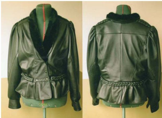
KUVIO 14. Nahkatakki

Nahkatakki on valmistettu poron nahasta ja somistettu minkkikauluksella. Useimmiten takit valmistetaan lampaan nahasta ja somisteina kauluksessa, vyötäröllä ja olkapäillä on lettipunonta. Yhteen takkiin kuluu neljä vuotaa. Kuviossa 14 on poron nahasta valmistettu romaninainen takki.