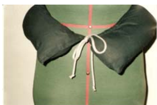
KUVIO 9. Tyyny

Hameen kauluksen alla käytetään topattua tyynyä. Sen tehtävä on auttaa puvun kauniisti laskeutumista, keventää hameen painoa vyötäröllä sekä peittää mahdollinen raskaus. (Miettinen 2007). Kuviossa 9 on malli puuvillakankaisesta tyynystä, joka on täytetty vanulla.