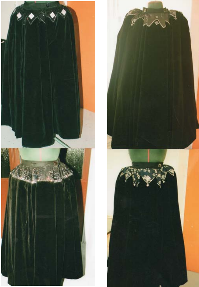
KUVIO 8. Hameita