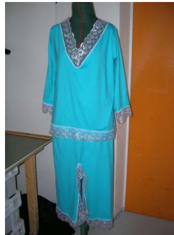
KUVIO 11. Trikoonalushame

Alushameen materiaali kuviossa 10 on puuvillaa. Kuvion 11. alushame on sileää neulosta eli singleneulosta. Tämä neulos valmistetaan niin, että oikealla puolella on oikeita silmukoita ja nurjalla nurjia. Se on yksinkertainen ja kevyt neulos. Se valmistetaan muotoon neulottuna sekä metritavarana. ( Alatalo 2002)