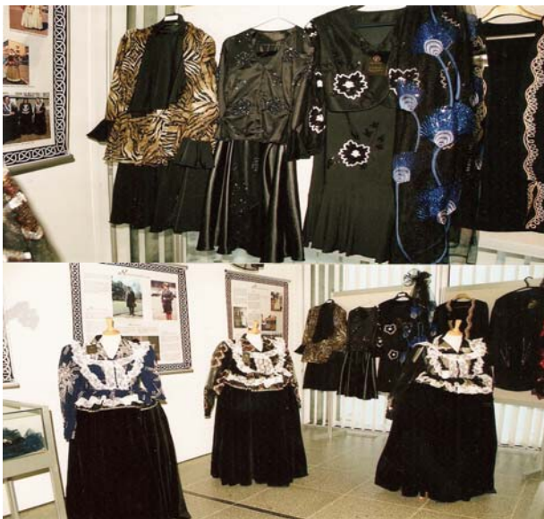
KUVIO 5. Näytteitä uusimmista designtuotteista. Oulu.2007.