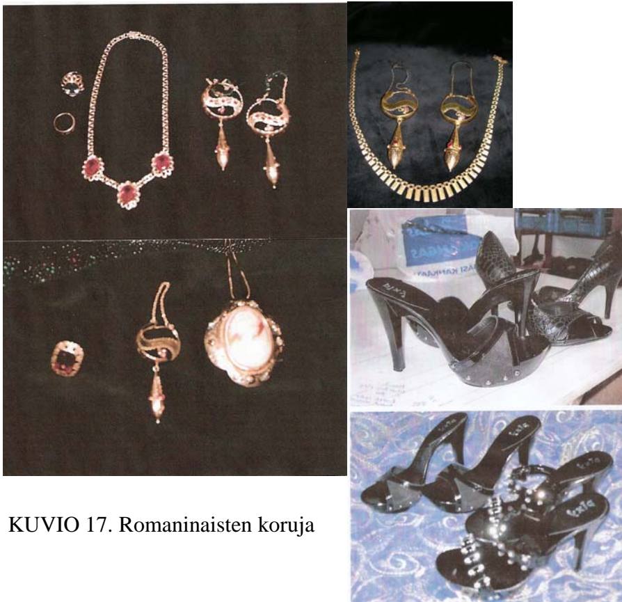
KUVIO 17. Romaninaisten koruja

Korvakorut, sormukset ja käädyt ovat yleisiä romaninaisten koruja. Suomen romaniväestön eri ryhmien välillä on selkeitä eroja myös korujen malleissa ja käyttötavoissa. Myös varallisuuden lisääntyminen on kasvattanut koruvalikoimaa. Korvakorujen perusmalleja ovat puikkomalli, kehärengas, kyynelmalli ja niin sanottu makkararengas. Kaulakäätyjen materiaalina on perinteisesti ollut hopea ja sormusten tavallisin kivi on musta onyx. Useilla mustalaissuvuilla on perinnekoruja, jotka kulkevat äidiltä tyttärelle ja isältä pojalle. Useat korut annetaan lapsille jo ennen vanhempien kuolemaa - tapana on, ettei vainajilta saatuja koruja pueta ylle, vaan että ne säilytetään muistoesineinä. (toim. Nazarenko 1986). Kuvioissa 17 ja 18 on esillä kyseisiä koruja ja jalkineita.