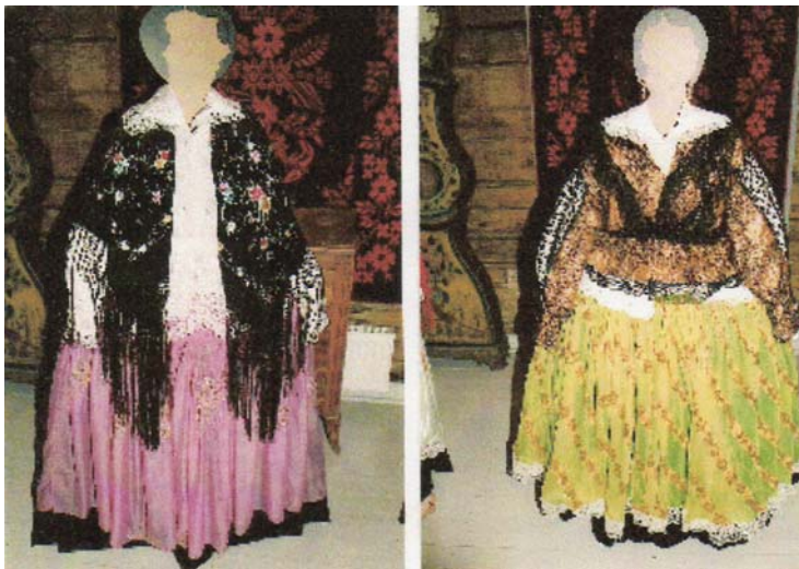
KUVIO 7. Romaninaisten pukuja 1800-luvulta. Pietarsaaren museo 2006.

Haluttuja olivat myös japanilaiset silkit. (Kaleva 1990). Kuviossa 7 on esillä olevissa asuissa kyseisiä kankaita.