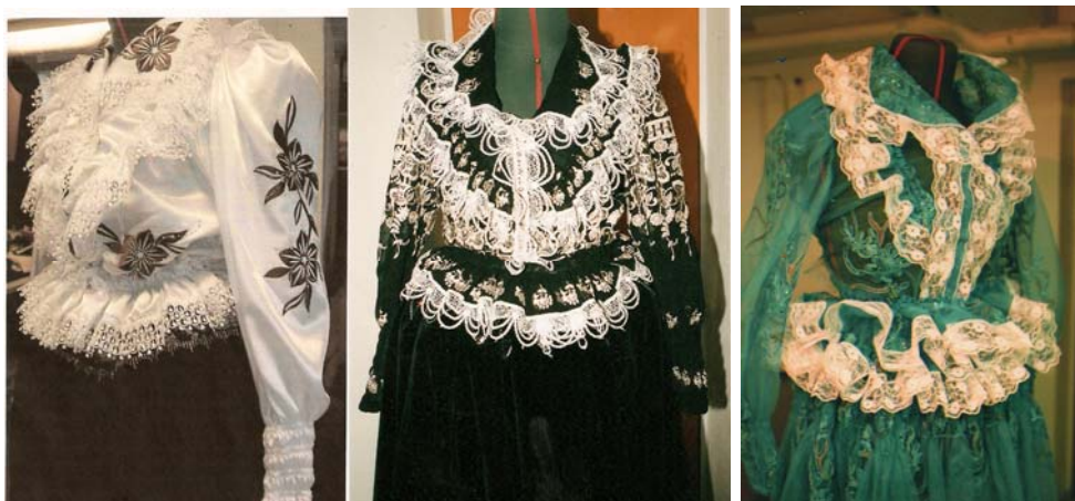
KUVIO 13. Tämän päivän röijymalleja.

ja niistä löytyy pitsiä, kimallusta ja näyttävyyttä. Röijy teetetään ammattilaisella ompelijalla. Röijyn hinta riippuu materiaalista ja koristeellisuudesta.