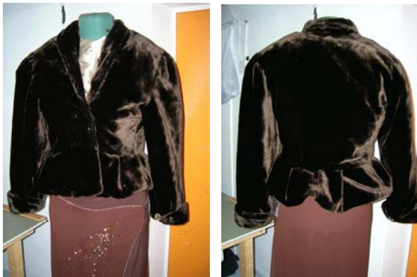
KUVIO 16. Neuloturkki

Neuloturkki on valmistettu samalla kaavalla kuin nahkatakikin, mutta nyt turkiskoneella konettamalla. Kuviossa 16 näkyy kuinka neuloksesta tulee näyttävän näköinen kevyt turkki. Koska kyseessä on neulos, asu vaati vanun miehustan ja vuorin väliin ollakseen myös lämmin. Neulos on nukkapintainen kangas, jonka nukka on muodostunut pohjakankaalla olevaan sideainekerrokseen sähköisen kentän avulla kohtisuoraan lyhyistä kuiduista. (Markula 1999, 174)