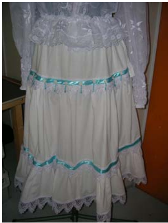
KUVIO 10. Alushame

Päällyshameen alla on täyspitkä puuvillainen alushame. Se on usein kolmekerroksinen. Jokaisesta kerroksesta käytetään nimitystä roosu. Jokaisessa kerroksessa on kaksi kertaa enemmän kangasta kuin edellisessä. Alushame koristellaan pitsein, rusetein ja kukkasin. Alushame on yleensä valkoinen, beige, musta tai sininen. Alushameen väri valitaan kulloinkin päälle puetun röijyn mukaan. (Miettinen 2007). Kuviossa 10 on kuvattu perinteinen puuvillainen alushame.