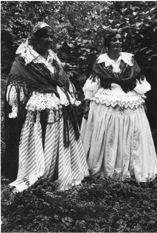
KUVIO 4. Naisten asuja

Nykyinen asu samettihameineen ja silkki- tai brokardiröijyineen yleistyi vasta 1920-1930 luvuilla ja on siis kokonaisuudessaan peräisin viime vuosisadalta. Vasta 1960-luvulta lähtien romaninaisen asu on muotoutunut suunnilleen sellaiseksi kuin se nykyäänkin on. 1900-luvun alussa romaninaisen pukeutuminen ei ole eronnut paljonkaan maalaisnaisen puvusta muutoin kuin shaalin käytön ja värien suhteen. (Markkanen 2003, 128.) Kuviossa 4 asut ovat hyvin esillä.:shaalit, huivit, röijyjen leveät pitsilliset alaroosut ja esiliinat.