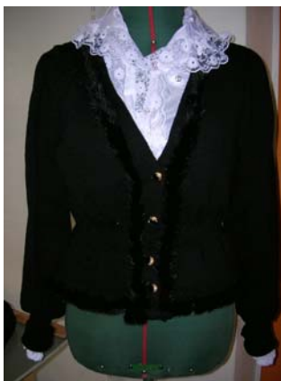
KUVIO 15. Villatakki

Villatakkiin käytin merseroitua puuvillalankaa. Menekki oli yksi kilo. Villatakin somistelin spiraalimaisilla minkkikaitaleilla. Ompelin minkkinauhat käsin kaulukseen, helmaan ja ranteisiin. Kuviossa 15 on kuvattuna valmis villatakki..