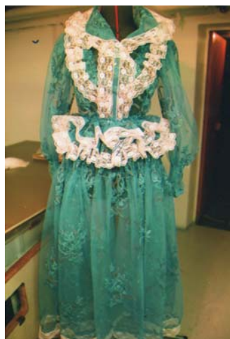
KUVIO 12. Esiliina