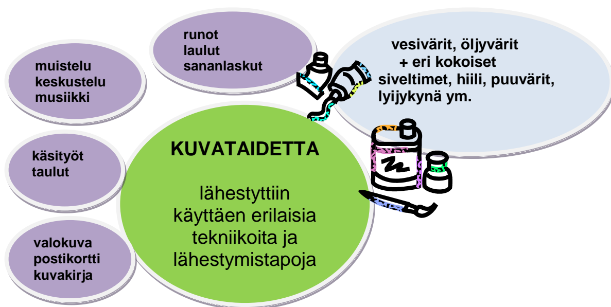
Kuvio 3. Kuvataidetta lähestyttiin työpajan aikana eri keinoin ja työvälinein.

Kirjoittaminen oli yksi käytetyistä keinoista, sanontoja, sananlaskuja, runoja pystyi kuvittamaan. Työskentelyssä hyödynnettiin yhden vanhuksen kohdalla hänelle tuttuja ja mieluisia käsitöitä muun muassa villalankaa. Uuden kokeileminen ei ollut alussa helppoa kaikille osallistujille. Kokeilemalla ja käyttämällä erilaisia tekniikoita hyödyksi työskentelyn aikana saatiin aikaiseksi hyvin erilaisia ja persoonallisia lopputuloksia.