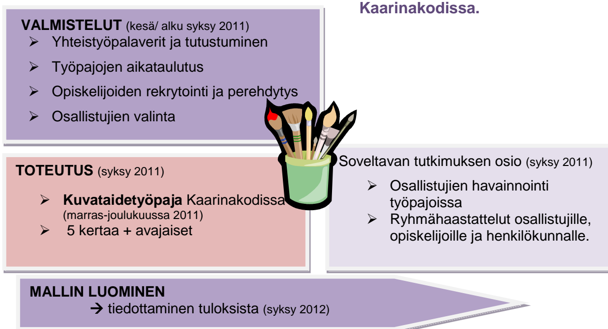
Kuvio 1. Kehittämiprojektin kulku

Hyvä arki vanhuksele – kuvataidetta muistisairaiden vanhusten iloksi Kaarinakodissa.