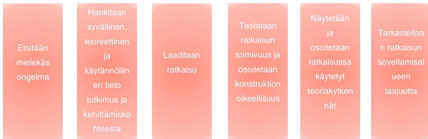
Kuvio 2. Kuvaus konstruktivisen tutkimuksen prosessista (Ojasalo ym. 2015: 67).

käytännön työssä, konstruktivisen tutkimuksen lähestymistapa on hyödyllinen. Konstruktivisessa tutkimuksessa ratkaistaan käytännön ongelma luomalla jokin uusi konstruktio eli esimerkiksi konkreettinen tuotos. Jotta uusia rakenteita voidaan luoda, tarvitaan tietoa teoriasta ja käytännöstä. (Ojasalo ym. 2015: 65.) Tämän opinnäytetyön tuotoksena syntyi konkreettinen opas, jota voidaan hyödyntää Metropolia Ammattikorkeakoulun suunhoidon opetusklinikan toiminnassa ruotsinkielisen potilaan hoitojaksolla. Opas antaa tukea suuhygienistiopiskelijalle ruotsinkielisen potilaan kanssa kommunikointiin. Käytimme hyväksi olemassa olevaa käytännön tietoa sekä tutkimaamme teoretietoa. Lähestymistavan sekä menetelmän avulla pääsimme opinnäytetyön prosessissa eteenpäin ja lopulta tavoitteisiin.