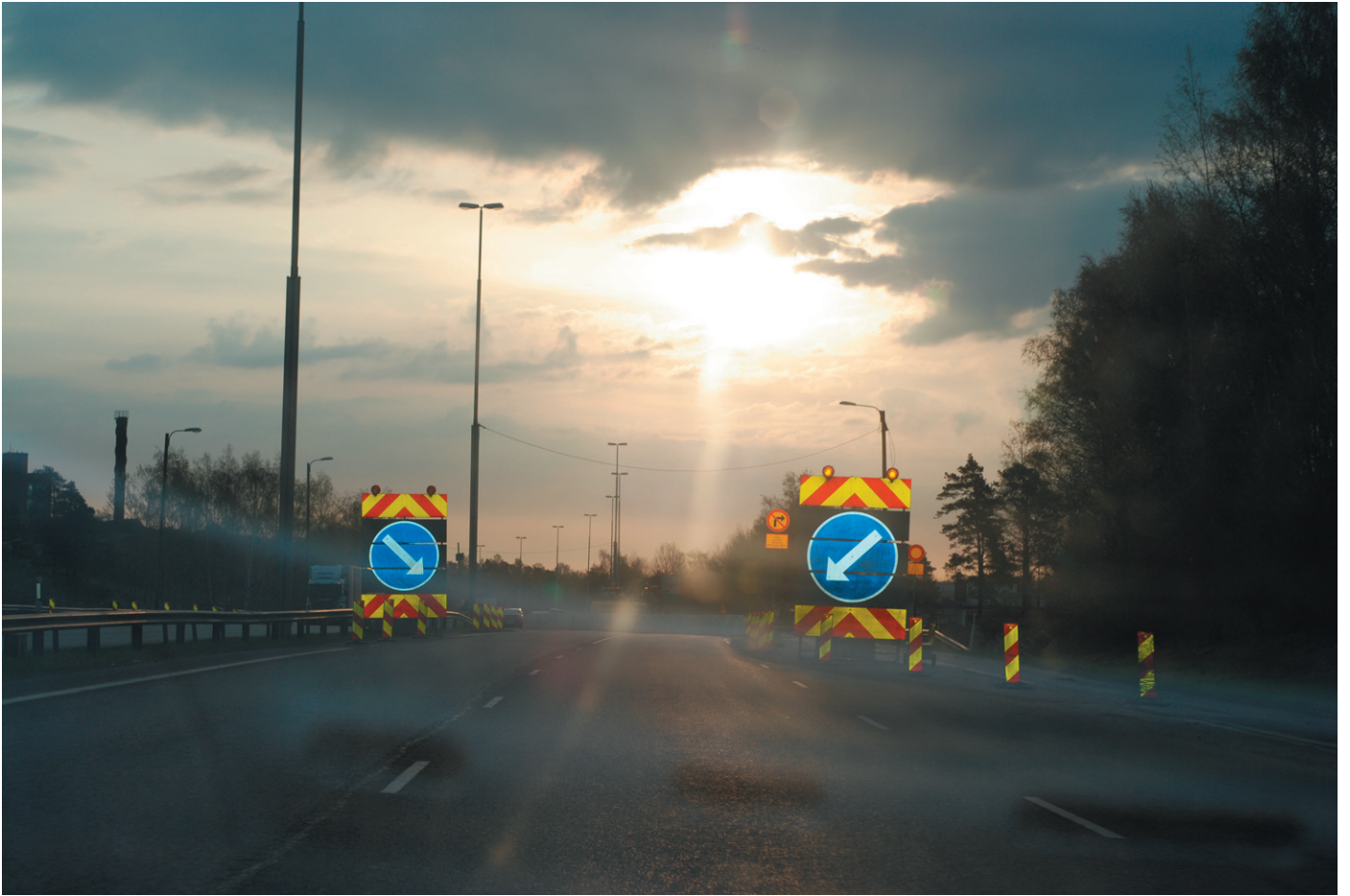
“One more time”