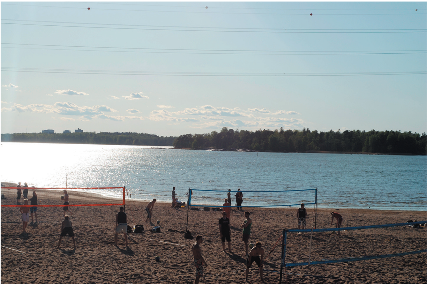
“Mun aika, mun paikka, mun maailma”