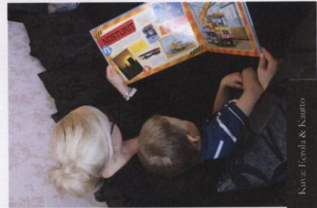
Kuva: Eerola & Kautto