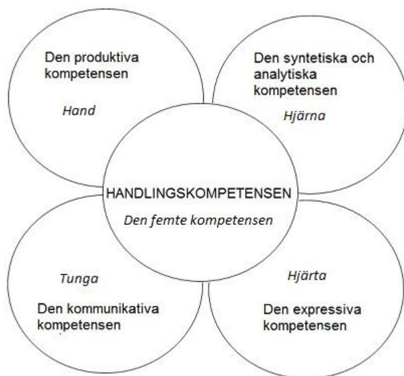
Figur 1. Bildningsblomman (Madsen 2001:226).

Den femte kompetensen kallas handlingskompetensen. Denna kompetens är en integration av de fyra kompetenserna och de används i reflekterad praktisk handling. (Eriksson & Markström.2000:173–174) När man har uppnått den femte kompetensen inom socialpedagogik ska socialpedagogen kunna vara kreativ och ha förmåga att tänka och handla på ett skapande sätt i förhållande till sig själv och sin omvärld. I den femte kompetensen ska man ha färdighet att använda material samt skapa och samtidigt tänka på det etiska förhållningsättet, kommunikation och kunskapen bland de olika delarna. (Madsen 2001:234)