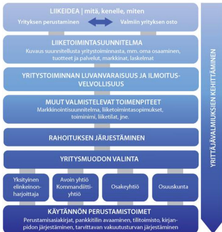
KUVIO 3 Liiketoimintasuunnitelma

”Liikeidea on suunnitelma, joka kertoo miten yritys toteuttaa perusideansa päämäärinsä pyrkiessään.” (Ikonen, R. Savikko, R. Ikonen, T. 2010. Oman yrityksen perustaminen. Porvoo. Konsultia)