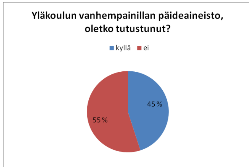
Kuvio 6: Vanhempainillan päihdeaineisto 1.

Vastanneista 55 % ei ollut tutustunut kyseiseen aineistoon ollenkaan. 45 % oli tutustunut aineistoon.