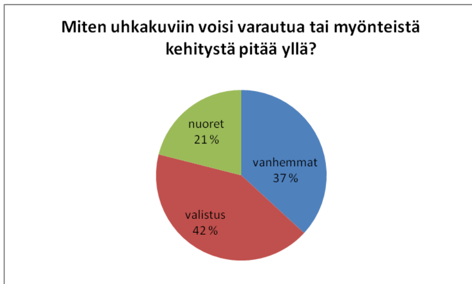
Kuvio 3: Avainsanat

Vastaukset kategoroituvat kolmeen teemaan, joiden avainsanat olivat valistus, vanhemmat ja nuoret. Valistuksen teemapäivien ja päihdekampanjoiden merkitys koettiin suureksi. Niitä toivottiin lisää. Infoa, valistusta ja ajankohtaista tietoa toivottiin myös opettajille lisää. Valistuksen toivottiin olevan avointa ja keskustelevaa. Oppilaille, vanhemmille ja opettajille toivottiin enemmän resursseja valistustyöhön.