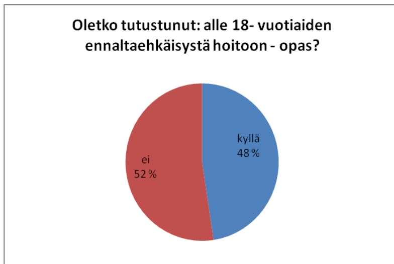
Kuvio 4: Ennaltaehkäisystä hoitoon -opas.

Alle 18-vuotiaiden päihteiden käyttö: Ennaltaehkäisystä hoitoon –opas: Oletko tutustunut?