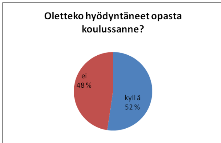
Kuvio 5: Ennaltaehkäisystä hoitoon -opas

Vastanneista 48 % ei ollut hyödyntänyt opasta työssään. 52 % ilmoitti hyödyntäneensä opasta työssään.