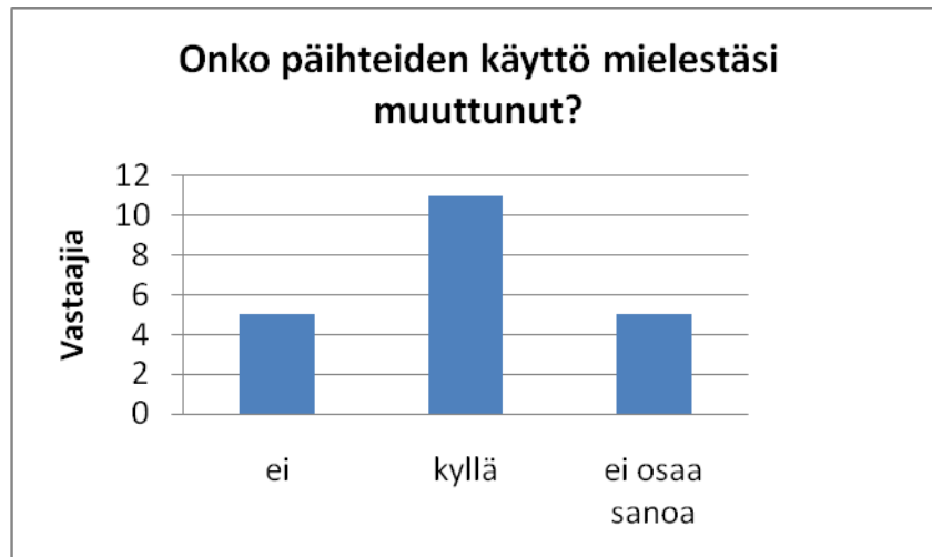
Kuvio 1: Päihteiden käytön muuttuminen työhistorian aikana

Vastaajista 52 %, eli 11 vastaajaa ilmoitti, että nuorten päihteiden käyttö on heidän mielestään muuttunut. Heistä neljä vastaajaa oli sitä mieltä, että päihteiden käyttö olisi vähentynyt heidän työhistoriansa aikana. Vain kaksi ilmoitti havainnoineensa päihteiden käytön lisääntymistä. Kaksi vastaajaa toi esille, että päihteiden käyttö aloitetaan entistä nuorempana. Kolme vastaajaa ilmoitti havainnoineensa päihteiden käytön muuttuneen, mutta eivät perustele vastaustaan.