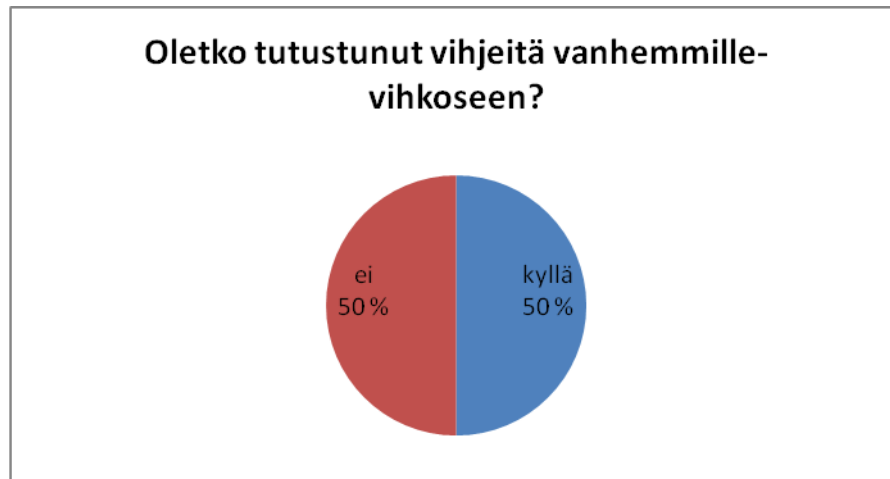
Kuvio 8: Vihjeitä vanhemmille -vihkonen 1.

50 % vastanneista ilmoitti, että ovat tutustuneet vihkoseen. Samoin 50 % ilmoitti, että ei ole tutustunut vihkoseen.