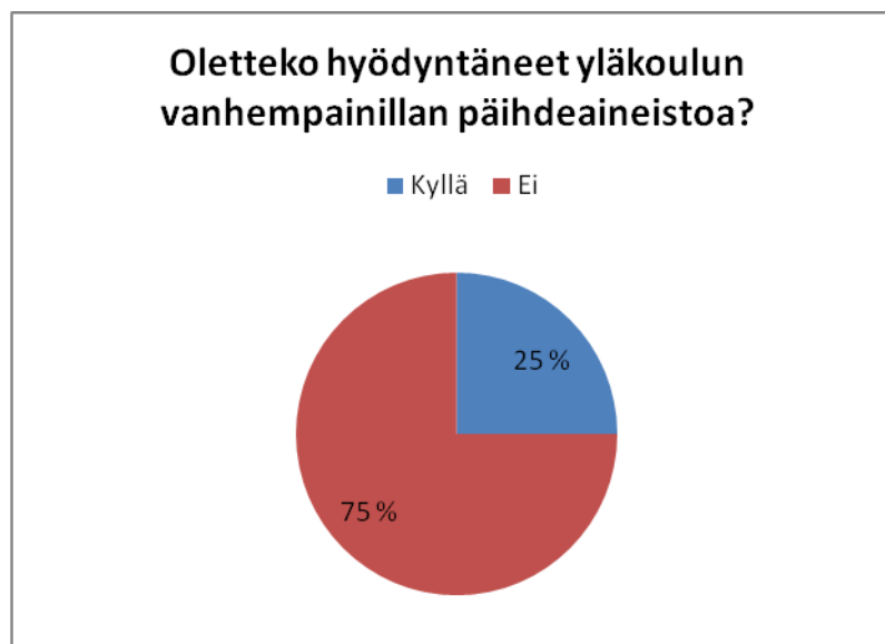
Kuvio7: Vanhempainillan päihdeaineisto 2.

Kysymys 11 oli: Oletteko hyödyntäneet edellä mainittua aineistoa?