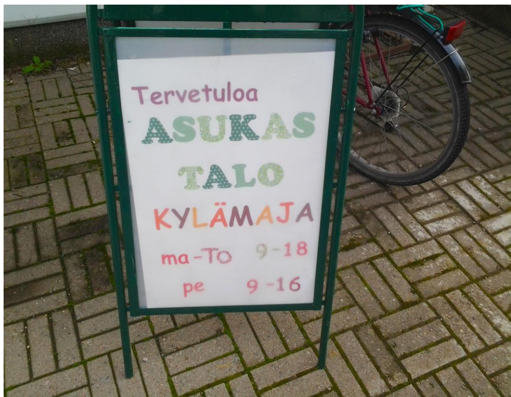
Kuva 1. Asukastalon aukioloajat.

Alkuperäisenä ideanani lopputyössäni oli luoda kävijäprofiilit eri kansallisuuksiin pohjaten, jotka käyttävät asukastaloa. Työn tekemistä ja mielekkyyttä lisää kävijäprofiilien kohdentaminen yksittäisiin maahanmuuttajataustaisiin käyttäjiin. Ennen havainnointini aloittamista, hahmottelin havainnointirungon, joka konkretisoi asiakasprofiilin ideaa. Loin mielessäni hahmotelmia kävijäprofiileiksi ja sa-