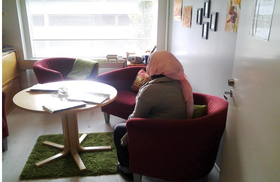
Kuva 4. Maahanmuuttajataustainen työllistetty.

Tämän kävijäprofiilin alle voi myös mainita liittää maahanmuuttajat, jotka ovat tarjoutuneet auttamaan asukastalon arjen toiminnoissa, vetämään asukasryhmiä ja avustamaan muita kävijöitä. Työsopimus on yleensä 3-9 kuukautta kerrallaan. Maahanmuuttajatyöllistetty toimii tulkkausapuna ja asiointiapuna ja on hyödyllinen asukastalon yleishöylä. Maahanmuuttajien työllistäminen voi olla ennaltaehkäisevä toimenpide lähivuosille isojen ikäluokkien jäädessä eläkkeelle. Työharjoittelu voi olla hyödyllinen portti työelämään. Asukastalossa työharjoittelussa ollut maahanmuuttaja työskentelee tällä hetkellä esimerkiksi ruokakaupassa. Työllistetty voi olla erilaisilla työsopimuksilla asukastalossa: esimerkiksi kuntouttavassa työtoiminnassa, työharjoittelussa, työelämävalmennuksessa tai palkkatuella.