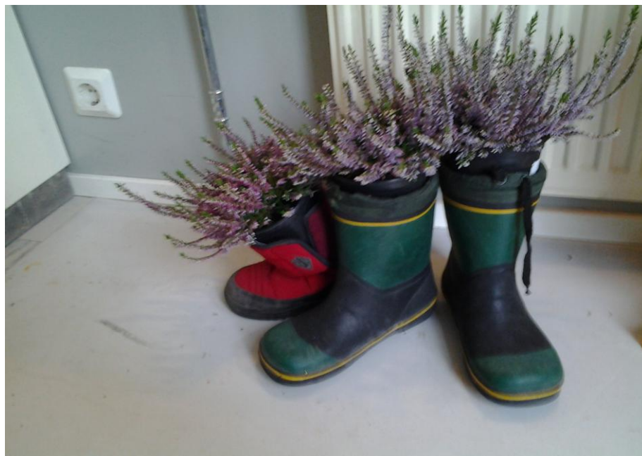
Kuva 10: Puuttuvat etniset kävijäryhmät.

Pasilan asukastalossa on koulutettu maahanmuuttajataustaisia vertaistukiohjaajia. Vertaistukiohjaajille vaikuttaisi olevan tilausta myös Kylämajassa, koska asukastalolla on runsas maahanmuuttajakävijäpohja. Vertaistukiohjaaja palvelisi varmasti osana työryhmää maahanmuuttajia. Työllistetty maahanmuuttaja Nora vaikutti hyvin innostuneelta, että Kylämajassa olisi mahdollisesti mahdollisuus hakeutua koulutusprosessiin tulevaisuudessa, jos projektille saadaan rahoitus. Pasilan asukastalon haastattelun ja havainnoinnin perusteella vertaistukiohjaajan työnkuva on monipuolinen. Vertaistukiohjaajalle on eduksi osata arabian kieltä ja olla perillä tai lähtöisin somali- ja muslimikulttuurista. Vertaistukiohjaajalla on jalkautuva työote. Virastoissa asiointi on työlästä maahanmuuttajille, jos ei puhu englantia tai suomea. Virastot ovat usein haluttomia tilaamaan tulkkauks palvelua. Väärinymmärrykset voivat lisätä maahanmuuttajien eriytymistä ja huonoa Suomi-kuvaa ja syrjintää. Esimerkiksi näissä teemoissa vertaistukiohjaajan apu ja ohjaus on tärkeää. Havainnointini ja haastattelut tukevat sitä tosiasiaa, että vertaistukiohjaajalle olisi tarvetta Kylämajassa.