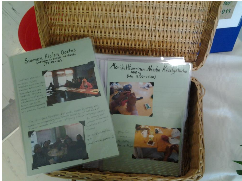
Kuva 3. Asukastalonryhmien esitteitä.

Tämä kävijäprofiili muodostui tarkkailemalla ryhmiin osallistuvien maahanmuuttajia: ovatko he pääsääntöisesti naisia vai miehiä? Tähän perustuen voin todeta, että maahanmuuttajanaiset ovat aktiivisia ryhmiin osallistujia. Maahanmuuttajat kertoivat haastattelussa, että varsinkin työttömillä maahanmuuttajanaisilla on runsaasti vapaa-aikaa, jonka he saattavat haluta kanavoida opiskeluun tai itsensä kehittämiseen. Asukastalon työllistetty vahvisti haastattelussa, että maahanmuuttaja naisilla on usein enemmän vapaa-aikaa kuin miehillä, jos otetaan näkökulmaksi, että mies toimii perheen elättäjänä ja nainen hoitaa kotia ja lapsia. Maahanmuuttaja naiset osallistuvat Kylämajassa muun muassa seuraaville kursseille: suomenkielen opetus somalinaisille, luetaan yhdessä ryhmä, naisten keskustelukerho, käsityökurssi, salsatanssi ja ompelu kurssi.