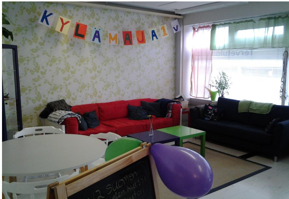
Kuva 6. Asukastalon olohuone.

Tämän kävijäprofiilin nimeäminen oli haasteellista ja se poikkeaa muista kävijäprofiileista, koska se voi edustaa isompaa ryhmää tai se voi tarkoittaa yksittäistä maahanmuuttajaa, joka on varannut osan asukastalosta itselleen ja muille. Joka tapauksessa voidaan sanoa, että muutamat maahanmuuttajaryhmät ovat löytäneet asukastalon kokoontumispaikakseen. Tilat sopivat hyvin esimerkiksi asukasyhteisö- ja verkostotapaamisiin sekä monenlaisiin kerho- ja muihin toimintoihin. Tiloja käyttävät maahanmuuttajista aktiivisesti bulgarialaiset ja unkarilaiset. Kylämajan tiloja on hyödyntänyt toiminnassa myös Neda-irakilaisnaisten järjestö.