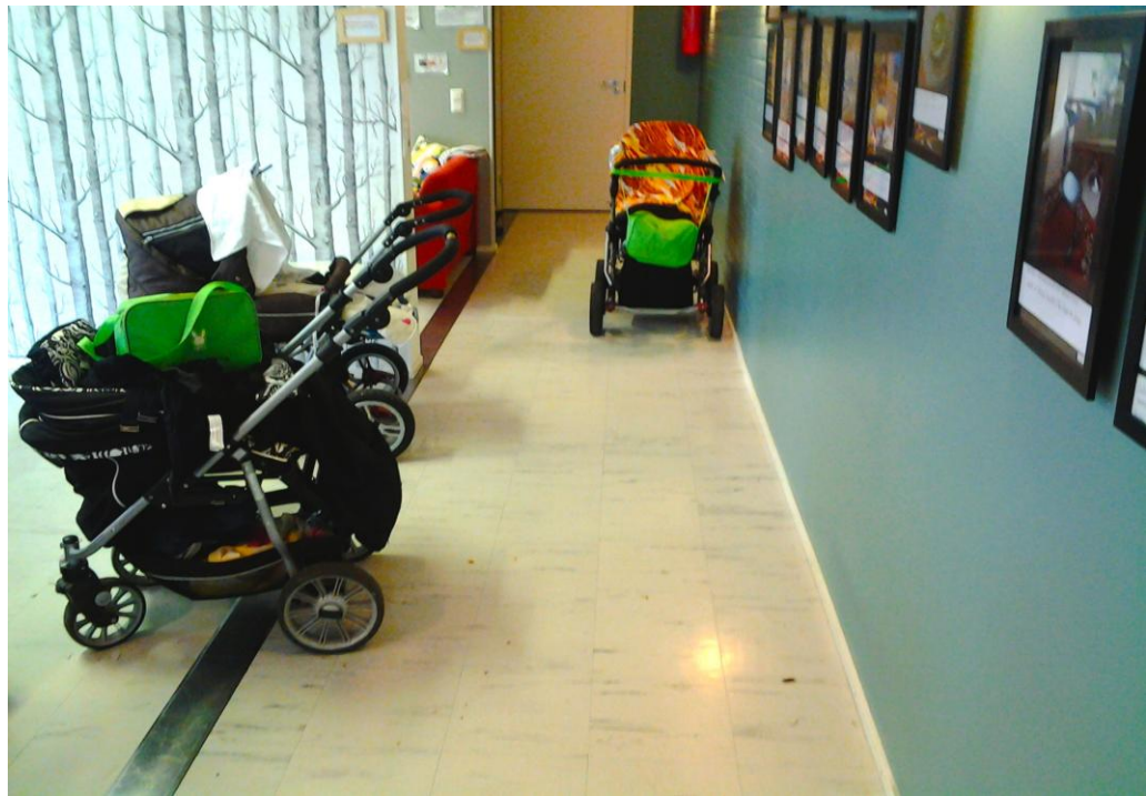
Kuva 2. Lastenvaunuja.

Maahanmuuttaja kotiäiti on usein somalinainen. Äideille ja lapsille on järjestetty asukastalossa hyvin molemmat osapuolet huomioonottavaa toimintaa.