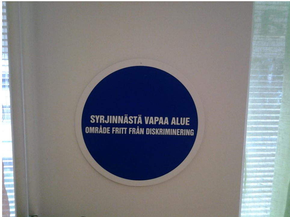
Kuva 5. Kyltti asukastalossa.

Havainnointini perusteella voidaan todeta, maahanmuuttajavanhus hakee usein asukastalosta ajanvietettä ja sosiaalista toimintaa. Asukastalolla käyminen ehkäisee yksinäisyyden tunnetta ja luo henkilölle tunteen ”kuulun ja olen osa jotakin.” Kylämajan olohuoneessa istuskeli jokaisella havainnointikerralla jossain vaiheessa maahanmuuttajavanhus. Ikääntyneet maahanmuuttajat eivät osaa usein suomenkieltä ja tarvitsevat apua käytännön asioiden hoidossa. Luku- ja kirjoitustaidon vahvistamisessa Kylämajan ryhmätoiminnot saattaisivat palvella hyvin ikäihmisten tarpeita. Maahanmuuttaja vanhukset ovat potentiaalinen iso kävijäryhmä: miten tavoitetaan lisää kävijöitä? Maahanmuuttajavanhusten hiljaisen tiedon hyödyntäminen asukastalon palveluiden kehittämisessä on yksi kehittämis ehdotus.