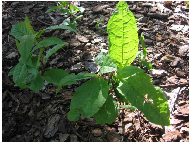
KUVA 6. Luonto

Valokuvia kasveista (kuvat 6,7 ja 8) sekä luonnon ilmiöistä (kuva 9) lapset ottivat myös paljon. Luonnon kuvaamisessa lapset käyttivät monia erilaisia lähestymistapoja. Kuvia oli otettu läheltä ja kauempaa sekä kameran asentoa vaihdellen.