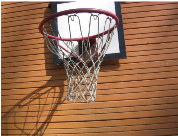
KUVA 10. Leikki

Uusien taitojen oppiminen ja kokeileminen ovat myös lapsille tärkeitä asioita ja tapahtuvat aivan tavallisen leikin yhteydessä, ilman että joku on opettamassa. Liikkuminen ja myönteiset onnistumisen kokemukset vahvistavat lapsen osallisuutta ja lisäävät halua opetella uusia asioita.