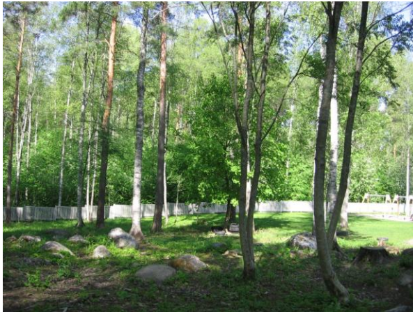
KUVA 1. Metsä

Valokuvista ja lasten kommentteista selvisi, että päiväkodin piha-alueeseen kuuluva metsä (kuva 1.) on heille tärkeä, innostava ja mielenkiintoinen paikka.