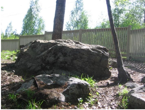
KUVA 3. Leikit metsässä

”Tää oli meidän leikki, otin sen siksi että jos lähden reissuun niin muistan sen. Tämä on toniska leikki, siinä ruokitaan, tehdään petejä, ulkoillaan ja vuorotellen syödään.” ”Tässä kuvassa on toniskat, ne pienet hiiret. Ötököitäkin lentää siellä paljon. Siellä on myös isot hiiret ja tuo on niiden pöytä. Me aina mennään kattomaan onko joku ne varastanu.”