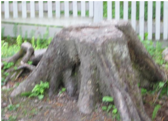
KUVA 4. Leikit metsässä

”Otin siitä isosta kivistä kuvan, koska siitä voi laskea alas puuta myöten. Siinä kiven päällä voi myös leikkiä kotista. Sieltä voi mennä metsään ja hypellä muitten kivien päällä.”