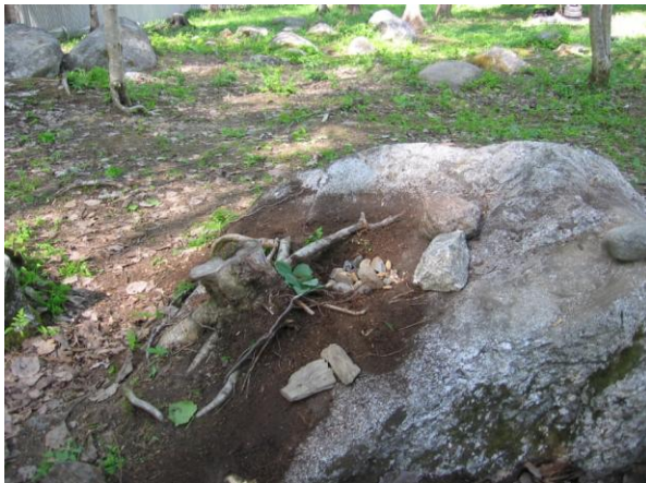
KUVA 2. Leikit metsässä

”Mä otin sen takia metsästä kuvan koska siellä on kiva leikkiä kaikkee sellasia ruokaleikkejä, tai kotista.”