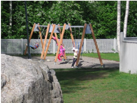
KUVA 5. Kaverit

Valokuvia, joissa lapset olivat kuvanneet omia kavereitaan tai leikkejä yhdessä oli 23, näissä kuvissa oli joko pelkästään otettu kuva kaverista tai leikeistä kaverin kanssa. Monet kuvat ovat lähikuvia lasten kavereista, tähän opinnäytetyön kirjalliseen osuuteen en eettisistä syistä lasten yksityisyyttä suojellakseni näitä lähikuvia ottanut. Lasten toisistaan ottamat kuvat ansaitsevat kuitenkin maininnan siitä, että ne ovat aitoudessaan ja herkkyydessään omaa luokkaansa. Esimerkiksi lähikuvat joita lapset ovat ottaneet kavereittensa jatkaessa rauhassa leikkiään välittävät tietoa siitä kuinka keskittyneitä lapset ovat leikkeihinsä ja kuinka tärkeää se heille on.