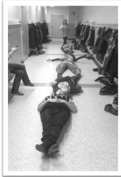
Kuva 1: ” Joo, vähä sekoiltii, ku odotettii opoo ”

na", jotka voivat nuorille olla joko yksityisiä tai julkisia. Nuorelle julkisen tilan käyttö liittyy sosiaalisuuteen ja yhdessäoloon. (Mts. 69.)