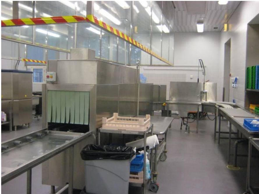
Kuvio 10. Astianpesukone.

Kuviosta 9 haastateltavat totesivat, että kaikki pinnat erilaisista keittiön vaunuista pyyhitään mikrokuituliinalla tai mikrokuitumopilla päivittäin. Sairaaloiden ravintokeskuksissa on tänä päivänä usein vaununpesukone, mutta Malmilla ei sellaista ole käytössä. Ruoankuljetusvaunu pestään neutraalilla pesuaineliuksella ja pesuharjalla sisältä kerran viikossa, päivittäin se pestään mikrokuitumenetelmällä kuten muutkin keittiön vaunut.