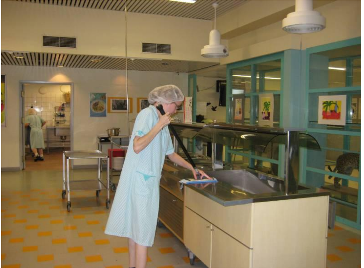
Kuvio 5. Linjaston puhdistusta.

työntekijä muistaa säätää käytössä olevat välineet oman pituutensa ja työtehtävän mukaisesti.