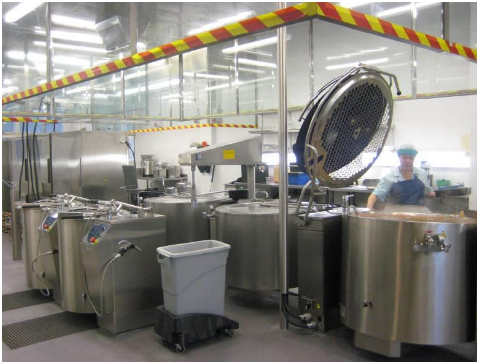
Kuvio 7. Tuotantoalue.

Toisessa kohdepaikassa on käytössä lattianhoitokone, jota tämän toimipaikan henkilöt pitivät tärkeänä vedettömän siivouksen työvälineenä. Useissa keittiöissä, joissa ei ole lattianhoitokonetta, sellainen kuitenkin on kiinteistössä siivouspalvelua suorittavan henkilökunnan käytössä. Pohdittiin mahdollisuutta lattianhoitokoneiden yhteiskäytöstä – laitehankintakustannukset jakautuisivat näin koko kiinteistön kesken, ja koneen hyötykäyttö kasvaisi.