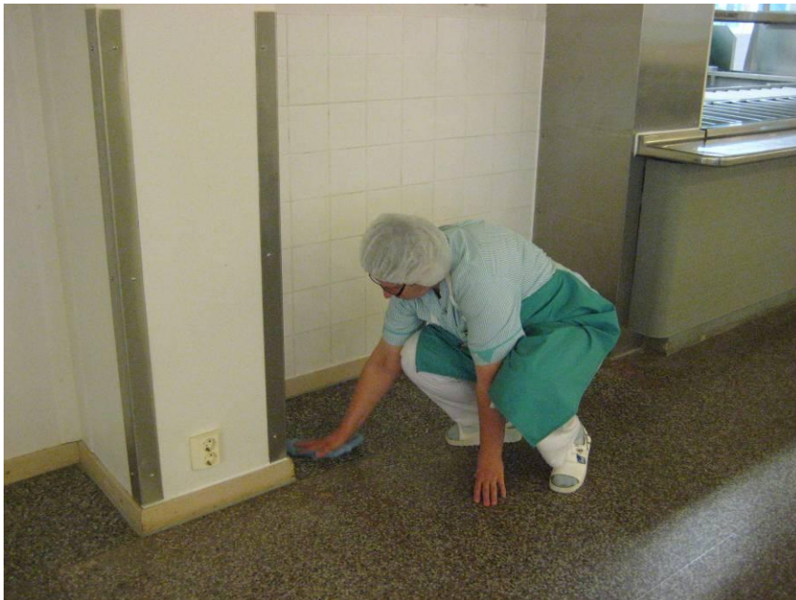
Kuvio 11. Lattian puhdistus perinteisin menetelmin lattianhoitokoneen jälkeen.

Mikäli latioilla on tahroja, niitä voidaan liottaa suihkuttamalla suihkepullosta tähän tarkoitukseen varattua pesuaineliuosta, ja sen jälkeen pestä lattia mikrokuitumopilla. Liottamista ei tarvita lattianhoitokoneita käytettäessä.