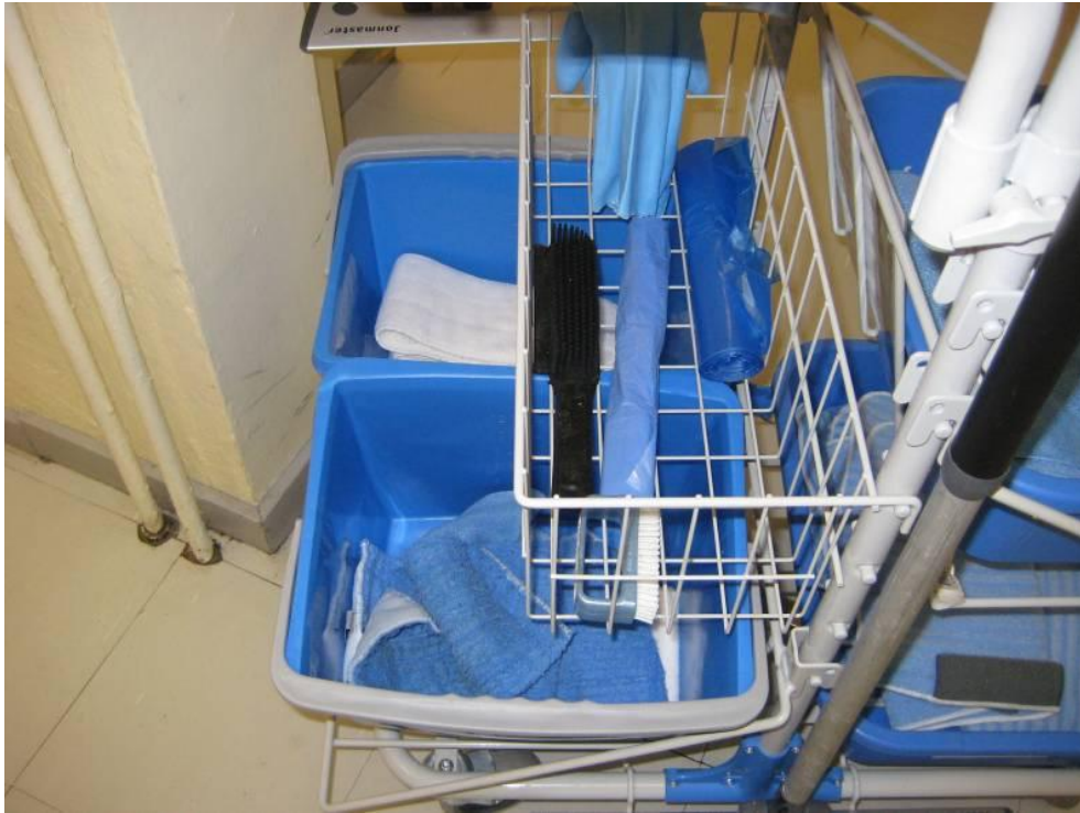
Kuvio 4. Siivousliinojen säilytys.

Haastattelussa osallistujat pitivät selvänä, että pesuaineen kulutusta keittiöissä voidaan olennaisesti vähentää ottamalla mikrokuitusiivous kaikissa soveltuviissa kohteissa käyttöön.