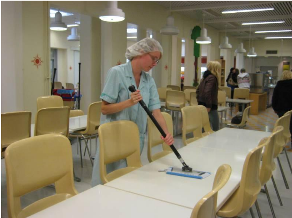
Kuvio 6. Ruokasalin pöytien puhdistus. Kuva Kirsi Hanski.

Haastateltaville näytettiin kuvio 6. Haastateltavat kertoivat kuvan perusteella ruokasalin siivouksesta: