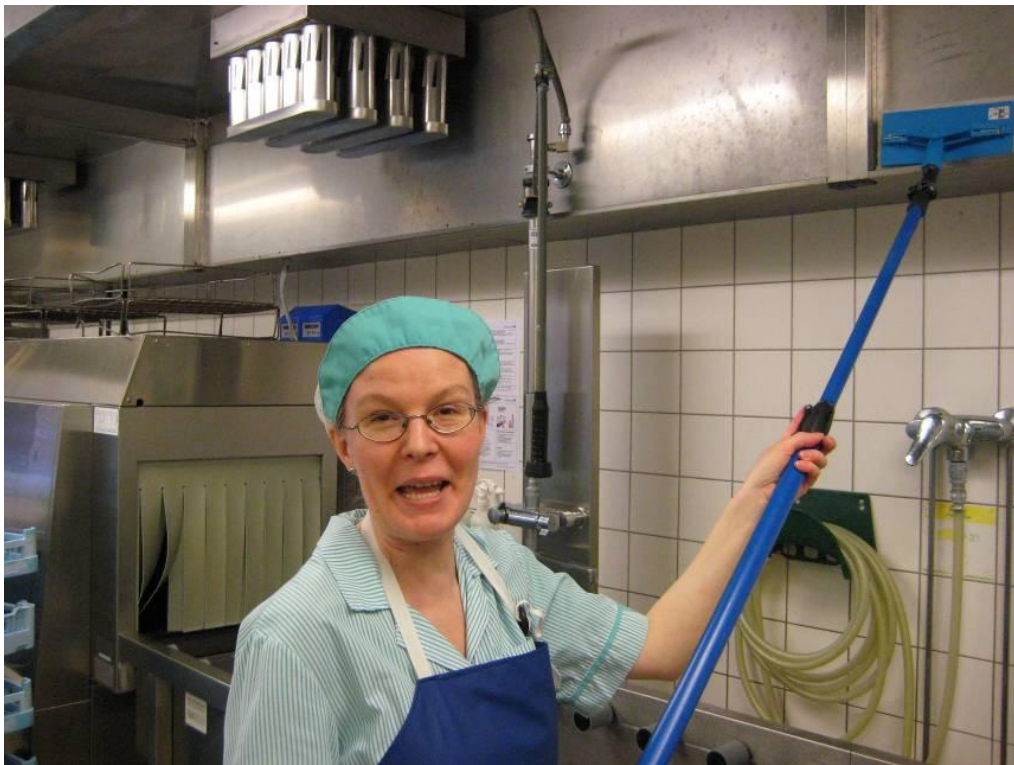
Kuvio 8. Astianpesuosasto.

Pata- ja uuniryhmien päällä olevat ilmanvaihtolaitteet on rajattu yleensä metalli- tai lasireunoilla. Niiden pyyhkiminen on vaivatonta mikrokuitumopilla, jos käytettävissä on tarkoitukseen sopiva jatkovarsi. Tämä työvaihe helpottui oleellisesti mikrokiutusiivouksessa kaikkien haastateltavien mielestä ja työn jälki oli huomattavasti parempi ja pinnat kirkkaita. Seuraavassa haastatteluotteessa esitetään, että uudella menetelmällä lattioita siivotessa saavutetaan parempi puhtaustaso kuin perinteisellä vesi-pesuaine-harja-lastapesulla: ”--- ei tarvitse siivota niin usein , kun tehdään tällä menetelmällä, koska on puhtaampaa. Me ollaan luopumassa yhdestä siivouskerrasta ja saadaan siitäkin säästöä. Koska puhtaustaso on parempi, miksi tehdä siivousta siivouksen vuoksi?”