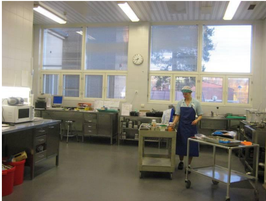
Kuvio 9. Vaunujen puhdistus.

Kuviosta 9 haastateltavat totesivat, että kaikki pinnat erilaisista keittiön vaunuista pyyhitään mikrokuituliinalla tai mikrokuitumopilla päivittäin. Sairaaloiden ravintokeskuksissa on tänä päivänä usein vaununpesukone, mutta Malmilla ei sellaista ole käytössä. Ruoankuljetusvaunu pestään neutraalilla pesuaineliuksella ja pesuharjalla sisältä kerran viikossa, päivittäin se pestään mikrokuitumenetelmällä kuten muutkin keittiön vaunut.