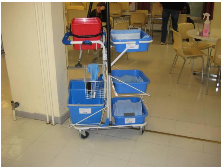
Kuvio 3. Siivousvaunut varusteineen.

Haastateltaville näytettiin kuvio 3. Kuvassa näkyy siivousvaunu varusteineen. Siivousmenetelmää ohjasi molemmille keittiöille saman pesuainetoimittajan sama yhteyshenkilö. Haastateltavien mielestä menetelmän ohjauksessa on ollut eroja eri ohjauskerroilla. Toinen mahdollisuus on, että koulutettavat henkilöt eivät ole omaksuneet annettua tietoa samalla tavalla. Haastattelussa tuli selvästi esille kahden toimipaikan erilaiset käsitykset menetelmästä.