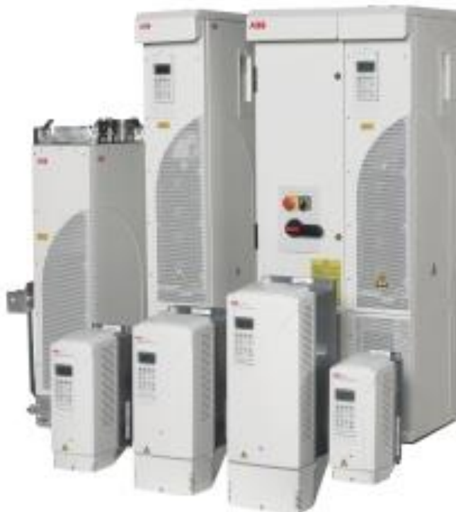
Kuva 8. Taajuusmuuttajia.

Taajuusmuuttajia voidaan käyttää monissa eri teollisuuden sovelluksissa, joissa on käytössä vaihtosähkömoottoreita. Tyypillisimpiä ovat pumppu- ja puhallinkäytöt, hissit, liukuportaat, isojen koneiden voimansiirrot esim. paperikoneiden sekä laivojen potkurikäytöt ja tuulivoimalat. (Kuva 8.)