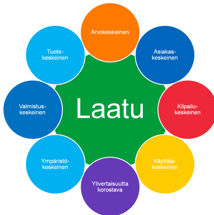
Kuva 4. Laatuympyrä. [6]