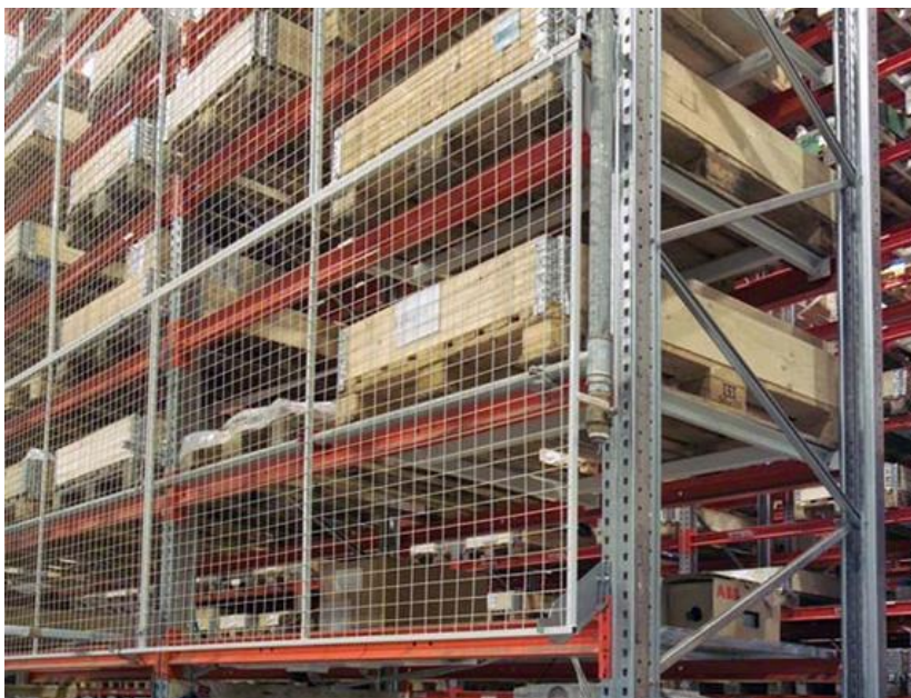
Kuva 9. ABB:n varastolavoja hyllyssä.

Layout-alojen jälkeen alettiin tehtaalla muuttaa varastointikäytäntöjä yhdessä ABB:n kahden tärkeimmän tavarantoimittajan DHL:n sekä Geodis Wilsonin kanssa. Tarkoituksena oli saada tehtaalla vähennettyä varastointialaa ja pitää vain tarvittavat määrät osia ja komponentteja hyllyissä. (Kuva 8.)