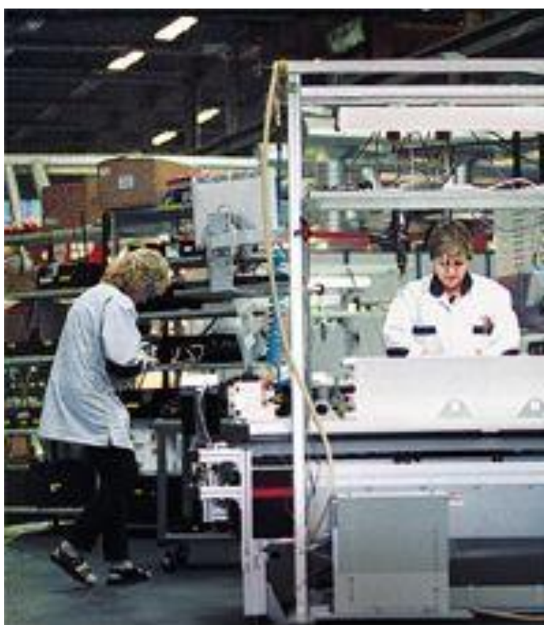
Kuva 6. Taajuusmuuttajien kokoonpanoa tuotantolinjalla.

Lean-toiminnan pääperiaatteita sovelletaan myös ABB:n Pitäjänmäen taajuusmuuttaja-tehtaalla. Lean-projekti alkoi varsinaisesti ABB:n tuotantolinjoilla alkuvuodesta 2010. Sen tarkoituksena oli tehostaa toimintaa tuotannossa sekä parantaa tehtaan tuotteiden laatua että saada työpisteiden sekä tuotantolinjojen kokoonpanotilat ja työvälineet tarkoituksenmukaisemmiksi. (Kuva 6)