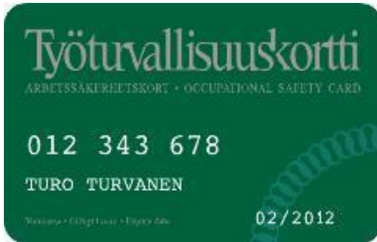
Kuva 2. Työturvallisuuskortti.

Osana eri Lean-yritysten työturvallisuuskäytäntöjä on myös työturvallisuuskorttikoulutuksen suorittaminen. Kun työntekijä suorittaa koulutuksen ensimmäistä kertaa vie koulutus koko päivän ja kurssin loppuun täytetään koulutuksen sisältöön liittyvä koe. Monessa eri teollisuuden alan yrityksessä jokainen työntekijä asemasta riippuen käy työturvallisuuskorttikoulutuksen. Kortti (kuva 2) on voimassa 5 vuotta, jonka jälkeen käydään uudestaan lyhyt kertauskurssi ja tehdään uusi koe.