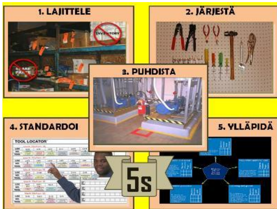
Kuva 5. Esimerkkikuva 5S-vaiheista. [7]

Jokainen työntekijä osallistuu työpisteen järjestämiseen, siivoamiseen ja siisteyden ylläpitoon seuraavien ohjeiden mukaisesti: