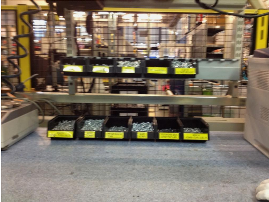
Kuva 10. 5S:n mukainen työpiste.