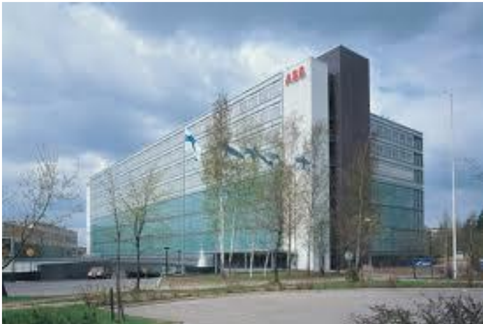
Kuva 7 ABB:n tehdasnäkymä Pitäjänmäellä.

Vaasassa sijaitsee Suomen muuntaja-, kytkintuote-, rele- sekä ohjausautomaatiotuotteiden tehdas, sekä Porvoossa sähköasennustuotteiden tehdas.