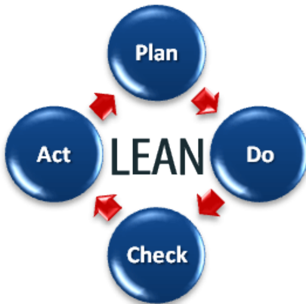
Kuva 1. Lean ajatuskehä. [5]

Ajatus tehdä insinööriyö Lean johtamisfilosofiasta syntyi kun sain henkilökohtaisesti seurata lähietäisyydeltä, työpaikallani viime vuoden aikana käyttöön otettua jatkuvan parantamisen ja 5S:n kaltaisia menetelmiä. Niiden tarkoituksena on ollut Lean ajattelun pohjalta parantaa työn tuottavuutta ja työskentelyolosuhteita. Olen päässyt läheltä seuraamaan eroa, joka on ollut havaittavissa vanhojen työtapojen ja uusien Leanin mukaisten menetelmien välillä. (Kuva 1.)