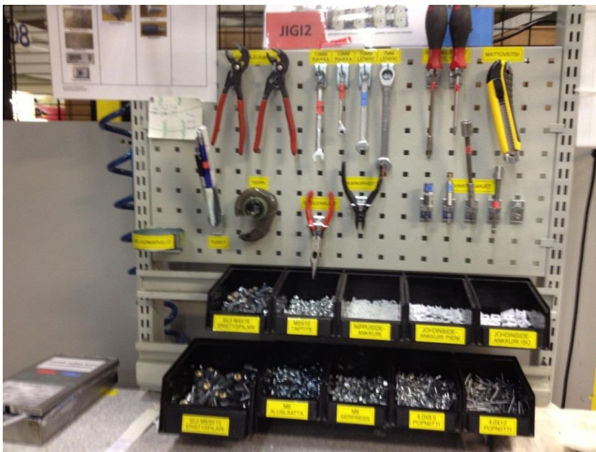
Kuva 11. Toinen esimerkki 5S:n mukaisesta työpisteestä.

4S vaiheessa erillisenä 4S-päivänä työpisteet tullaan käymään työntekijöiden sekä 5S-koordinaattoreiden toimesta vielä läpi ja tarkastetaan, että pisteillä ovat kaikki tarvittavat välineet ja että ne on merkattu asianmukaisesti.