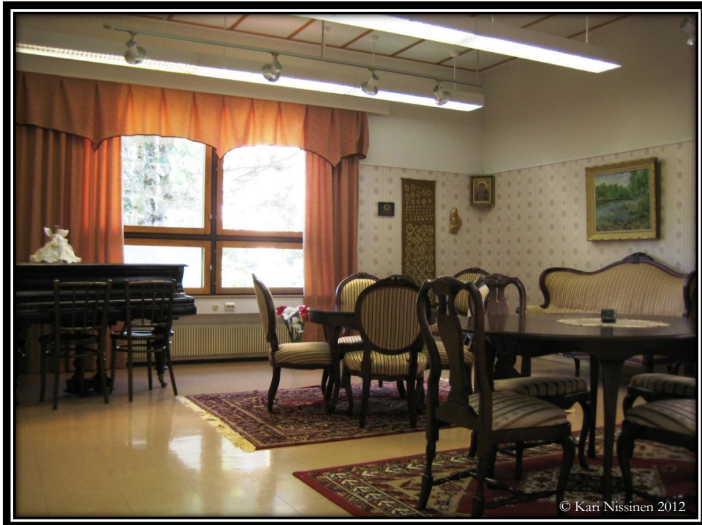
Marian Kartanon konsertti- ja seurusteluhuone