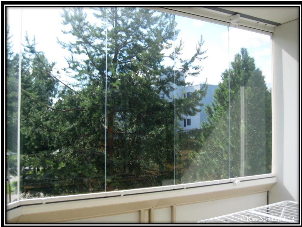
Näkymä asukkaan parvekkeelta