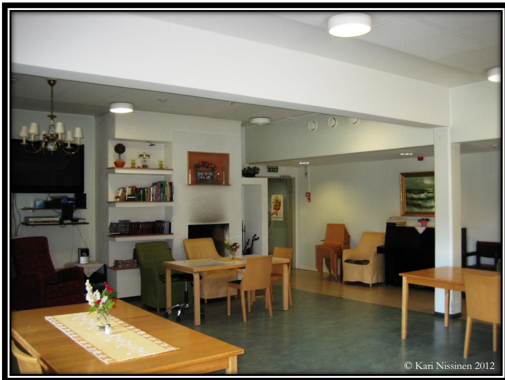
Ruokailu- ja oleskelutila