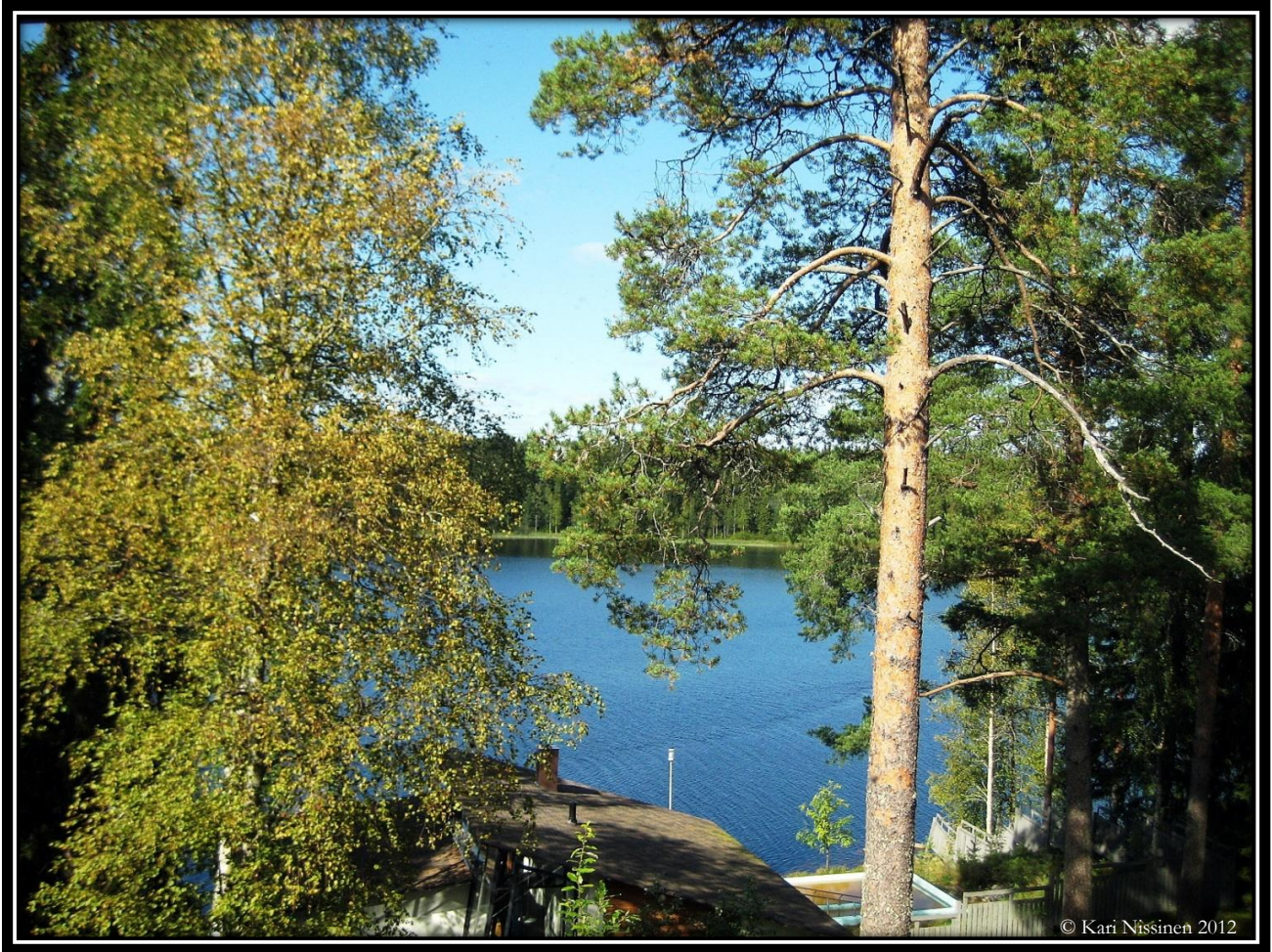
Onnelasta näkymä Kajaanin joelle