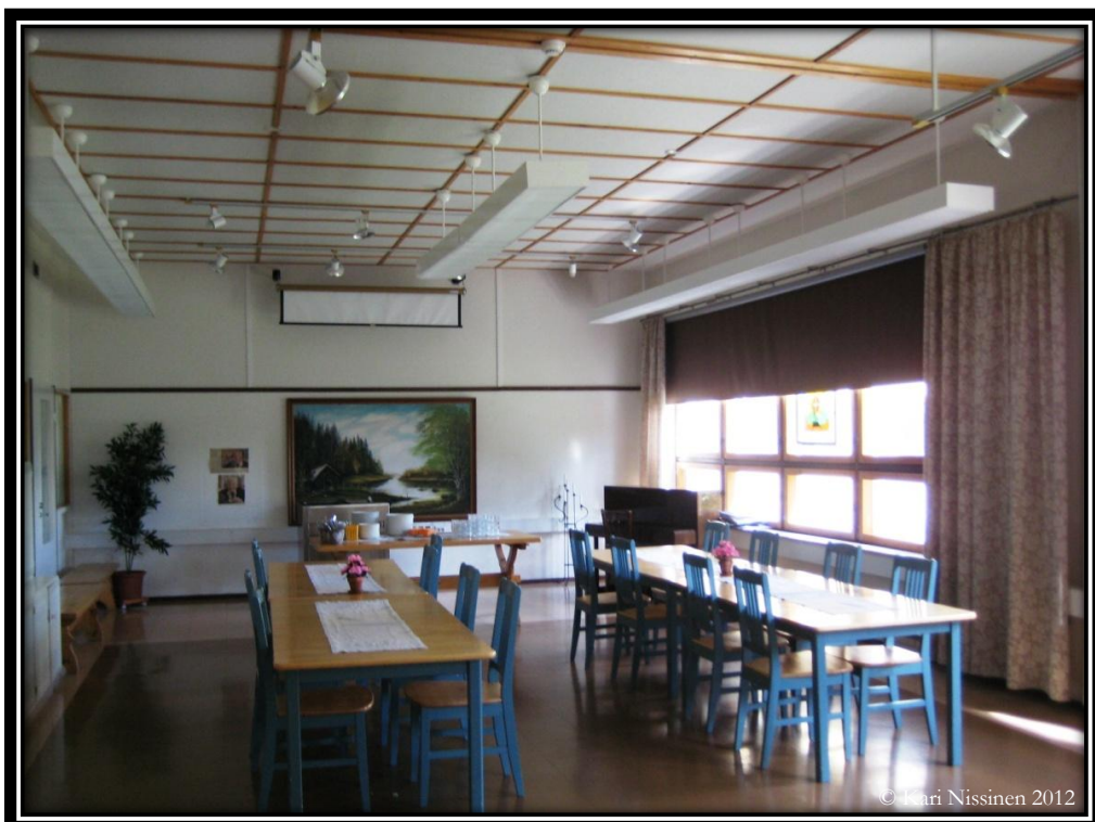
Marian Kartanon ruokasali