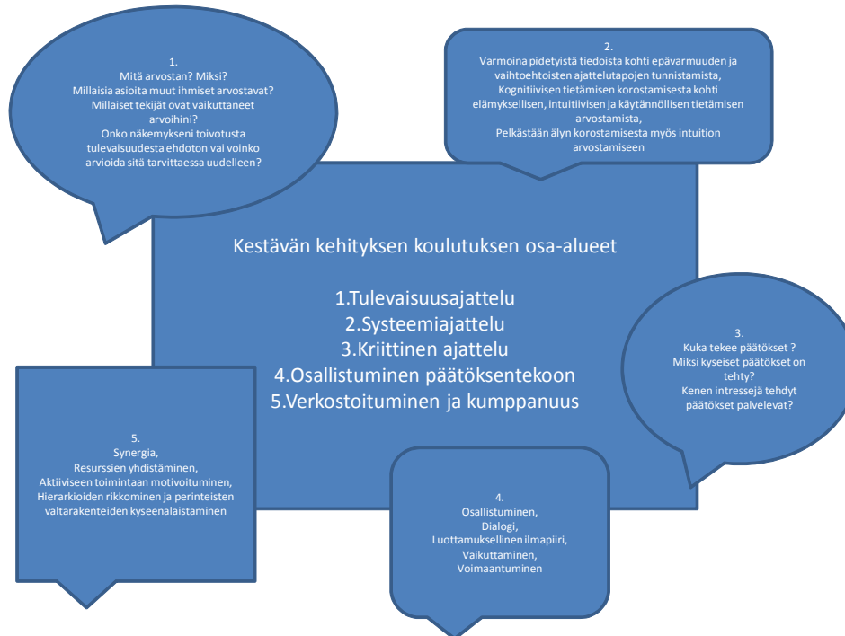
Kuvio 2. Kestävän kehityksen koulutuksen osa-alueet (mukaeltu Rohweder ym. 2008, 107).

kehitykseen. Tiedossa olevat keinot eivät johda muutokseen käyttäytymisessä. Tilbury ja Cooke ovat esittäneet viisi kestävän kehityksen koulutuksen osa-alueita, jolla voidaan muuttaa ajattelua ja toimintatapoja (Rohweder & Virtanen 2008, 57-58). Seuraavassa kuviossa on kuvattu osa-alueet lyhyesti.