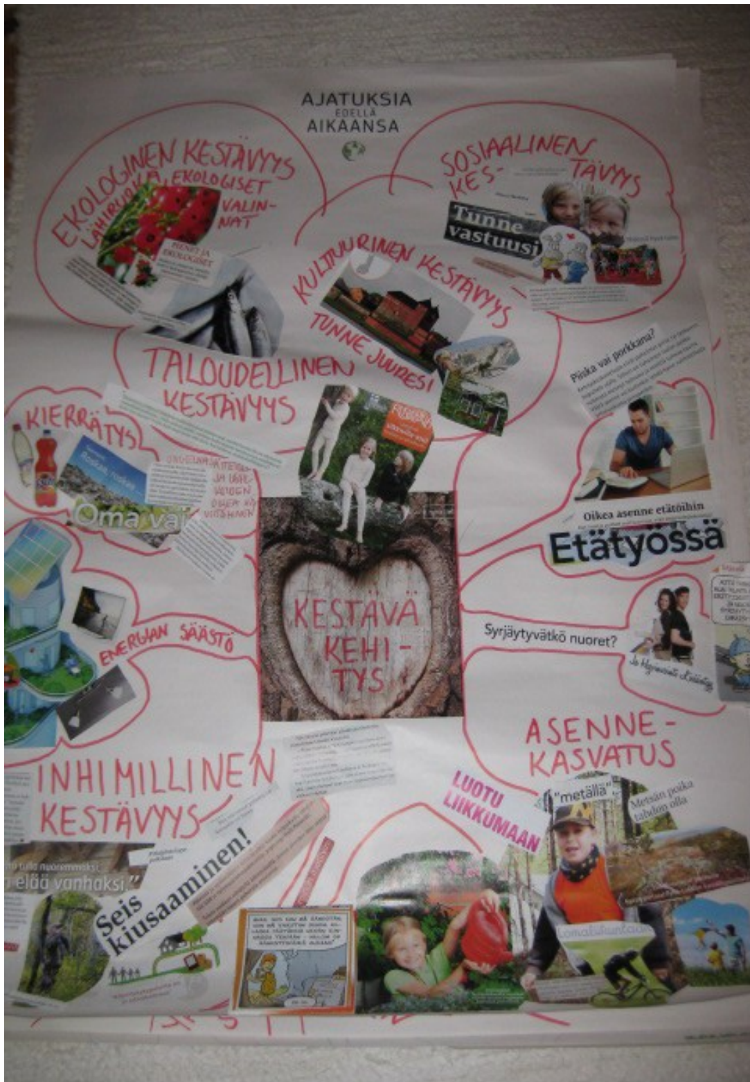
Kuva 2. Esimerkki valmiista ajattelun puusta.