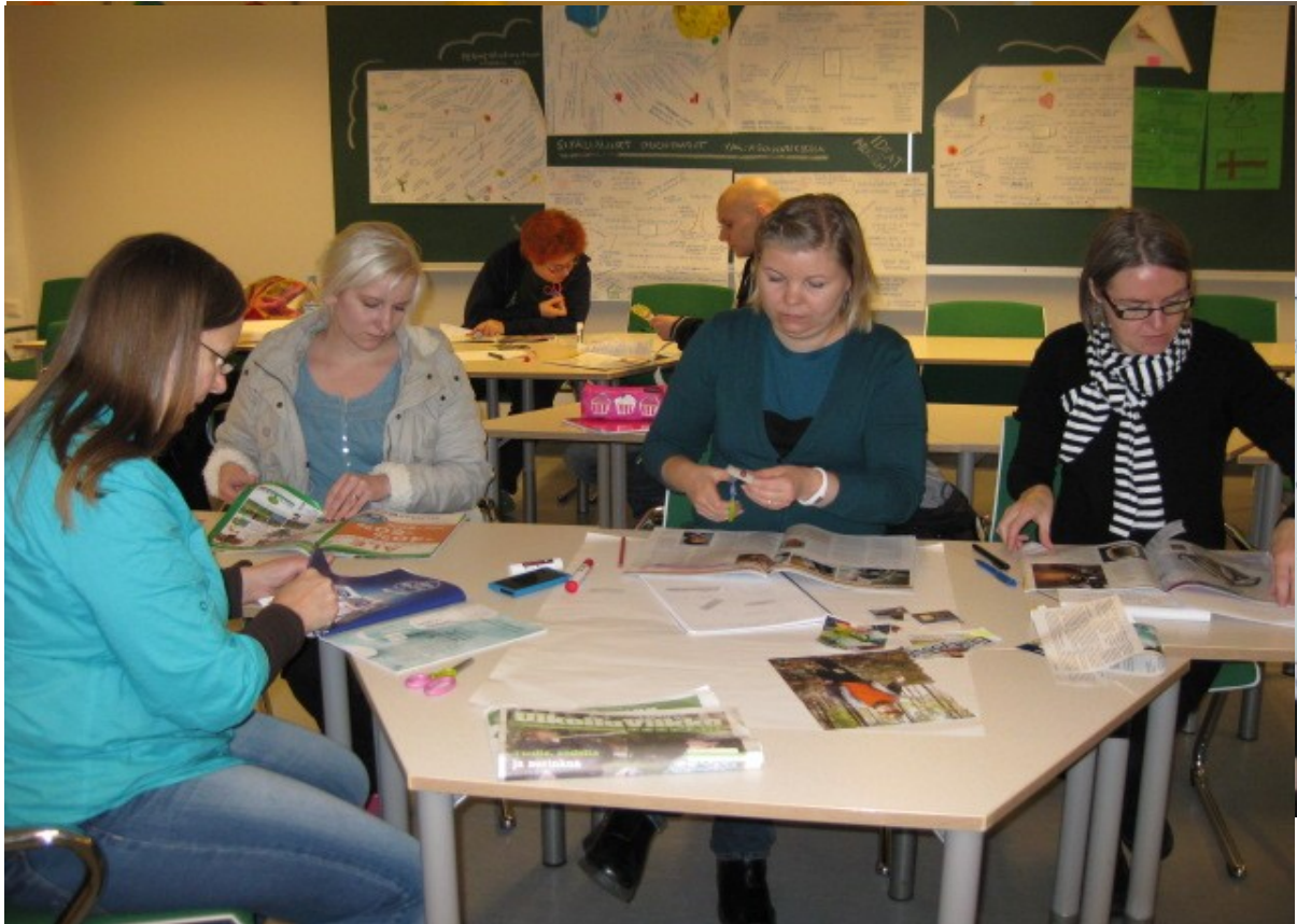
Kuva 1. Työskentelyvaihe.

Töiden valmistuttua ryhmät esittelivät ne toisilleen. Esimerkkejä valmiista ajattelun puista ovat kuvat 2. ja 3. Ryhmätöiden lopussa oli aikaa itsenäiseen tehtävään. Varasin mukaan mietelauseita erillisille lapuille ( liite 4.). Jokainen sai käydä valitsemassa itselleen ajankohtaisen mietelauseen. Kun ryhmä oli esitellyt yhteisen työnsä, kukin ryhmän jäsen luki vuorollaan valitsemansa mietelauseen ja kertoi valintansa perustelut. Moni pohti omaa käyttäytymistään suhteessa työkavereihin tai perheenjäseniin ja mietti mahdollisuutta toimia toisin jatkossa. Sosiaalisesti kestävä ulottuvuus antoi ajattelemisen aihetta vuorovaikutustilanteisiin.