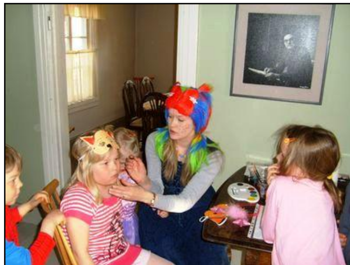
Kuva 5. Vappukarnevaali-tuokion osallistujia kasvomaalauksipisteessä.

Ensimmäisten osallistujien saadessa askartelunsa valmiiksi toinen meistä ohjaajista siirtyi tekemään kasvomaalauksia toiseen hieman isompaan tilaan. Kasvomaalauksen haluavat osallistujat tulivatkin kasvomaalaukseen hieman portaittain askartelujen valmistuessa hieman eri aikaan. Kukin sai valita valmiista malleista haluamansa kuvan sekä paikan, johon maalauksen halusi, muun muassa käteen tai kasvoihin. Kasvomaalauspuolesta taustalla soi myös musiikkia rennon tunnelman luomiseksi, jolloin kasvomaalauksista odottaneet ja maalaamista sivusta seuranneet lapset innostuivat jopa lauleskelemaan toiminnan lomassa. Maalauksia tehdessä päädyimme siihen, että toinen meistä ohjaajista tekisi kaikki kasvomaalaukset, monien vanhempien ollessa vielä askartelemassa lastensa kanssa. Ajattelimme toimintamme etenevän joustavasti ja osallistujille jäisi vielä aikaa vapaallekin toiminnalle. Kasvomaalauksen tekemisen taustalla meillä oli ajatuksena yleisesti mukavan ilmapiirin ja yhdessäolon tavoitteleminen.