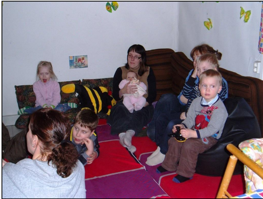
Kuva 1. Ystävyys-tuokion satuhetki.

Keskusteltuamme lukemaamme satuun liittyvistä asioista siirryimme toiseen tilaan, jossa lapset ja vanhemmat sekä me ohjaajat piirsimme isolle yhteiselle paperille satuun ja yleisesti ystävyyteen liittyviä asioita. Rennon tunnelman luomiseksi taustalla soi rauhallista musiikkia. Käsitellessämme aihetta sadun lukemisen ja yhteisen keskustelun lisäksi myös kuvallisen ilmaisun avulla, pyrimme innostamaan osallistujia yhteiseen tekemiseen toistensa kanssa.