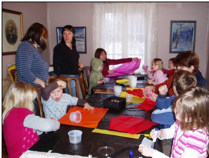
Kuva 3. Pääsiäis-tuokio. Osallistujat päällystävät ja koristelevat raeruohipurkkeja

Osallistujien saatua askartelunsa valmiiksi he saivat siirtyä toiminta-/leikkihuoneeseen. Varsinaista loppukokoukseen meillä ei ollut, vaan asetimme palautekyselyt toiminta-/leikkihuoneen pöydälle, jolloin vanhemmat saivat täyttää pääsiäistuokioon liittyvän palautekyselyn kahvittelun ja jutustelun lomassa. Näin saimme jälleen joitakin kehittämissideoita ja ehdotuksia jatkotoimintaamme ajatellen. Saimme myös vanhemmilta välitöntä palautetta illan tuokiomme sujuvuudesta.