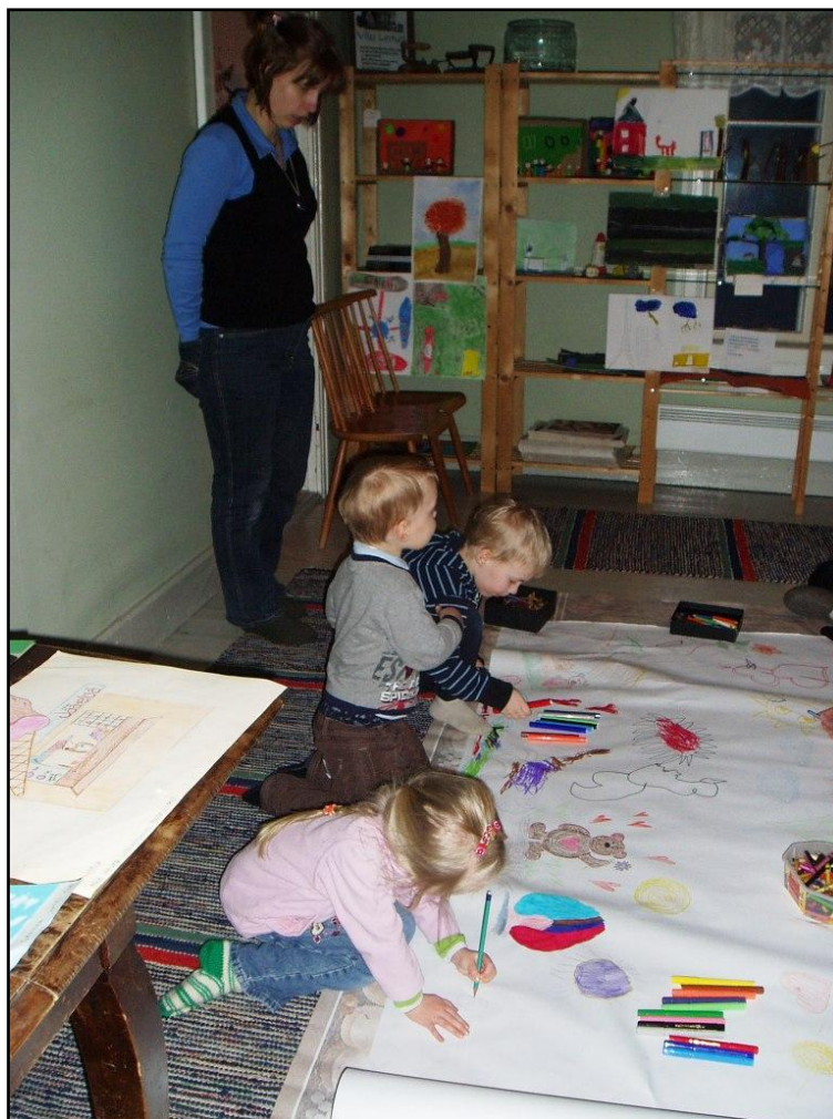
Kuva 2. Osallistujat piirtävät ystävyyteen ja satuun liittyviä asioita.

Ennen ensimmäisten osallistujien kotiin lähtöä pyysimme vanhempia täyttämään palautekyselyn järjestämäämme toimintaan liittyen. Näin saisimme kaipaamaamme palautetta illan sujuvuudesta sekä mahdollisista kehittämistarpeista jatkoa varten. Koska osa osallistujista lähti kotiin ennen varsinaista toimintatuokion lopetusta, laitoimme valmiin työn perhekahvilaan jääneiden osallistujien kanssa Villa Linturin seinälle. Näin jokainen osallistuja pääsisi ihastelemaan valmista aikaansaannostamme tulevien perhekahvilakertojen yhteydessä. Tämä saattaa osaltaan myös innostaa yhdessä tekemiseen omaehtoisesti tulevaisuudessa.