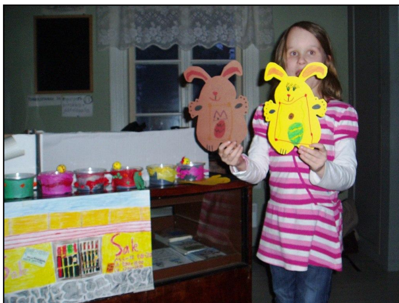
Kuva 4. Pääsiäis-tuokion askarteluhetkistä: raeruohipurkkeja, koristeita ja pääsiäispupuja.

Osallistujien saatua askartelunsa valmiiksi he saivat siirtyä toiminta-/leikkihuoneeseen. Varsinaista loppukokoukseen meillä ei ollut, vaan asetimme palautekyselyt toiminta-/leikkihuoneen pöydälle, jolloin vanhemmat saivat täyttää pääsiäistuokioon liittyvän palautekyselyn kahvittelun ja jutustelun lomassa. Näin saimme jälleen joitakin kehittämissideoita ja ehdotuksia jatkotoimintaamme ajatellen. Saimme myös vanhemmilta välitöntä palautetta illan tuokiomme sujuvuudesta.