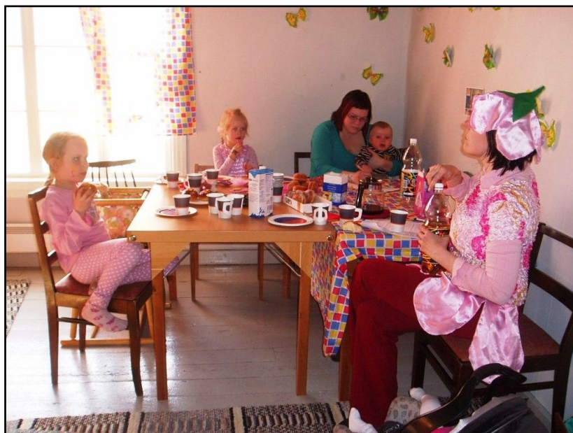
Kuva 6. Osallistujat nauttimassa vappu-tuokion tarjottavia.

jolloin vanhemmat täyttivät jakamamme palautekyselyt ja kertoivat ajatuksistaan vappukarnevaaliin sekä yleisesti järjestämiimme toimintatuokioihin liittyen.