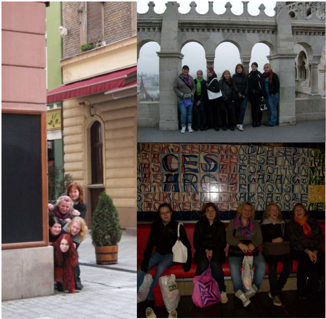
KUVA 2. Tilannekuvia ryhmästä Budapestissa: Hotellimme nurkalta, Linnavuorelta sekä metrotunnelista.

16.11.- 30.11.2009 Nuoret toteuttivat valokuvanäyttelyn Rantasalmen kirjastoon. Nuoret toteuttivat näyttelyn kirjastoon kertoen Budapestin matkastaan kuvin ja sanoin. Näyttely koostui matkalta otetuista valokuvista sekä nuorten matkapäiväkirjoista.