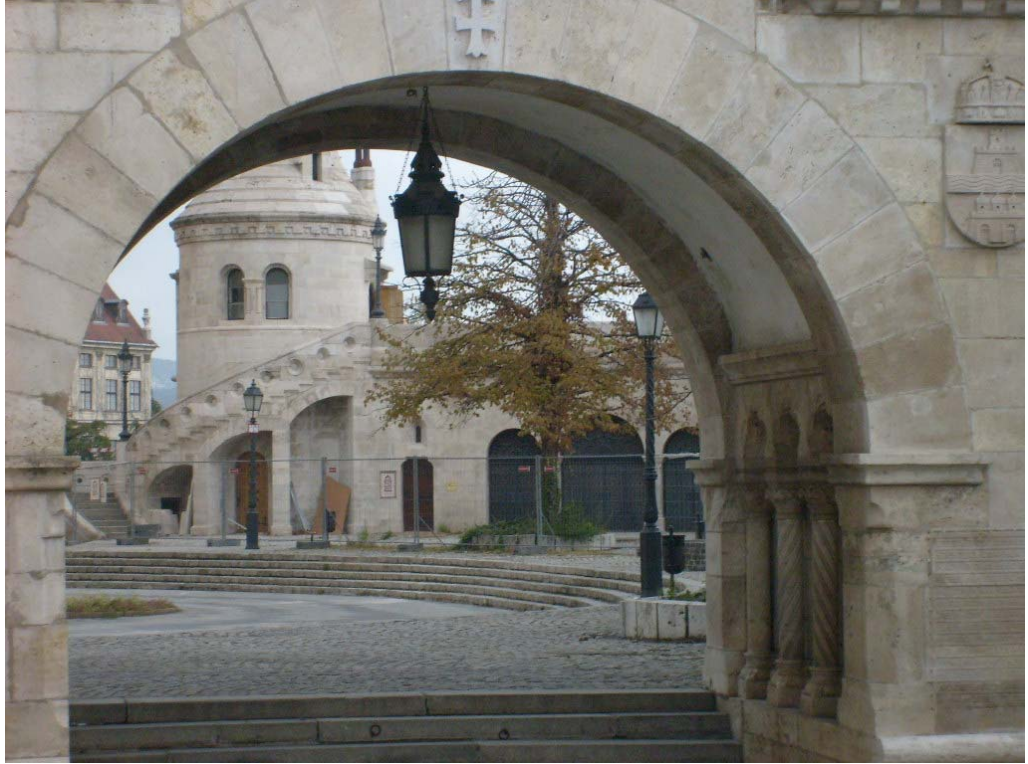
KUVA 1. Kalastajalinnake Budapestissa.

Ei ole olemassa muureja, on vain siltoja. Ei ole olemassa suljettuja ovia, on vain portteja.