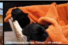
Pääsihtimänat koiriaan. Pennut 1 vk vanhoja.