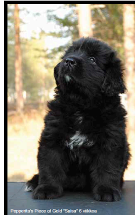
Pepperita's Piece of Gold "Salsa" 6 viikkoa

Aikanaan suunnitelmassa oli, että ensimmäiset Pepperita's-pennut olisivat berninpaimenkoira, mutta bernipennusunnitelmat ovat toistaiseksi jäissä. Minulla oli kesällä 2006 alustavasti bernin pennun etsintä käynnissä, mutta sattuma puuttui peliin ja eräänä aurin-