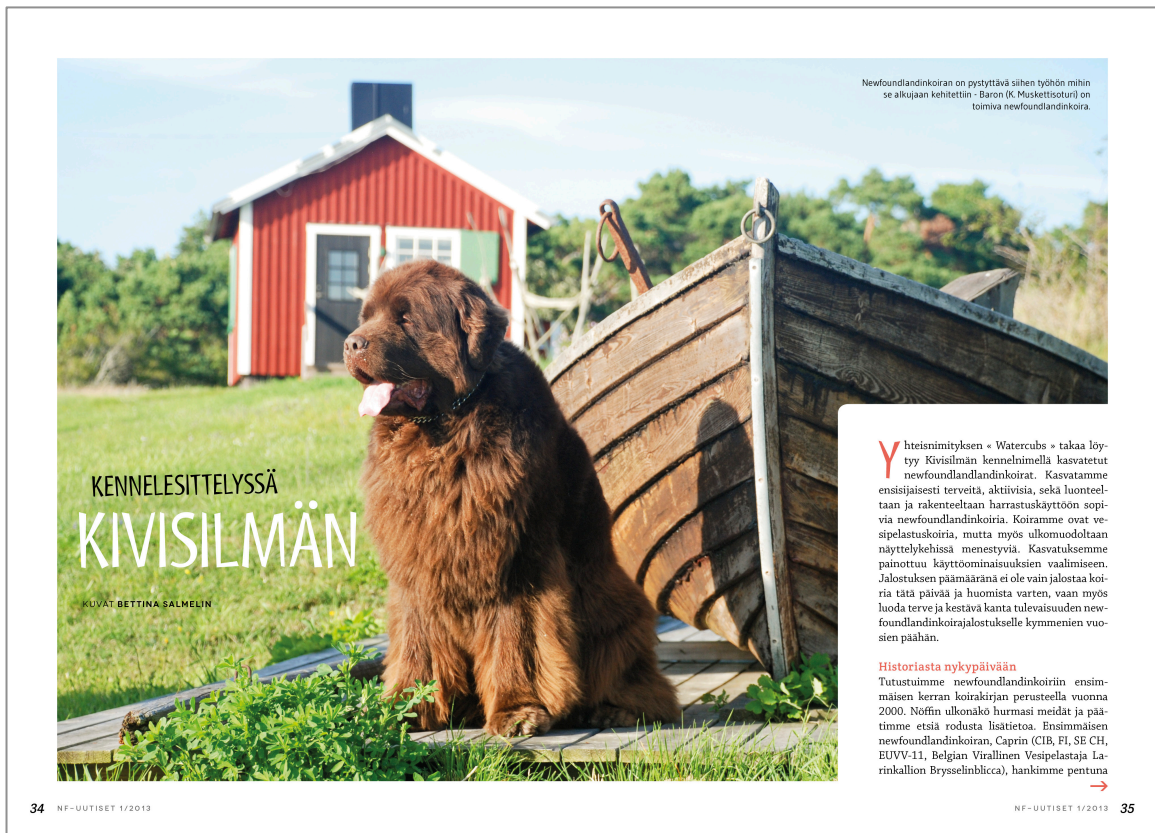
Kuva 10. Esimerkki kuvan käytöstä artikkelin avausaukeamalla lehden uudessa ulkoasussa.

10 näkyy esimerkki Kennelesittelyssä-artikkelin avausaukeamasta ulkoasu-uudistuksen jälkeen.