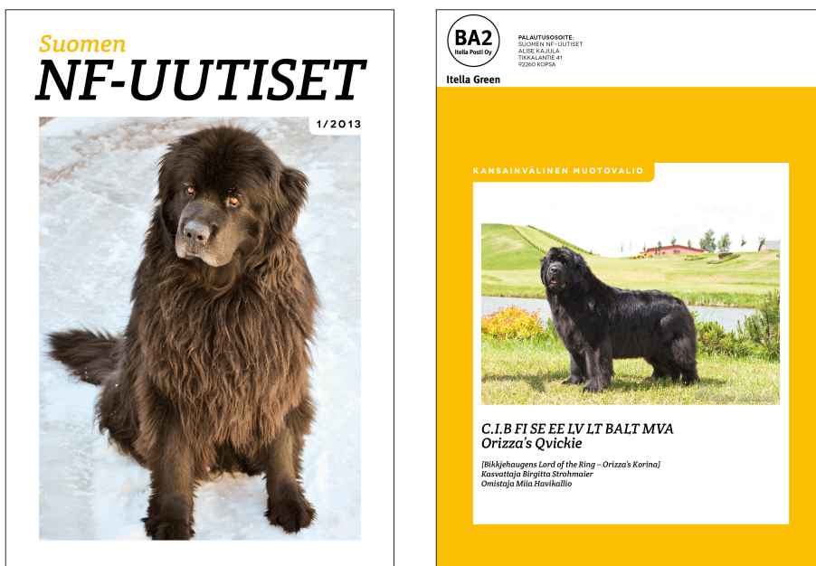
Kuva 7. Tunnusvärin käyttö lehden etusivun logossa ja takakannessa.

Tunnusväriä käytetään takakannen lisäksi etukannen logossa (katso kuva 7) sekä lehden ensimmäisillä ja viimeisillä sivuilla yhdistyksen, lehden tekijöiden ja newfoundlandinkoirakasvattajien yhteystietojen yhteydessä sekä lehden sisällysluettelosivulla. Tämän lisäksi tunnusväriä käytetään lukijaa opastavissa osatunnuksissa. Näin tunnusväri näkyy lehden kansien lisäksi myös lehden sisäisivuilla ja luo yhteyden kansien ja sisällön välille.