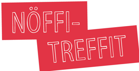
Kuvat 5. Nöffitreffien uudistettu palstatunnus.

Käytin Nöffitreffien uuden tunnuksen suunnittelun lähtökohtana lehden otsikkokäytöstä tutun Myriad Std -fontin vaihtoehtoista Sketch-leikkausta (katso kuva 5). Näin tunnuksella on visuaalinen yhteys lehden muuhun typografiaan.