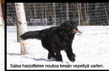
Salsa harjoittelee noutoa kesän vepelily varten.