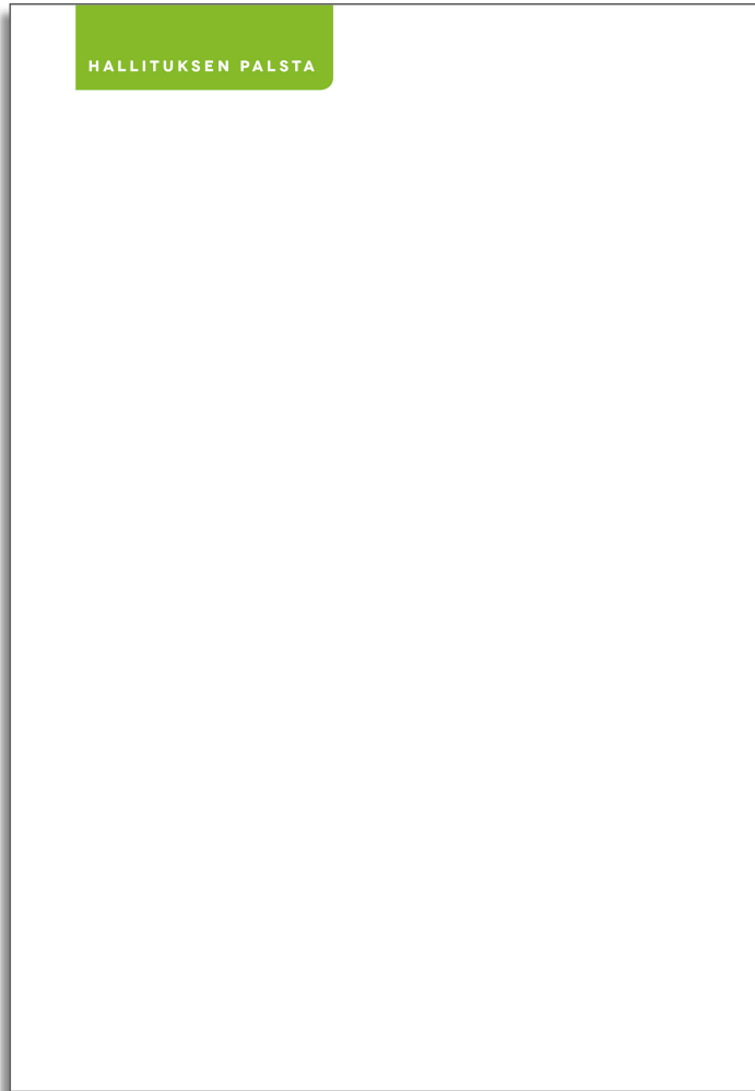
Kuva 3. Luonnos osastotunnuksen sijainnista lehden sivulla.

pääasiassa lehden alkuun ja loppuun sijoitettujen vakipalstojen ja osastojen yhteydessä.