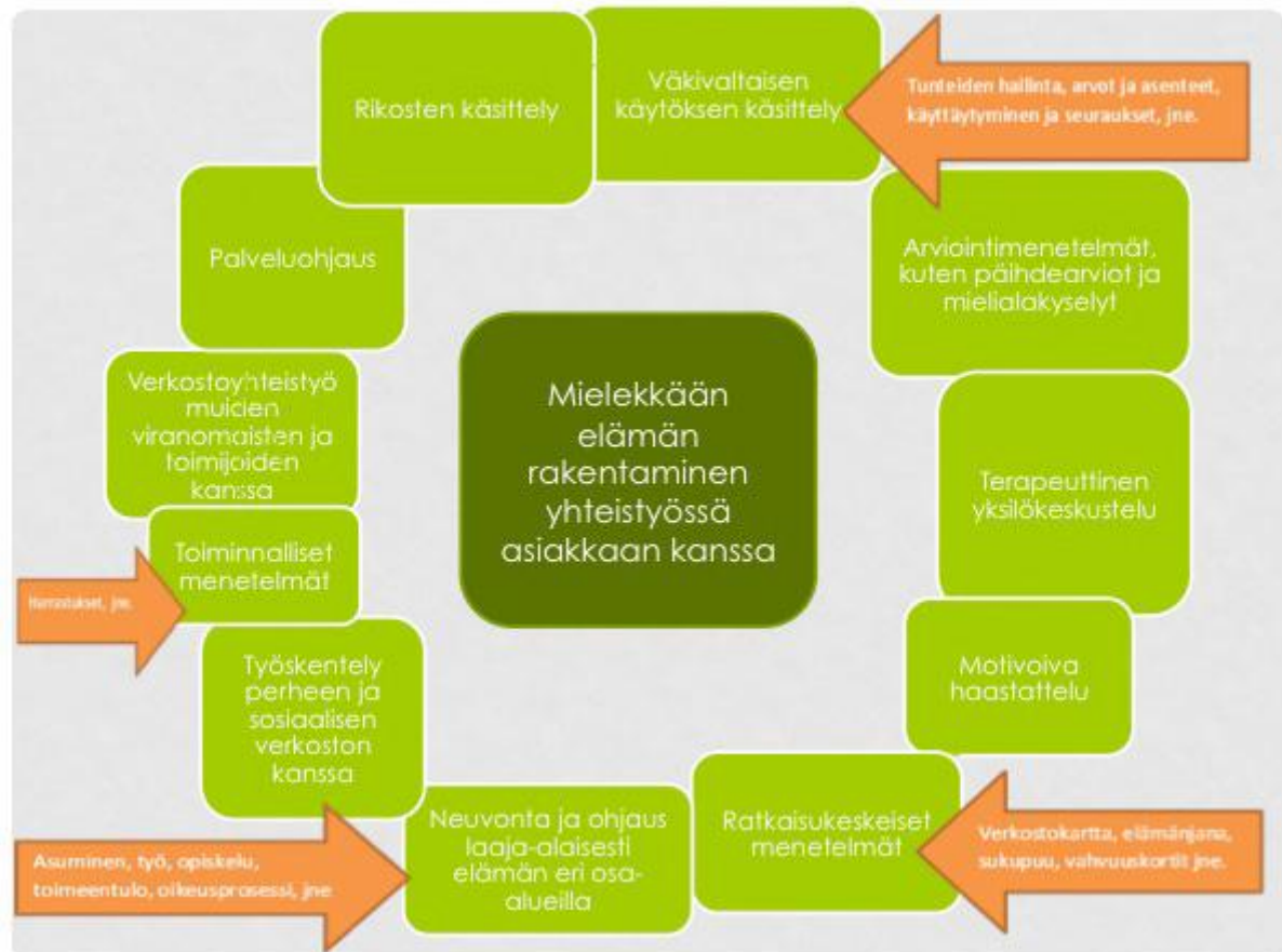
KUVIO 2 Mielekkään elämän rakentamista kuvaava ympyrä. (Oulun Setlementti2013)

Via Vis:n asiakastyö on suunnitelmallista ja terapeuttisesti orientoitunutta hoidollista työtä. Työskentely ei keskity vain päihde- ja väkivalta-oireiluun, vaan asiakas kohdataan kokonaisvaltaisesti. Työssä pyritään vahvistamaan ihmisen positiivisia elämäntaitoja ja kokoamaan uusi elämänsä, joka vie kohti väkivallattomuutta. Työskentelyn periaatteita ovat: asiakaslähtöisyys, omaehtoisuus ja puolueettomuus. (Oulun Setlementti 2013.)