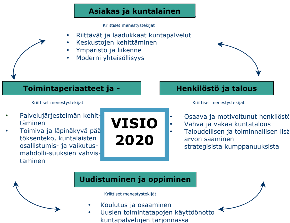
Kuva 2. Kunnan Visio 2020. Tavoitteita ohjaavat kriittiset menestystekijät.